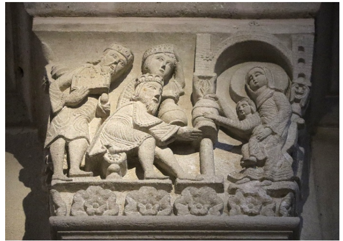
Kapitell in Autun

Mit Ihrem Hotel in Dracy-le-Fort , einem Ort in der Nähe von Chalon-sur-Saône, erreichen Sie den zweiten Standort Ihrer Reise . Nach dem Zimmerbezug für 4 Übernachtungen werden Sie im Restaurant des Hotels zum Abendessen erwartet.