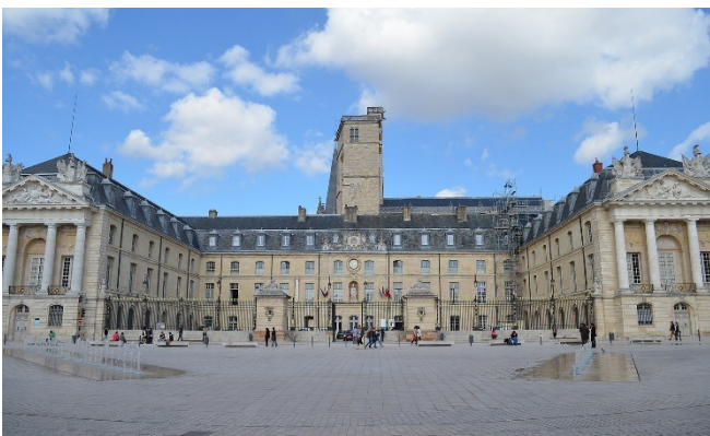
Herzogspalast in Dijon

Einer der bedeutendsten Bauten der burgundischen Gotik ist die benachbarte Kirche Notre-Dame mit ihrer eigentümlichen Fassade, die eine große Zahl fantasievoller Wasserseiter schmückt.