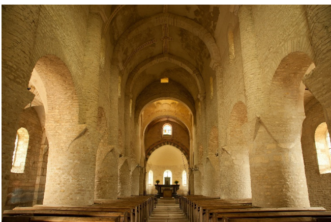
Saint-Martin in Chapaize

Wenige Kilometer westlich liegt das Dorf Chapaize , dessen ehemalige Prioratskirche Saint-Martin zu den schönsten frühromanischen Kirchen Burgunds gehört. Das dreischiffige Gotteshaus besitzt einen überraschend hohen Glockenturm und beeindruckt mit seiner schlichten Eleganz. Aus gelbem Kalkstein wurde die romanische Dorfkirche Saint-Pierre in Brancion erbaut. Im Innenraum haben sich Wandmalereien aus dem 14. Jahrhundert erhalten.