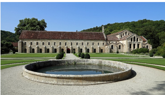
Abtei Fontenay

Am Nachmittag besuchen Sie die Zisterzienserabtei Fontenay. Die mittelalterliche Klosteranlage wurde im Jahr 1118 von Bernhard von Clairvaux gegründet und vermittelt ein anschauliches Bild vom Leben und Wirken der Mönche.