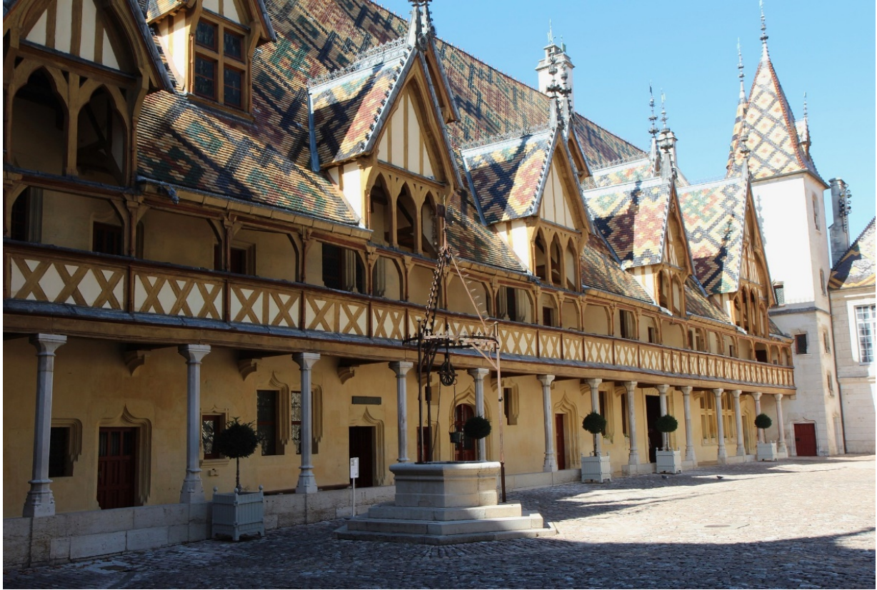
Hôtel-Dieu in Beaune

Eine bezaubernde Landschaft mit ihren Klöstern, Kirchen und Städten erzählt die Geschichte ihrer Bedeutung für das mittelalterliche Europa. Über viele Jahrhunderte war Burgund eines der führenden geistigen, kulturellen und politischen Zentren unseres Kontinents . Weit über die Region hinaus prägten die Abtei von Cluny und der von Bernhard von Clairvaux gegründete Orden der Zisterzienser das klösterliche Leben. Im ausgehenden Mittelalter waren es dann die Herzöge von Burgund , die durch wirtschaftliches Geschick, Diplomatie und Kriege für kurze Zeit ein europäisches Großreich schufen.