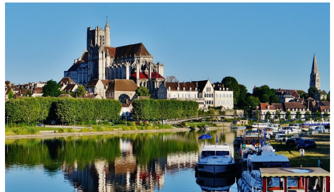
Auxerre CCBYSA4.0 Zairon at-wikimedia.commons

Rückfahrt zum Hotel und gemeinsames Abendessen.