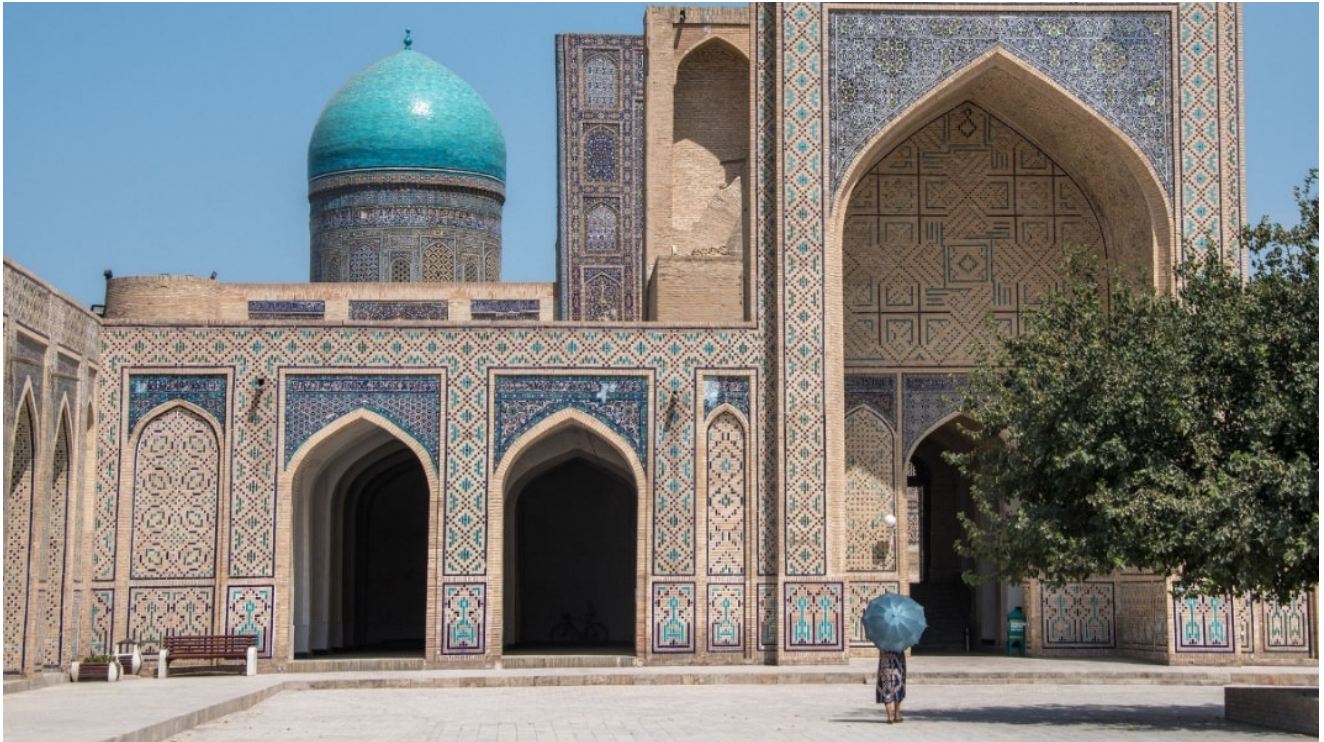
Kalyan-Moschee in Buchara