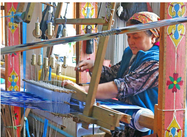
Seidenverarbeitung in Margilan

Der heutige Tag steht ganz im Zeichen der Seide . Das Klima der Region bietet die idealen Voraussetzungen für die Zucht von Seidenraupen. In Margilan besuchen Sie eine Seidenmanufaktur.