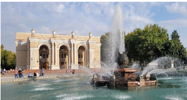
Alisher-Navoi Theater

Überraschen wird Sie die Verbindung von traditionellem Flair und monumentalen, neuzeitlichen Bauwerken! Denn längst hat sich Taschkent in eine moderne Metropole mit europäischen und asiatischen Einflüssen gewandelt. Vom Einfluss sowjetischer Herrschaft zeugen u. a. das Alisher-Navoi Theater und das Opernhaus von Taschkent , das vom Stararchitekten Alexei Schtschussew entworfen wurde (Außenbesichtigungen).