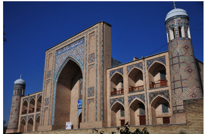
Medrese Kukaldash

Mit einem gemeinsamen Abendessen in einem Restaurant klingt der Tag aus.