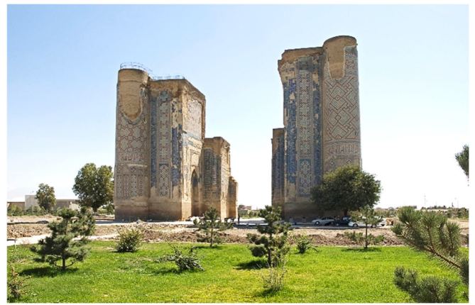
Ak-Sarai-Palast

Über den Gebirgspass Tachta Karatscha führt die Reise weiter nach Schachrisabz der legendären Geburtsstadt Timurs. Sie zählt den frühen Zentren seiner Herrschaft . Gegründet wurde die als grüne Stadt bekannte Siedlung bereits im 3. Jh. v. Chr. Im 14. Jh. entstanden unter dem ehrgeizigen Mongolenfürsten eindrucksvolle Bauten, die er mit einer 11 m hohen und bis zu 5 m dicken Mauer befestigen lies.