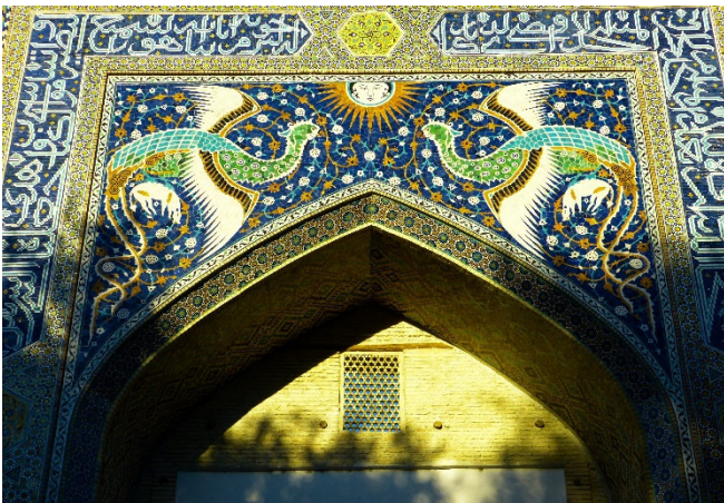
Medrese Nadir-Divan-Begi

Lassen Sie sich faszinieren von der Pracht und Anordnung der blau und türkis gekachelten Medrese Kukeldasch , dem ältesten Gebäude am Labi Chaus, der Medrese Nadir-Divan-Begi und der Chanaka Nadir-Divan-Begi , einer ehemaligen Pilgerunterkunft. Im Anschluss haben Sie Gelegenheit, sich mit einem der bekanntesten Puppenspieler Bucharas in seiner Marionetten-Manufaktur zu unterhalten.