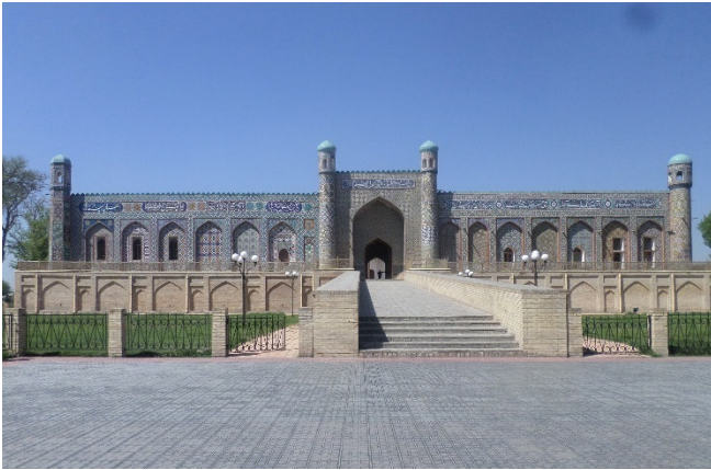
Palast des Khudayar-Khan

Der Palast des Khudoyar Khan ist ein schönes Beispiel für die glanzvollen königlichen Residenzen in der Geschichte Zentralasiens. Das bemerkenswerte Gebäude mit seiner 70 m hohen, mit farbenprächtigen Fliesen und Ornamenten geschmückten Fassade, bewahrt die Erinnerung an den letzten Herrscher des Kokand Khanats.