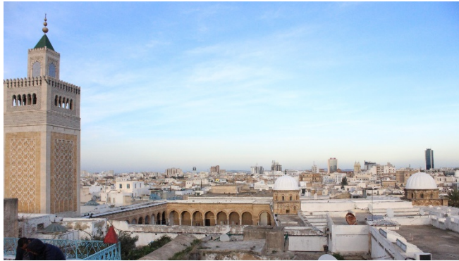
Panoramablick auf Tunis

Zimmerbezug für 4 Übernachtungen und gemeinsames Abendessen im Hotel.