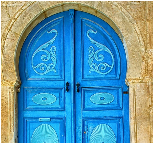
Tür in Sidi Bou Said

Rückfahrt zum Hotel und gemeinsames Abendessen.