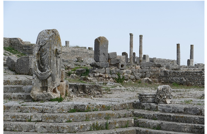
Statue in Dougga

Rückkehr zum Hotel und gemeinsames Abendessen.