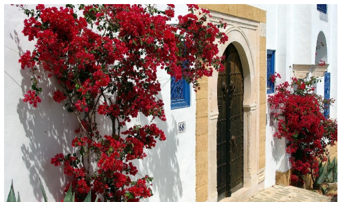
Sidi Bou Saïd

Rückfahrt zum Hotel und gemeinsames Abendessen.