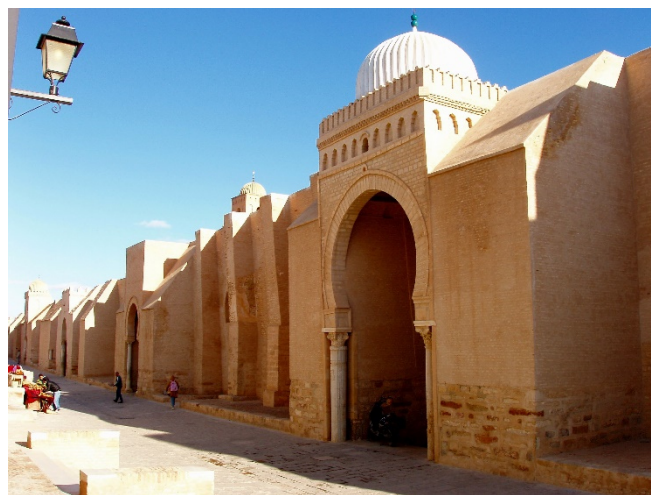
Moschee von Kairouan CCBYSA2.0 Darmian entwistle at-wikimedia.commons

Karthago CC0 pixabay August Macke: Eselsreiter CC0 at-wikimedia.commons Sidi Bou Saïd CC0 pixabay