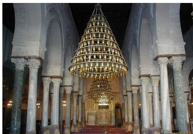
Moschee in Kairouan

Rückfahrt zum Hotel und gemeinsames Abendessen.