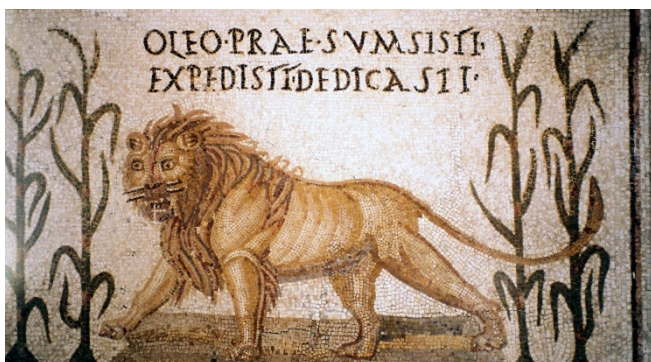
Mosaikdetail im Bardo-Museum

Am Nachmittag besuchen Sie das Bardo-Museum, eines der bedeutendsten Museen Tunesiens und Nordafrikas. Untergebracht in einem ehemaligen Palast aus dem 19. Jh., zeigt es eine der weltweit größten Sammlungen römischer Mosaiken .