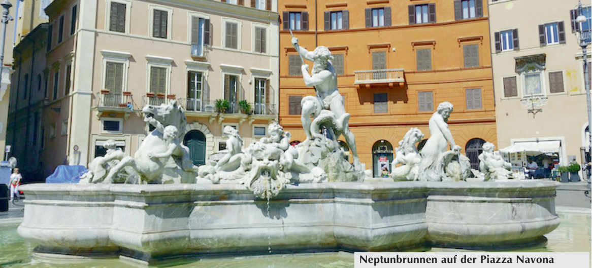
Neptunbrunnen auf der Piazza Navona