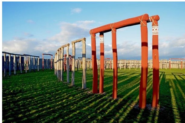
Ringheiligtum in Pömmelte

gilt. Südlich von Magdeburg entdeckten Archäologen im Jahr 1991 die Reste einer Ritualanlage , in der vielfältige religiöse Handlungen ausgeübt wurden. Von einer Aussichtsplattform bietet sich ein guter Überblick über das rekonstruierte Bauwerk aus Palisadenringen, Wällen und Gruben.