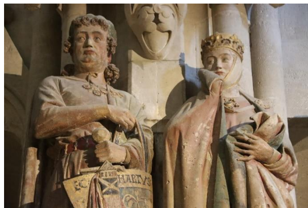
Stifterfiguren im Naumburger Dom

Wenige Kilometer südlich an der Straße der Romanik liegt die Stadt Naumburg (Saale) . Nach einer Mittagspause in der Altstadt führt ein Spaziergang zum Dom St. Peter und Paul , dessen Westchor eines der wichtigsten Werke der Frühgotik darstellt. Bei der Besichtigung bewundern Sie auch die berühmten Stifterfiguren des Naumburger Meisters.