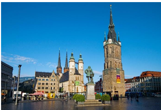
Halle (Saale) Marktplatz

Weiterfahrt zu Ihrem Standorthotel im Zentrum von Halle (Saale) . Nach dem Zimmerbezug für vier Übernachtungen klingt der Tag mit einem gemeinsamen Abendessen im Hotel aus.