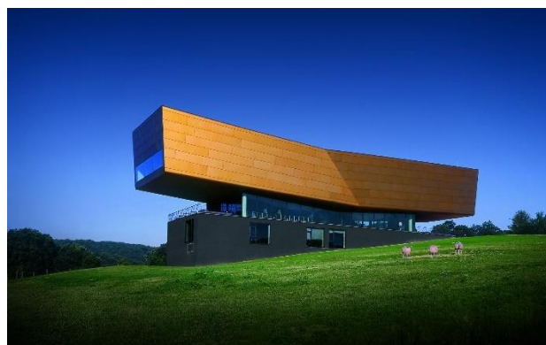
Arche Nebra

Erstes Ziel Ihres Ausflugs ist die Arche Nebra . Ganz in der Nähe des Fundortes der Himmelsscheibe wurde im Jahr 2007 ein innovatives Besucherzentrum eröffnet, dessen preisgekrönte Architektur das Motiv der goldenen Sonnenbarke aufnimmt. Lassen Sie sich bei einer individuellen Führung von dem außergewöhnlichen Konzept begeistern!