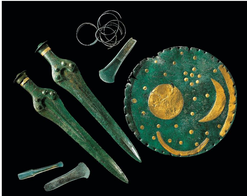
Hortfund von Nebra

Im Herzen Deutschlands haben Archäologen in den vergangenen Jahrzehnten immer wieder sensationelle Entdeckungen gemacht. So wurde nahe der kleinen Stadt Nebra im Jahr 1999 die berühmte Himmelsscheibe aus der frühen Bronzezeit entdeckt, die neue Erkenntnisse über das astronomische Wissen dieser Epoche brachte. Einen Beleg für die systematischen Himmelsbeobachtungen liefern auch das Sonnenobservatorium Goseck und das Ringheiligtum Pömmelte .