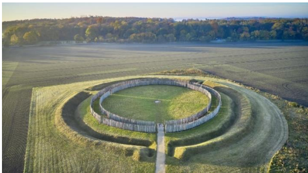
Sonnenobservatorium Goseck

Jahren als ältestes Sonnenobservatorium der Welt gilt. Die Ausrichtung der Palisadenringe ist der archäologische Beleg für die systematischen Himmelsbeobachtungen jener Frühzeit. Bei einer fachkundigen Führung erfahren Sie mehr über die Zusammenhänge der monumentalen Anlage.