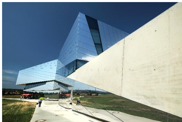
paläon in Schöningen

Zum Abschluss Ihrer Reise besuchen Sie das paläon Forschungsmuseum Schöningen , das seine Besucherinnen und Besucher mitnimmt auf eine Zeitreise in die Altsteinzeit. Im Mittelpunkt des innovativen Ausstellungskonzepts stehen die Schöninger Speere . Die ganz in der Nähe des Museums gefundenen Holz Waffen zählen zu den wichtigsten archäologischen Funden weltweit. Bei einer fachkundigen Führung durch die Dauerausstellung erhalten Sie einen spannenden Einblick in die Sammlungen des Museums und neue Grabungserkenntnisse.