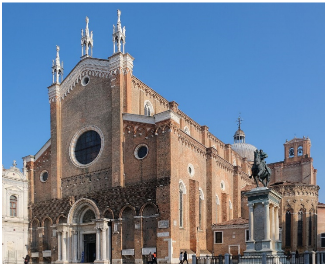
Santi Giovanni e Paolo

Zum Ausklang des Tages werden Sie in einem Restaurant in der Nähe Ihres Hotels zu einem gemeinsamen Abendessen erwartet.