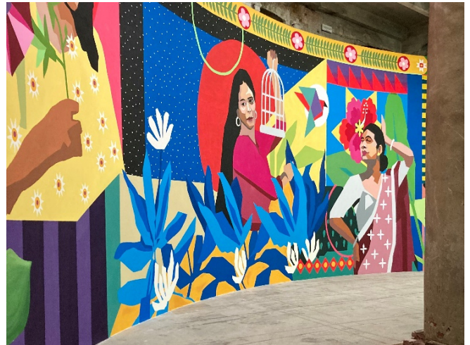
Biennale 2024