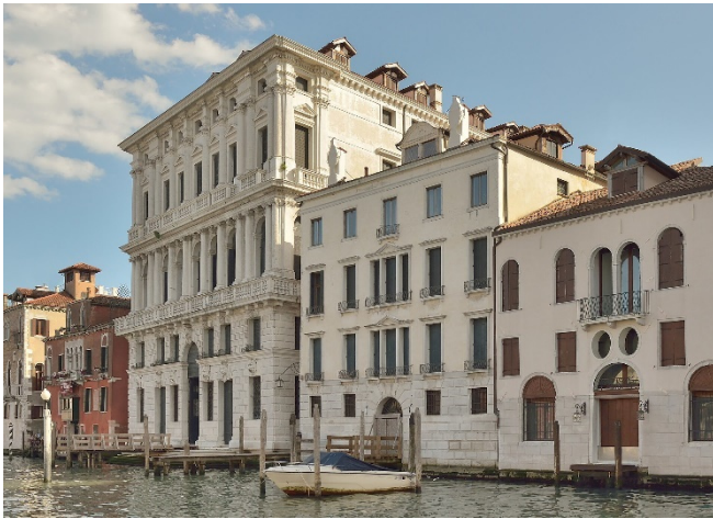
Fondazione Prada