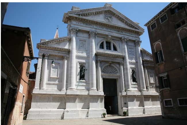
San Francesco alla Vigna

Am Nachmittag besuchen Sie die weniger bekannte Franziskanerkirche San Francesco alla Vigna , deren Fassade ein Werk Andrea Palladios ist. Das Gotteshaus, dessen Geschichte eng mit der Familie Grimani verbunden ist, beherbergt wertvolle Kunstwerke von Veronese, Bellini und Pietro Lombardo .