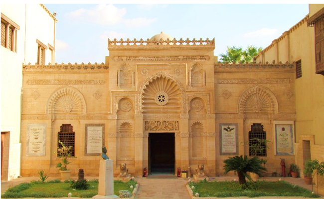
Koptisches Museum

Nach dem Zimmerbezug für zwei Übernachtungen klingt der Tag mit einem gemeinsamen Abendessen aus.