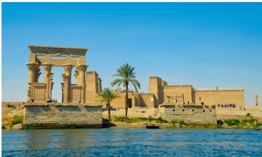
Isis-Tempel auf der Insel Philae

Noch immer prägt der Nil, Afrikas längster Fluss, Lebensspender und Wasserstraße zugleich, das sagenumwobene Land der Pharaonen . Hier entstand in Jahrtausenden eine Kultur, deren Bauwerke und Geheimnisse die Menschen seit jeher faszinieren.