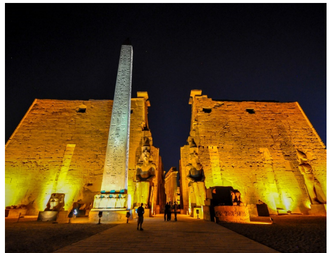
Luxor bei Nacht

In Deir el-Medina lebten die Arbeiter und Künstler, die die Grabanlagen in die Felsen schlugen und ausgestalteten. Am Rande der antiken Wohnsiedlung bauten die Einwohner in ihrer Freizeit eigene Gräber für sich und ihre Familien, die ebenfalls prachtvoll ausgemalt sind. Anschließend Besichtigung von Medinet Habu , dem Totentempel Ramses III. mit reliefgeschmückten Wänden zu Siegen, Opferzeremonien und Totenkult.