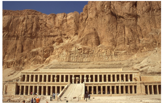
Tempel der Hatshepsut