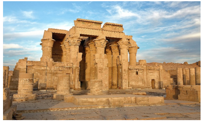
Kom Ombo