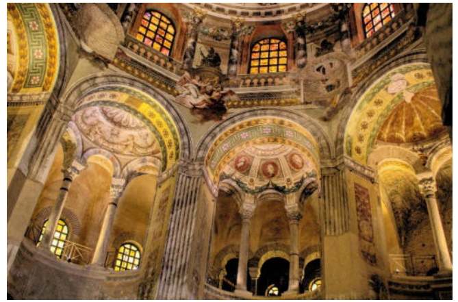
Basilika San Vitale

Die Basilika San Vitale stammt aus dem 6. Jh. und ist ein achteckiger Zentralbau mit Wandelgang , dessen Wände und Kuppeln mit byzantinischen Mosaiken geschmückt sind, darunter die Figuren von Kaiser Justinian und Kaiserin Theodora sowie ein Christus-Mosaik in der Apsis.