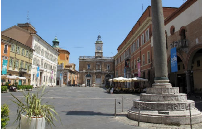
Piazza del Popolo

Zimmerbezug für 4 Übernachtungen und gemeinsames Abendessen im Hotel.