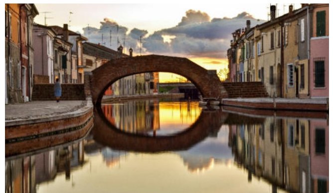
Brücke in Comacchio

Danach erwartet Sie die Basilika Sant'Apollinare in Classe mit ihrem typisch zylinderförmigen Glockenturm, eine der wichtigsten frühchristlichen Kirchen Ravennas. Der Name ‚Classis‘ bedeutet Flotte und erinnert noch heute an die einstige Rolle als bedeutender Militärhafen . An der rechten Wand der Basilika erinnert eine Inschrift an Bischof Apollinare , der das Christentum in Ravenna entscheidend vorantrieb.