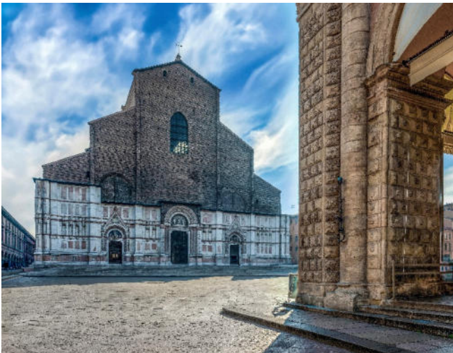
Basilica di San Petronio

Ausgangspunkt Ihrer Besichtigung ist die Piazza Malpighi mit dem Apsisbau der Franziskanerkirche. Ein Spaziergang führt Sie zur Piazza Maggiore , einem der beeindruckendsten Plätze Italiens. Er wird umrahmt von prächtigen mittelalterlichen Palazzi wie dem Palazzo Comunale und dem Palazzo di Re Enzo (Außenbesichtigungen). Auf der Piazza Maggiore sehen Sie außerdem den Neptunsbrunnen, ein Renaissance-Denkmal aus dem 16. Jh., das von Giambologna gestaltet wurde. In der Nähe befinden sich die Geschlechtertürme Asinelli und Garisenda , zwei mittelalterliche Wohntürme einflussreicher Familien. Besuch der Basilika San Petronio mit der von Giovanni da Modena ausgemalten Bolognini-Kapelle. Gelegenheit zu einer individuellen Mittagspause.