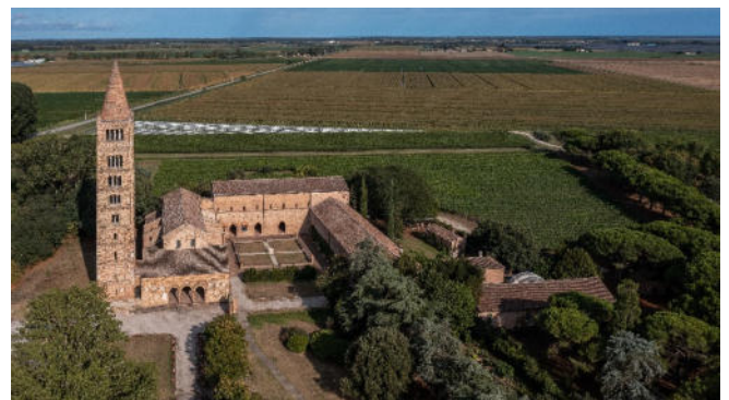
Abtei von Pomposa

Rückfahrt nach Ravenna und gemeinsames Abschiedsabendessen in einem ausgewählten Restaurant.