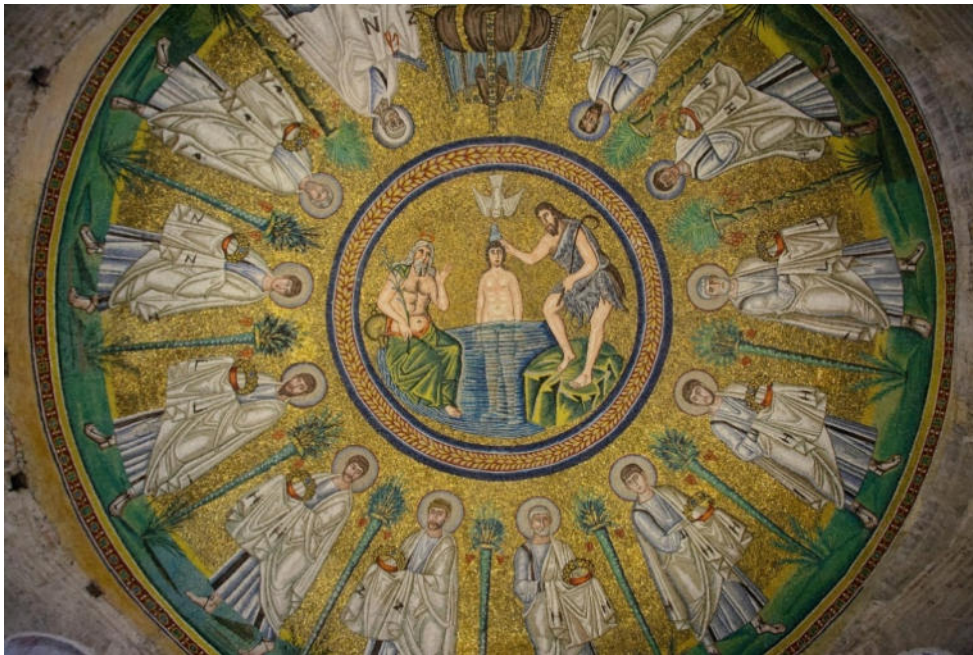
Mosaik in der arianischen Taufkapelle

In keiner Stadt lässt sich der Epochenwechsel von der Antike zum Mittelalter so anschaulich nachvollziehen wie im norditalienischen Ravenna. Nachdem die Stadt im 5. Jahrhundert mehr als 70 Jahre den weströmischen Kaisern als Residenz diente, folgten ihnen König Odoaker und der Gote Theoderich der Große . Die vom byzantinischen Baustil geprägten, mit glänzenden Mosaiken geschmückten Kirchen der Stadt zählen zu den schönsten Beispielen frühchristlicher Architektur in Italien und gehören zum UNESCO-Weltkulturerbe .