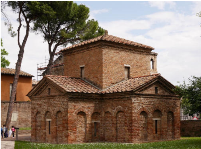
Mausoleum der Galla Placidia