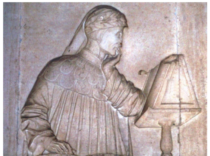
Grabstein von Dantes Grab

Besichtigung des Erzbischöflichen Museums von Ravenna , das sich im Palais des Erzbischofs nahe Dom und Baptisterium befindet. Hier werden Mosaikfragmente, religiöse Gewänder sowie Skulpturen und Reliefs gezeigt. Die Erzbischöfliche Kapelle mit Mosaiken aus dem 6. Jh. gehört ebenfalls zum Museum.