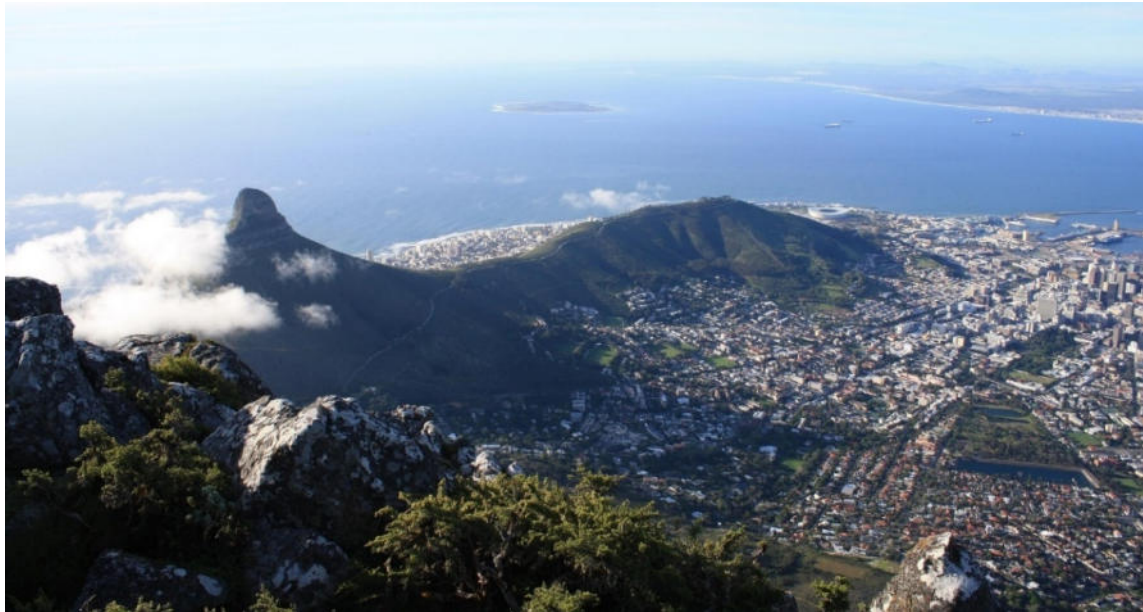
Blick auf Kapstadt

Am südlichen Ende Afrikas, wo sich Atlantik und Indischer Ozean treffen, erwarten Sie spektakuläre Landschaften , ein reiches multikulturelles Erbe und eine einzigartige Tier- und Pflanzenwelt . Von den zerklüfteten Küsten am Kap der Guten Hoffnung, über die beschaulichen Weinberge der Kap-Provinz, bis zu den weiten Savannen der Eastern Cape-Region, zeugen Städte, Nationalparks und historische Stätten von einer bewegten Geschichte . Eine der schönsten Panoramastraßen der Welt ist die Garden Route entlang Südafrikas traumhafter Südküste.