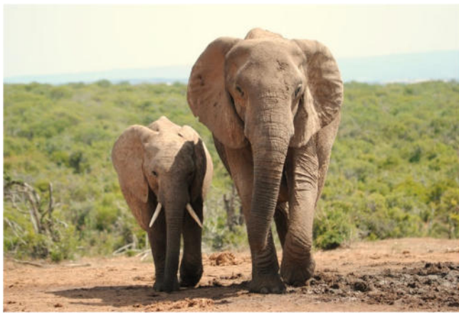
Elefantenkuh mit Kalb

Aus offenen Safarifahrzeugen aus haben Sie die Möglichkeit, die Tierwelt in ihrer natürlichen Umgebung zu beobachten. Die Elefantenherden, nach denen der Park benannt ist, stehen im Mittelpunkt. Daneben lassen sich Büffel, Zebras, Löwen, Warzenschweine und Nashörner beobachten. Insgesamt leben hier über 600 Säugetierarten. Die abwechslungsreiche Landschaft reicht von dornigen Buschlandschaften über offene Grasflächen bis hin zu sanften Hügeln und kleinen Flussläufen. Diese Bedingungen bieten gute Voraussetzungen für Sichtungen.