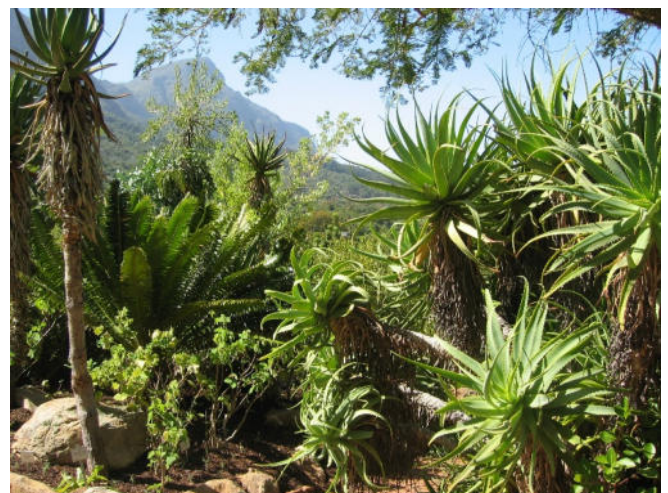
Botanischer Garten Kirstenbosch

Rückfahrt und gemeinsames Abendessen im Hotel.