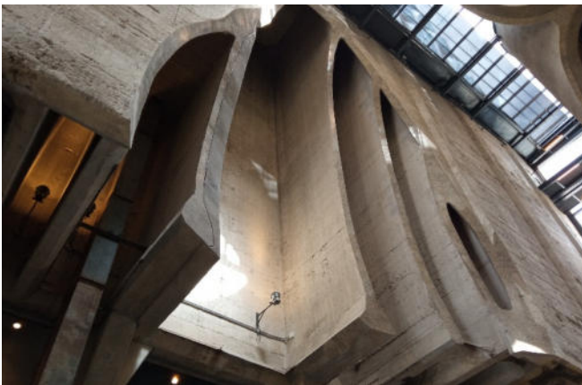
Silos im MOCAA Museum

Eine der international bekanntesten Künstlerinnen im Zeit MOCAA ist Zanele Muholi aus Südafrika, deren Werke häufig in dem Museum ausgestellt sind. Sie ist vor allem für ihre kraftvollen Fotografien bekannt, die gesellschaftliche Themen wie Identität, Gender und Menschenrechte beleuchten.