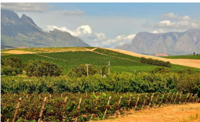
Weinberge in Südafrika

Zimmerbezug für 1 Übernachtung und gemeinsames Abendessen im Hotel.