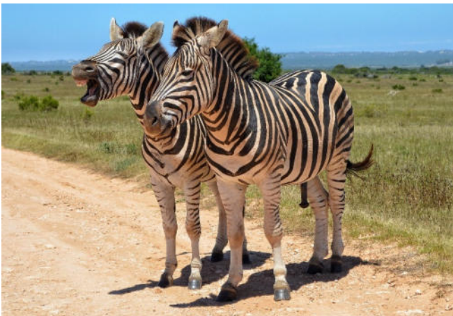
Zebras am Straßenrand

Am Nachmittag erfolgt der Transfer zum Flughafen von Kapstadt. Rückflug nach Deutschland.