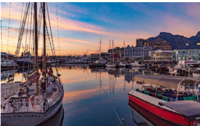
Hafen der Victoria & Albert Waterfront

Rückfahrt zum Hotel und Abendessen an der Victoria & Albert Waterfront , einem historischen Hafenviertel mit einer lebhaften Promenade direkt am Wasser.