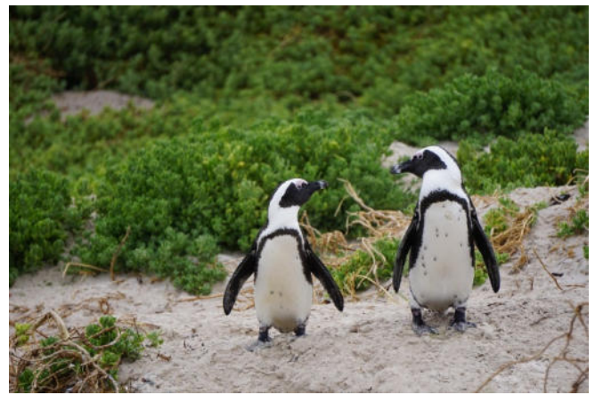
Pinguine am Boulders Beach CC0 pixabay