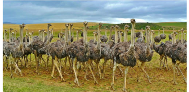
Herde von Straußen

Gemeinsames Abendessen auf der Farm. Fahrt zum Hotel und Zimmerbezug für 1 Übernachtung.