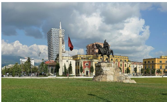
Skanderbeg-Platz in Tirana