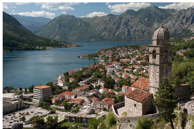
Bucht von Kotor

Dank der Unterstützung durch die UNESCO ist die Stadt heute wieder weitesgehend restauriert .