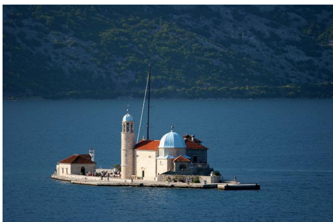
Maria vom Felsen

Auf der Uferstraße fahren Sie weiter nach Perast , direkt am Ufer der Bucht gelegen. Zu Perast gehören die kleinen Inseln St. Georg und St. Marien , auf die Sie einen guten Blick haben. Sie unternehmen eine Schifffahrt zur Insel St. Marien und besichtigen das Kloster „ Maria vom Felsen “.