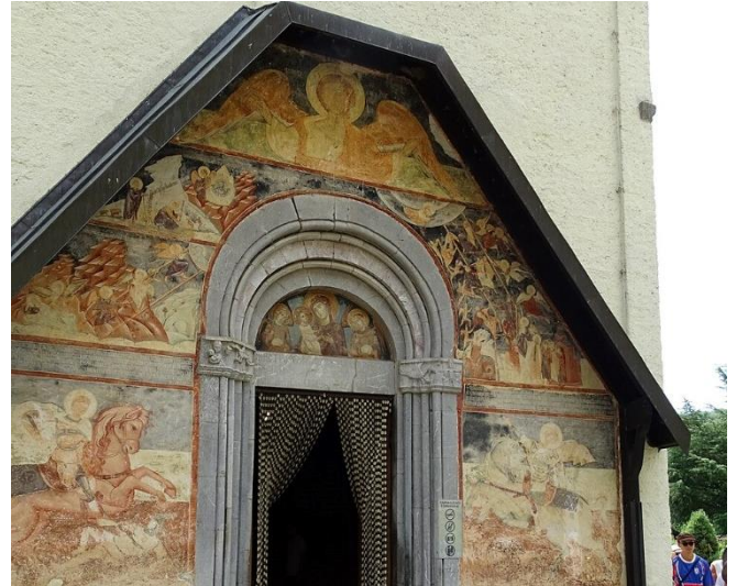
Kloster Morača

Über kurvenreiche Bergstraßen mit Blick auf die Bergwelt Montenegros setzen Sie die Reise fort. Erstes Ziel ist die Morača Schlucht mit dem gleichnamigen orthodoxen Kloster . Es wurde 1252 gegründet und ist von außen eher schlicht, von innen jedoch voller beeindruckender Kunst . Das Kloster ist auf einem Felsplateau natürlichen Ursprungs erbaut worden und ist eines von wenigen mittelalterlichen Bauten Montenegros, die bis heute vollständig erhalten sind.