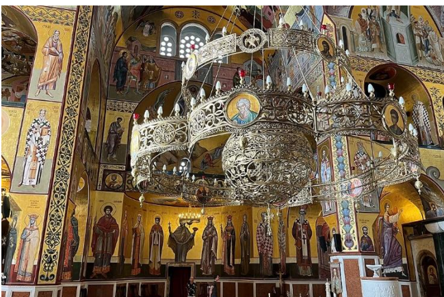
Auferstehungskirche Podgorica

Fahrt zum Hotel und Zimmerbezug für 1 Nacht. Gemeinsames Abendessen im Hotelrestaurant.