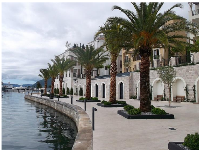
Promenade von Tivat

Auf dem Weg nach Kotor halten Sie in Risan . Der Ort liegt im innersten Winkel der fjordartigen Bucht, unterhalb von beinahe 1000 m hohen Kalksteinwänden des Orjen-Gebirges.