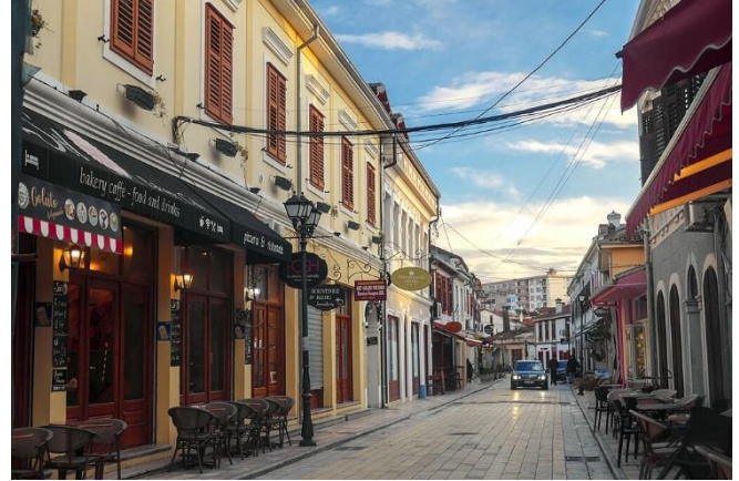
Stadtzentrum von Shkodra

Ankunft im Hotel und Zimmerbezug für die kommenden 2 Übernachtungen. Abendessen im Hotelrestaurant.