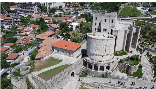
Burg von Kruja

Kruja hat eine aus dem 5. Jh. stammende Burganlage , die sich über der Stadt erhebt. Beim Besuch der Burg bekommen Sie einen Einblick in die mittelalterliche Geschichte des Landes. Kruja war die wichtigste Stadt der Albaner im 15. Jh., die mindestens drei großen Belagerungen durch das Osmanische Reich erfolgreich standgehalten hat. Auf dem Festungsgelände der imposanten Burg liegt das sehenswerte Skanderbeg-Museum , das über die glorreichen Taten des albanischen Nationalhelden berichtet.