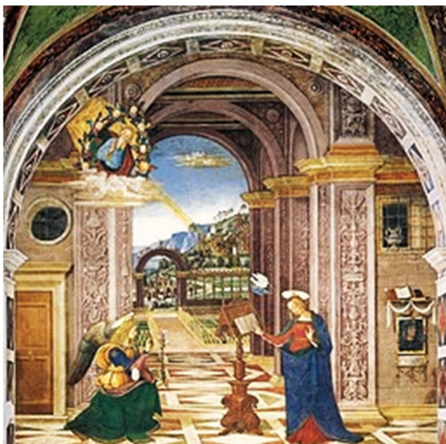
Fresko in der Kirche Santa Maria Maggiore