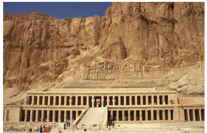
Tempel der Hatshepsut

Einen Eindruck vom Selbstverständnis der Herrschenden bieten auch die zahlreichen Tempelanlagen. Besonders imposant ist der Terrassen-Tempel der Hatshepsut , der sich harmonisch in die natürliche Felskulisse einfügt.