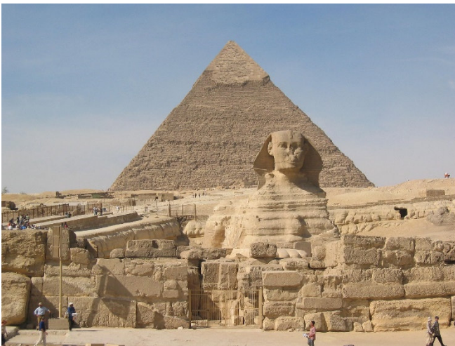
Sphinx und Cheops-Pyramide

Der heutige Tag führt Sie zu den nahe gelegenen Kultstätten des „Alten Reiches“. Vor 3500 bis 5000 Jahren, herrschten mächtige Pharaonen über das ägyptische Volk. Inmitten der Wüste errichteten sie imposante Bauwerke, Skulpturen und Gräber und schufen damit ein Vermächtnis für die Ewigkeit.