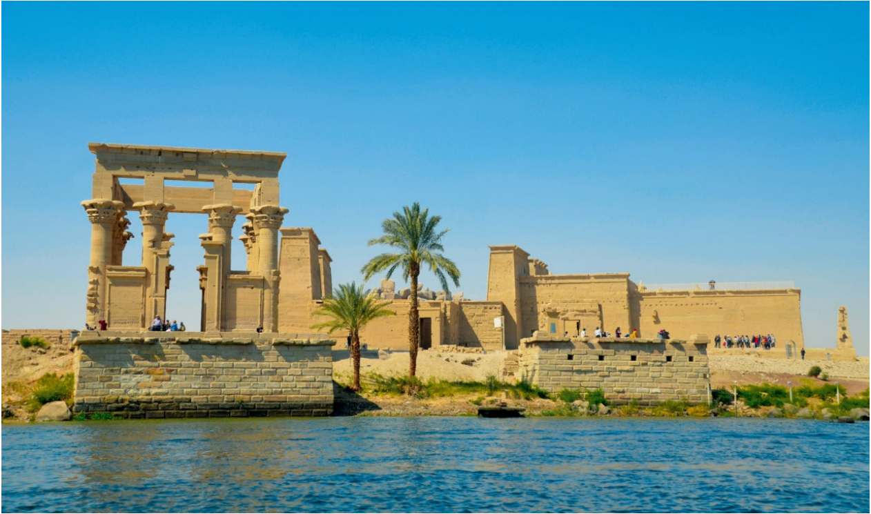
Isis-Tempel auf der Insel Philae

Noch immer prägt der Nil, Afrikas längster Fluss, Lebensspender und Wasserstraße zugleich, das sagenumwobene Land der Pharaonen . Hier entstand in Jahrtausenden eine Kultur, deren Bauwerke und Geheimnisse die Menschen seit jeher faszinieren.