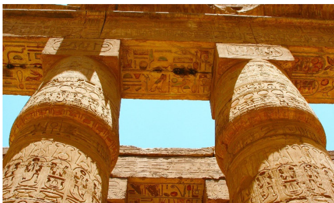
Tempel von Karnak

Transfer zum Flughafen von Luxor und Rückflug über Kairo nach Frankfurt. Individuelle Weiterreise.