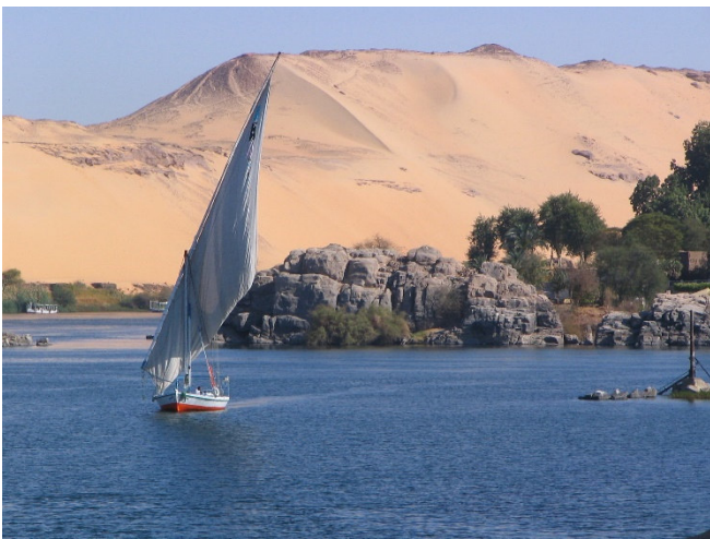
Feluke bei Assuan