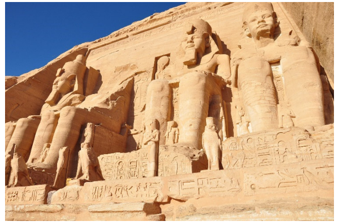
Abu Simbel

Rückkehr zu Ihrem Schiff und gemeinsames Abendessen an Bord.