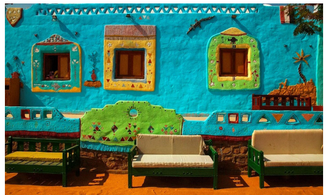
Nubisches Haus

Bei einem gemeinsamen Abendessen an Bord klingt der Tag aus.