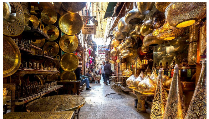
Khan el-Khalili-Basar

Anschließend bummeln Sie durch den farbenfrohen Khan el-Khalili-Basar . Der traditionelle Handelsmarkt wurde bereits im 14. Jh. gegründet und bietet eine Fülle verschiedenster Waren. Zahlreiche kleine Cafés laden zu einer Pause ein.