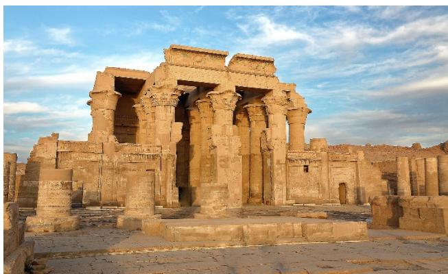
Kom Ombo

Nach dem Mittagessen nimmt Ihr Schiff Kurs stromabwärts und erreicht am späten Nachmittag Kom Ombo. Ein Spaziergang führt zu einem Doppelheiligtum, das in ptolemäischer Zeit dem krokodilgestaltigen Gott Sobek und dem Falkengott Horus geweiht war.