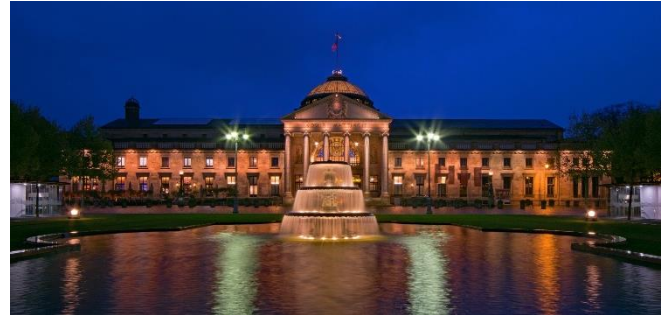
Kurhaus Wiesbaden