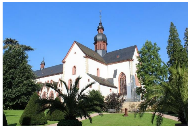
Kloster Eberbach

Am Nachmittag besuchen Sie Kloster Eberbach. Die ehemalige Zisterzienserabtei wurde im Jahr 1136 von Bernhard von Clairvaux gegründet und diente als Kulisse für die Verfilmung des Romans „ Der Name der Rose “ mit Sean Connery.