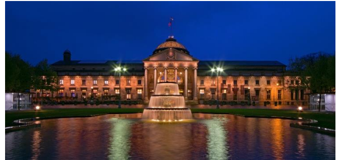
Kurhaus Wiesbaden

Am Nachmittag treffen Sie sich mit Ihrer örtlichen Reiseleitung in der Hotellobby zu einem gemeinsamen Stadtrundgang durch Hessens Landeshauptstadt. Dabei sehen Sie unter anderem die neugotische Marktkirche , ein imposanter Backsteinbau aus der Mitte des 19. Jh.s von Carl Boos. Am Bowling Green , einer großen Grünanlage mit zwei prächtigen Kaskadenbrunnen, liegt das Hessische Staatstheater als Mittelpunkt der Theaterkolonnaden. Ihm gegenüber auf der anderen Seite des Bowling Green liegen die