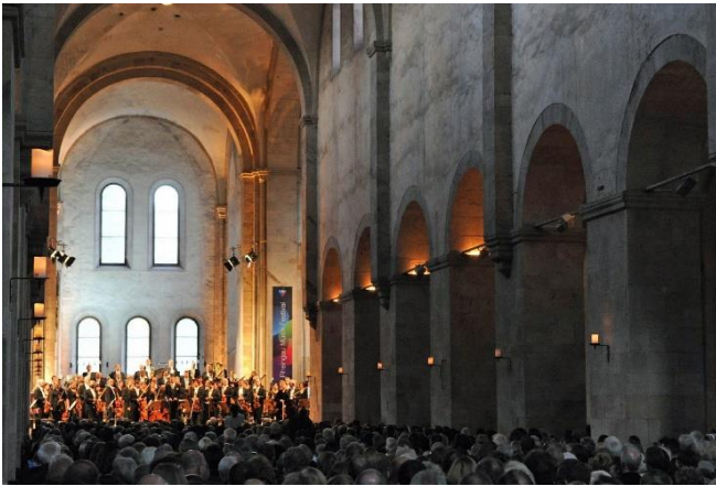
Basilika Kloster Eberbach

Nach dem Rundgang erwartet Sie die Klosterküche in dem stilvoll ausgebauten „Heuboden“ zu einem schmackhaften gemeinsamen Abendessen.