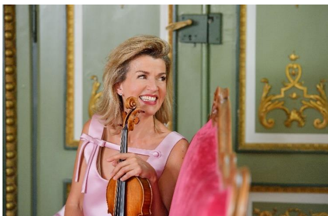
Anne-Sophie Mutter © The Japan Art Association The Sankei Shimbun 5

Der Nachmittag steht Ihnen ebenfalls zur freien Verfügung . Machen Sie zum Beispiel einen Einkaufsbummel über die Langgasse oder im LuisenForum, oder besuchen Sie eines der zahlreichen Museen, wie zum Beispiel das Museum Wiesbaden, eines der 5 hessischen Landesmuseen.