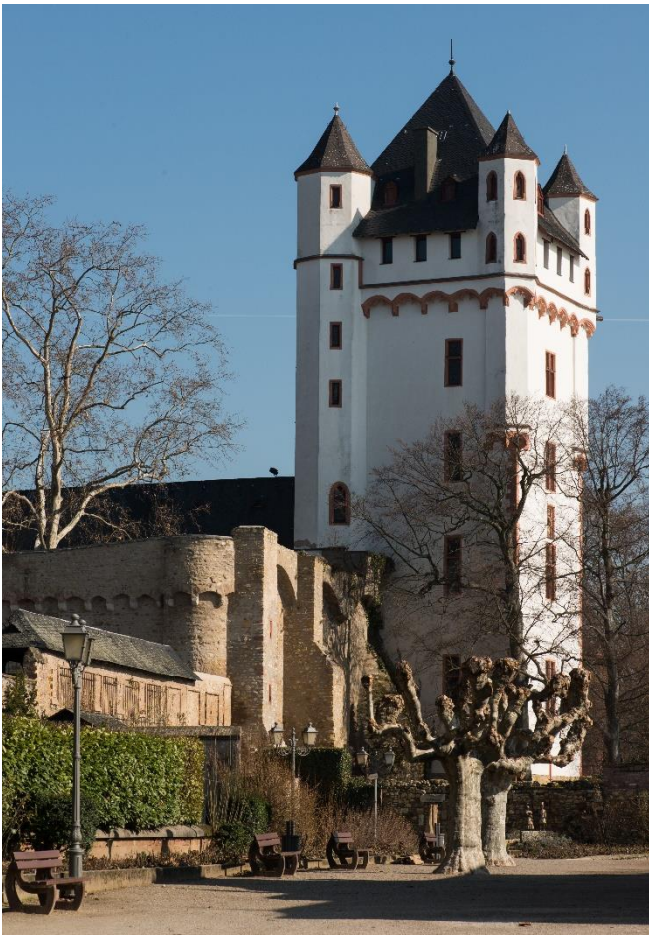
Kurfürstliche Burg in Eltville

Mit dem Gustav Mahler Jugendorchester unter der Leitung von Ingo Metzmaker wird der Abend zu einem unvergesslichen Klangerlebnis. Die Leidenschaft der jugendlichen Musiker und das heutige klangvolle Programm bilden einen würdigen Abschluss des Musik-Festivals.