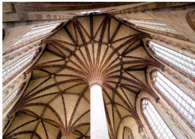
Les Jacobins

Nur wenige Schritte entfernt besuchen Sie sich das Mutterkloster der Dominikaner, das Couvent des Jacobins . Der im Jahr 1215 hier gegründete Orden spielte eine wichtige, aber oft auch blutige Rolle bei der Inquisition. Im Kontrast zu der schroffen Außenansicht steht der Innenraum mit seinen kunstvollen Palmenfeilern , auf denen das Gewölbe aus farbigen Backsteinen ruht.