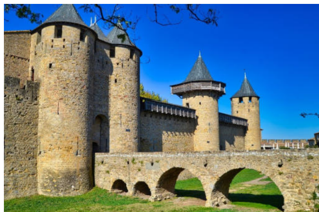
Festungsmauern von Carcassonne

Am Vormittag besuchen Sie die berühmte Cité von Carcassonne, die im 13. Jh. eine bedeutende Rolle im Krieg gegen die Katharer spielte. Die Silhouette der mittelalterlichen Festungsstadt ist eines der bekanntesten Wahrzeichen Frankreichs und gehört seit 1997 zum UNESCO-Weltkulturerbe . Die Altstadt wurde von Eugène Viollet-le-Duc im 19. Jh. eindrucksvoll restauriert und ist von 52 Türmen, 2 Ringmauern sowie einer 3 km langen Stadtmauer umgeben.