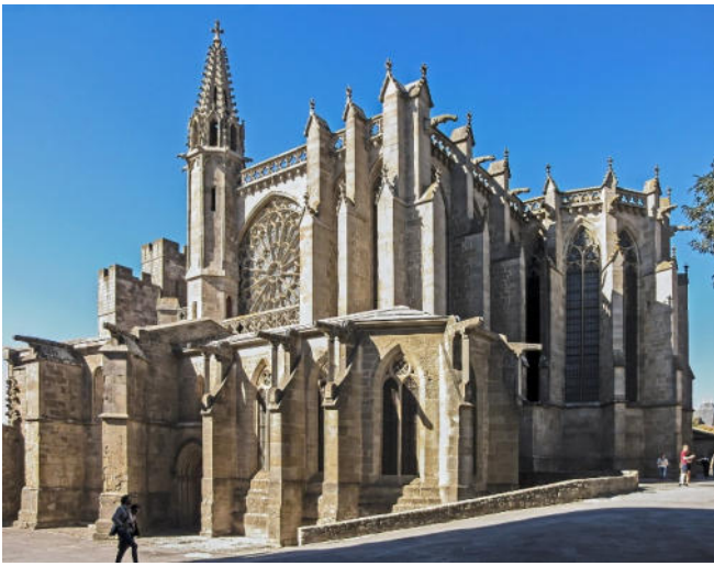
Basilika Saint-Nazaire

Bei einem ausführlichen Rundgang durch die Altstadt und über Teile der Festungsmauern erfahren Sie viele Details aus der Geschichte von Carcassonne. Mit der gotischen Basilika Saint-Nazaire besichtigen Sie einen der bedeutendsten Sakralbauten im Süden Frankreichs. Die ehemalige Kathedrale besteht aus einem romanischen Langhaus und einem gotischen Chor. Die Fenster besitzen teilweise noch die originale Verglasung aus dem 14. und 16. Jh. Das Chorfenster zeigt Szenen aus der Passion Christi.