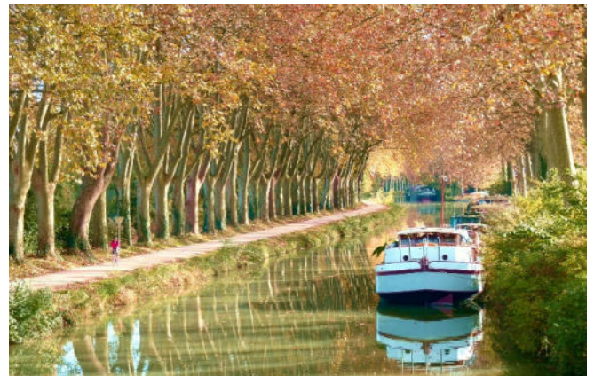
Herbststimmung am Canal du Midi

Heute erwartet Sie ein entspannter Tag. Zunächst fahren Sie zum Canal du Midi, eine Wasserstraße, die den Atlantik über die Garonne mit dem Mittelmeer verbindet. Schon die Römer träumten von diesem Kanal, doch erst Ende des 17. Jh.s konnte das Vorhaben durch Paul Riquet realisiert werden. Der 240 km lange Kanal ist ein Meisterwerk der Ingenieurskunst und wurde 1996 in die Liste des UNESCO-Weltkulturerbes aufgenommen. Um die Höhenunterschiede zu überbrücken wurden zahlreiche Schleusen gebaut. Besonders eindrucksvoll sind die 9 Schleusen von Fonserannes . Genießen Sie den beschaulichen Charme der Landschaft bei einer Bootsfahrt auf dem Canal du Midi.