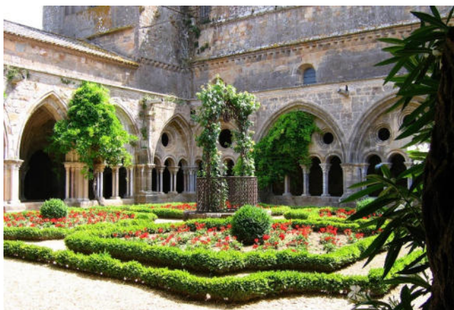
Abtei Fontfroide

Anschließend spazieren Sie über die Häuserbrücke Pont de Marchants und am Kanal de la Robine entlang bis zu den Markthallen von Narbonne . Sie wurden 1901 von Victor Baltard nach dem Pariser Vorbild entworfen. Die neu gestalteten Promenaden am Ufer des Kanals sind von zahlreichen Cafés und Restaurants gesäumt und laden zum Verweilen ein.