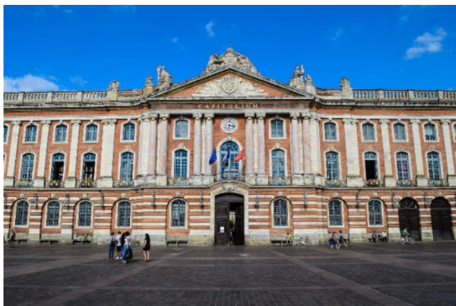
Place du Capitole

Rückfahrt nach Montauban und gemeinsames Abendessen im Hotel.