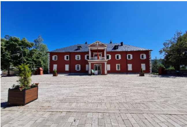
Königlicher Palast in Cetinje

Sie verlassen Podgorica und fahren mit dem Bus in die ehemalige Königsstadt Cetinje . Bis 1918 war sie die Hauptstadt des Landes. Bei einem Rundgang tauchen Sie ein in die Geschichte Montenegros. Sie sehen die alte Botschaft, historische Denkmäler und besichtigen die ehemalige Residenz von König Nikola . Heute beherbergt sie ein Museum, das über die ehemaligen Herrschaftsverhältnisse informiert.