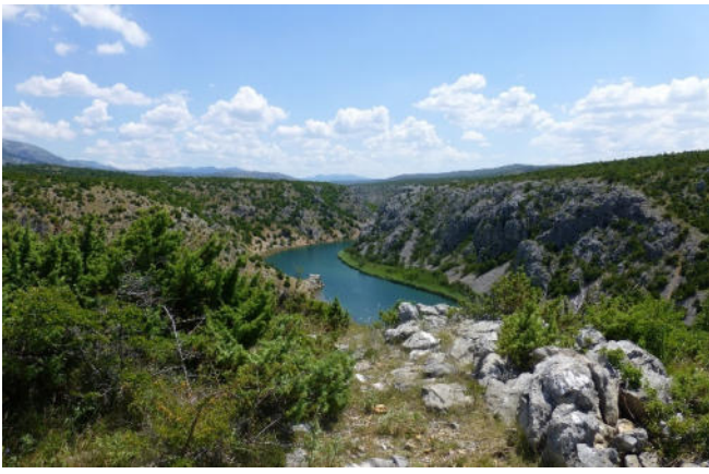
Naturpark Zrmanja