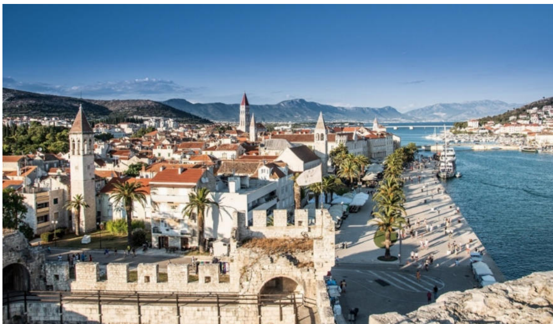
Trogir