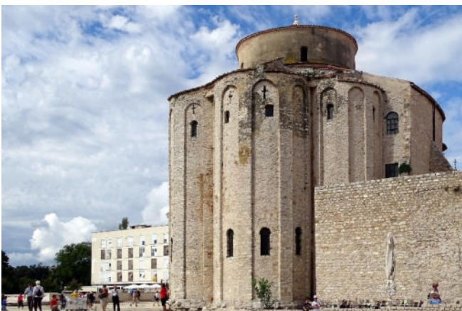
St. Donatius in Zadar

Am Nachmittag Fahrt zum Flughafen und Rückflug am Abend nach Frankfurt.