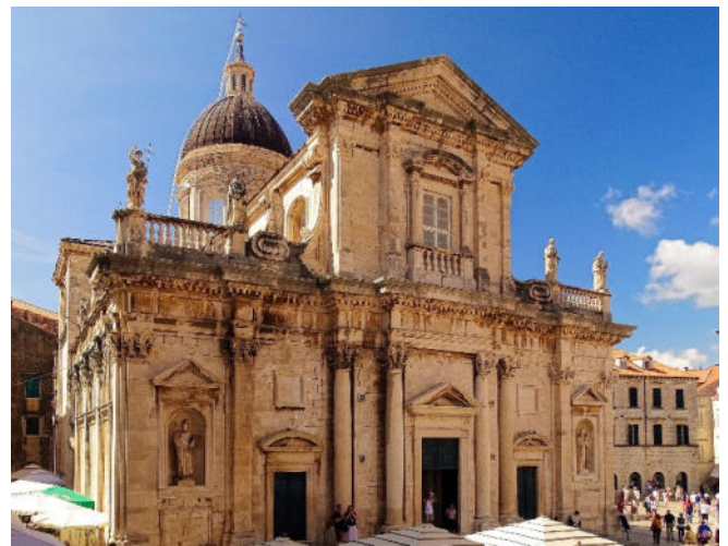
Kathedrale Dubrovnik

Nach dem Zimmerbezug in Ihrem Hotel für 1 Nacht beschließen Sie den Tag mit einem gemeinsamen Abendessen im Hotel.