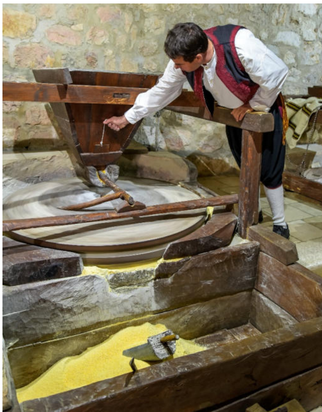
Tradition in Konavle

Gleichzeitig haben Sie auf dem Hof die Möglichkeit zu einer Begegnung mit den dort arbeitenden Landwirten und Arbeitern.