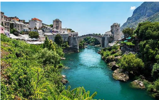
Bogenbrücke Stari Most

Die seinerzeit zerstörte steinerne Bogenbrücke Stari Most über die Neretva wurde vor rund 20 Jahren rekonstruiert und gehört seit 2005 zum UNESCO-Welterbe .