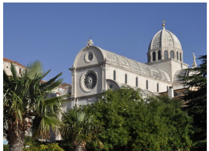
Kathedrale von Šibenik

Sie beginnen die Besichtigung mit einem Bummel über den schönen Platz der Kroatischen Republik . Er ist von Palästen aus der venezianischen Zeit gesäumt, die terrassenartig am Hang angeordnet sind. Bewundern Sie die hübsch skulptierten Lukarnen (Dachaufbauten). Die Oberstadt von Šibenik gehört zum ältesten und malerischsten Teil der Altstadt und lädt zum Verweilen ein. Zahlreiche hübsche Ecken und besonders schöne architektonische Bauten bestimmen das Bild.