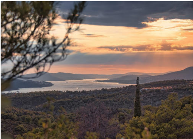
Sonnenuntergang an der kroatischen Riviera

Rückfahrt zu Ihrem Hotel in Makarska und gemeinsames Abendessen.