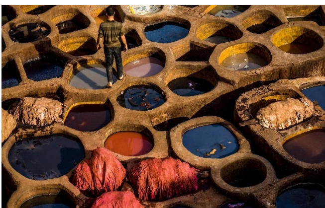
Gerberbecken in Fès

In Fès-el-Bali, der Altstadt aus dem 9. Jh. haben Sie Zeit zu einer individuellen Mittagspause.