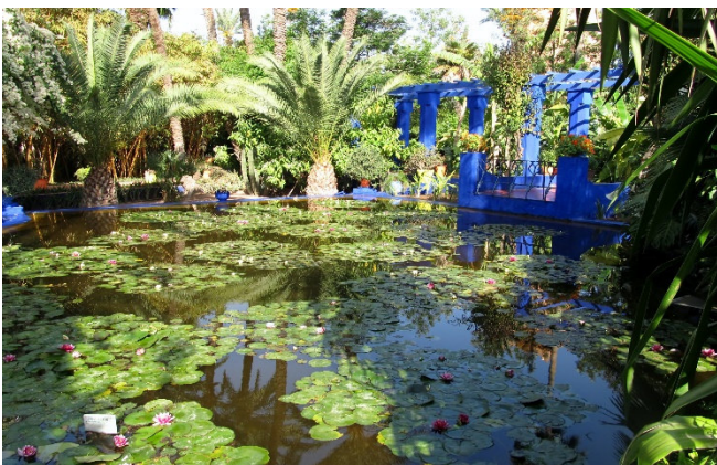
Jardin Majorelle in Marrakesch

Zum Auftakt besuchen Sie den Jardin Majorelle . Inspiriert von den marokkanischen Palästen und Häusern mit ihren erfrischenden Gärten und Wasserspielen, plante der französische Maler Jacques Majorelle sein Haus mit Atelier und Garten für den er Pflanzen aus der ganzen Welt und aus verschiedenen Klimazonen sammelte.