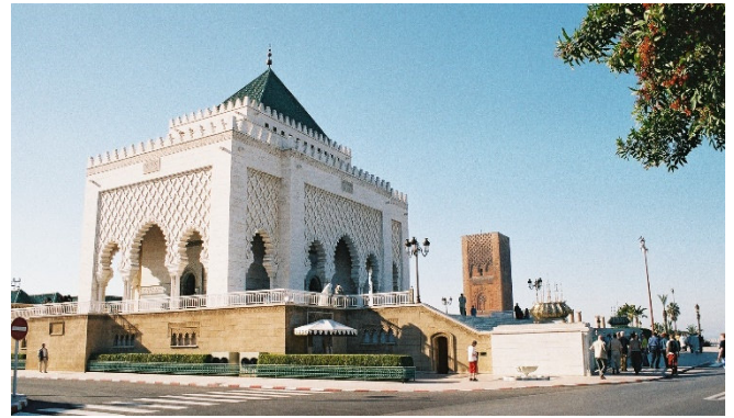
Mausoleum Mohamed V. in Rabat

Weiterfahrt zur Königsstadt Rabat . Wunderschön am Atlantik gelegen, präsentiert sich die heutige marokkanische Hauptstadt überwiegend als moderne Metropole. Bei einer Stadtbesichtigung sehen Sie die Kasbah des Oudaïas aus dem 12. Jh. und in der Medina die malerischen verwinkelten Gassen, in denen die Farben Weiß und Blau dominieren.