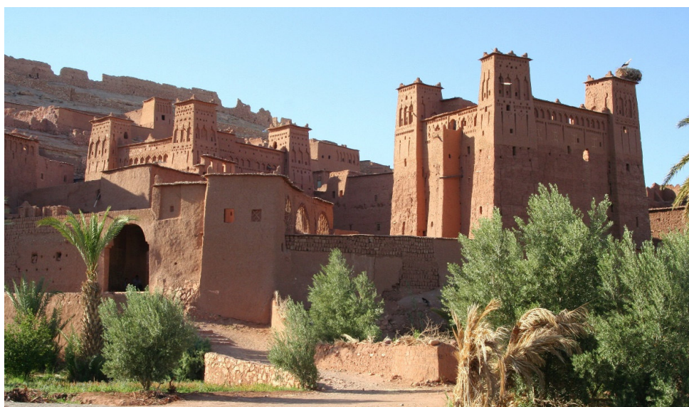
Ait Benhaddou

Auf dieser Reise erwartet Sie die kulturhistorische Schatzkammer im eher unbekanntem Süden von Marokko. Erleben Sie die atemberaubenden Sanddünen des Erg Chebbi , die beeindruckenden Schluchten Todra und Dades sowie die malerischen Oasenstädte entlang der Straße der Kasbahs ; wie Erfoud oder Ouarzazate . Ergänzt wird diese außergewöhnliche Studienreise durch den Besuch der vier prägenden Königsstädte Marrakesch , Rabat , Meknès und Fès , in denen verschiedene Dynastien ein Ensemble geschichtsträchtiger Schmuckstücke erschufen.