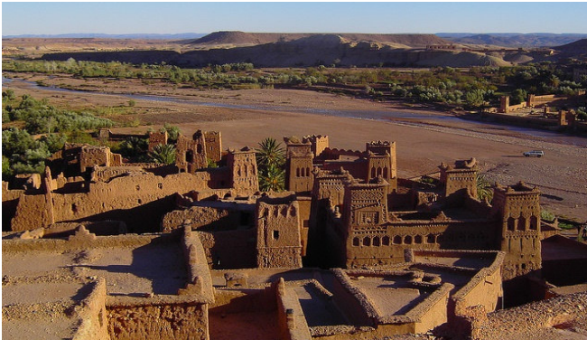
Ait Ben Haddou

Am Morgen steht der Besuch des malerischen Dorfes Ait Ben Haddou auf dem Programm. Es ist ein befestigter Ksar und seit 1987 UNESCO-Weltkulturerbe .