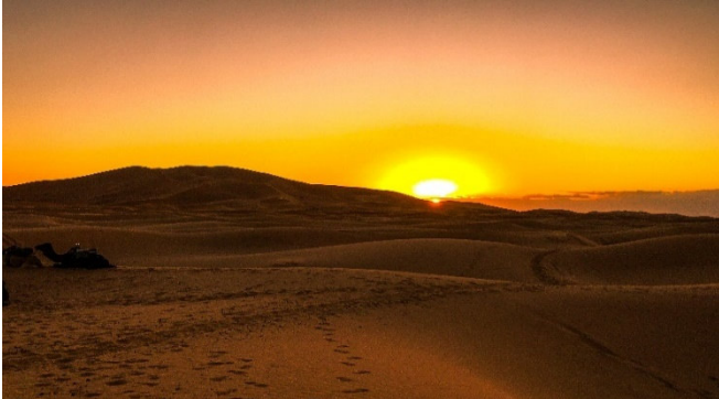
Erg Chebbi

Am frühen Morgen unternehmen Sie eine Jeep-Tour durch die orangefarbenen Dünen des Erg Chebbi, die als die größten und höchsten Sanddünen Marokkos gelten. Pünktlich zu Sonnenaufgang beginnt das faszinierende Farbenspiel der Natur!