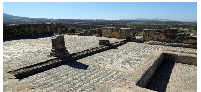
Mosaikfußboden in Volubilis

Heute besichtigen Sie Volubilis . Sie ist die größte und bestehaltene antike Ausgrabungsstätte Marokkos. Umgeben von Olivenhainen bezaubert sie nicht nur mit dem eindrucksvollen Erbe aus römischer Zeit, sondern auch mit einer pittoresken landschaftlichen Lage. Die ausgedehnte Ruinenstadt war der wichtigste Siedlungsposten der Römer in Nordwest-Afrika und hatte zu seiner Blütezeit 10 000 Einwohner! Berühmt sind vor allem die herrlichen Mosaikfußböden in vielen Gebäuden.