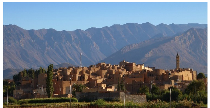
Bergdorf nahe Midelt

Weiterfahrt über Col du Zad nach Midelt. Der Pass über den Mittleren Atlas liegt in einer Höhe von 2178 m und verbindet den Norden mit dem Süden Marokkos. Genießen Sie die Aussicht und immer wieder kommende, atemberaubende Fotomotive.