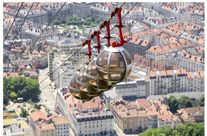
Blick auf Grenoble

Rückfahrt nach Aix-les-Bains und gemeinsames Abendessen im Hotel.