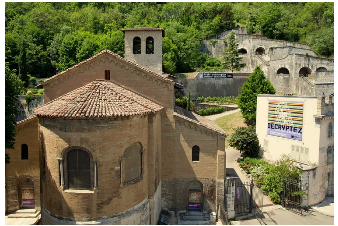
Musée Archéologique CCBYSA3.0 Frédéric Pattou at-wikimedia.commons

Zum Auftakt besuchen Sie mit dem Musée Archéologique Saint-Laurent eines der eindrucksvollsten archäologischen Museen Frankreichs . Untergebracht in einer Kirche, die auf einer Krypta aus der Zeit der Merowinger steht, herrscht hier der Atem des frühen Christentums bis in die Karolingerzeit!