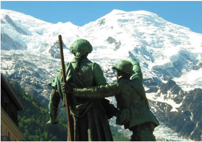
Mont Blanc Panorama CCBY3.0 Jean-Pol GRANDMONT at-wikimedia.commons

In nur 20 Minuten bringt Sie eine moderne Seilbahn hinauf zum Aiguille du Midi . Vom Gipfel des 3842 m hohen Berges bietet sich ein überwältigendes Panorama auf die weißen Bergriesen mit ihren teils nadelförmigen Spitzen.