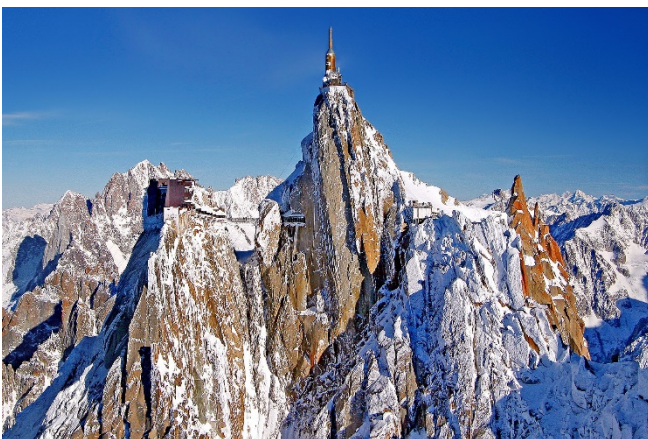
Aiguille du Midi

Rückfahrt durch den Mont-Blanc-Tunnel nach Frankreich und Abendessen im Hotel.