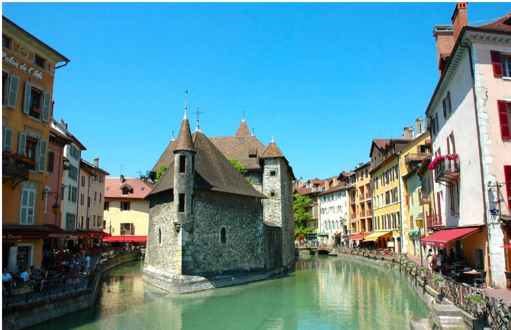
Palais de l'Isle in Annecy

Von der Bresse nördlich von Lyon, über die Gipfel der Viertausender in den französischen Alpen, bis an die Côte d'Azur am Mittelmeer reichten bis ins 18. Jh. die Stammlande des Hauses Savoyen. Bevor die Dynastie ihr Hauptaugenmerk ins Piemont verlegte und letztlich zum italienischen Königshaus aufstieg, war sie ein integraler Bestandteil des Ringens der französischen Könige mit ihren aristokratischen Vasallen. Eingebettet darin war die Dauphiné, die als Kronbesitz eigentlich das Hausgut des französischen Thronfolgers sein sollte.