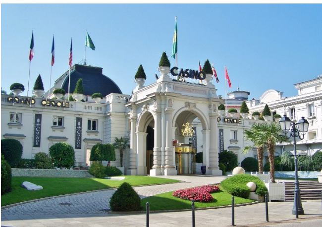
Casino Grand Cercle