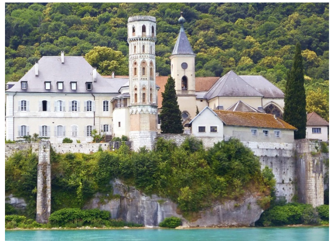
Abtei Hautcombe

Bei einer Bootsfahrt über den See erleben Sie einen Reigen unterschiedlicher Panoramen. Lassen Sie sich von der einmaligen Atmosphäre begeistern!