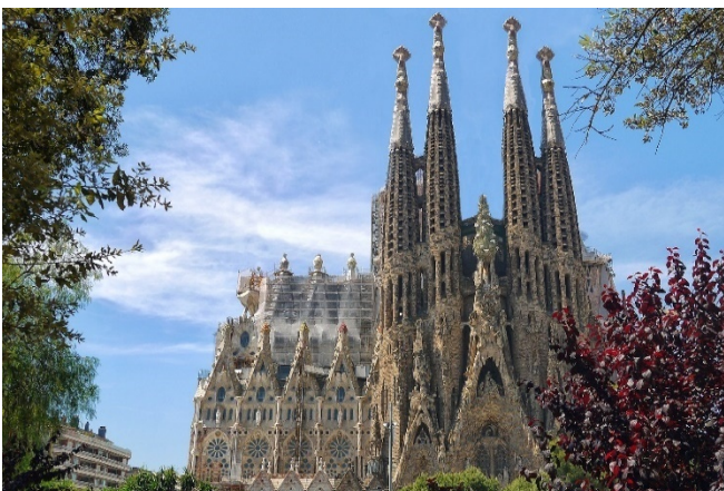
Sagrada Família

Bevor Sie Ihre Reise fortsetzen, ist ein Fotostop bei der Sagrada Família geplant (Außenbesichtigung). Bis heute ist die Fertigstellung des von Antoni Gaudí geplanten Kirchenbaus nicht abgeschlossen.