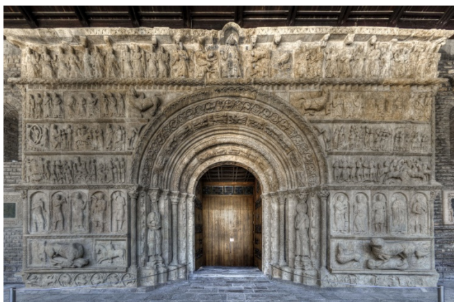
Santa Maria de Ripoll