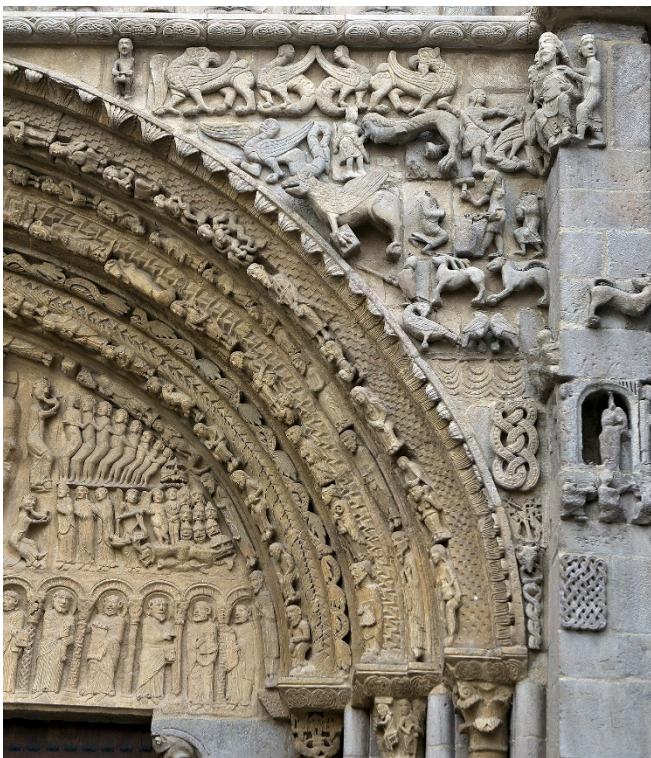
Santa María la Real in Sangüesa

Bei einem Spaziergang erkunden Sie die Altstadt von Sangüesa , einer wichtigen Station auf dem aragonischen Jakobsweg. Bevor die Pilger des Mittelalters den Fluss Aragón überquerten, besuchten sie die romanische Kirche Santa María la Real und bestaunten den ausdrucksstarken Skulpturenschmuck am Südportal. Das bildgewaltige Meisterwerk aus dem 12. Jh. beeindruckt bis heute.