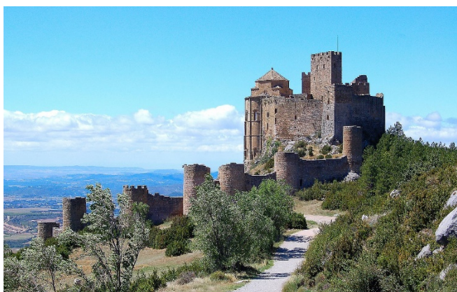
Castillo de Loarre

Mit Huesca erreichen Sie am Abend das Ziel Ihrer heutigen Etappe. Zimmerbezug für 1 Übernachtung und gemeinsames Abendessen im Hotel.