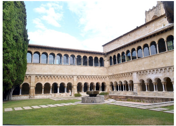
Sant Cugat del Vallès

Weiterfahrt zum Kloster Sant Cugat del Vallès . Auf den Fundamenten eines römischen Kastells und einer spätantiken Kirche entstand eines der bedeutendsten mittelalterlichen Klöster Kataloniens. Aus der Blütezeit der Benediktinerabtei stammen die Klosterkirche und der romanische Kreuzgang .