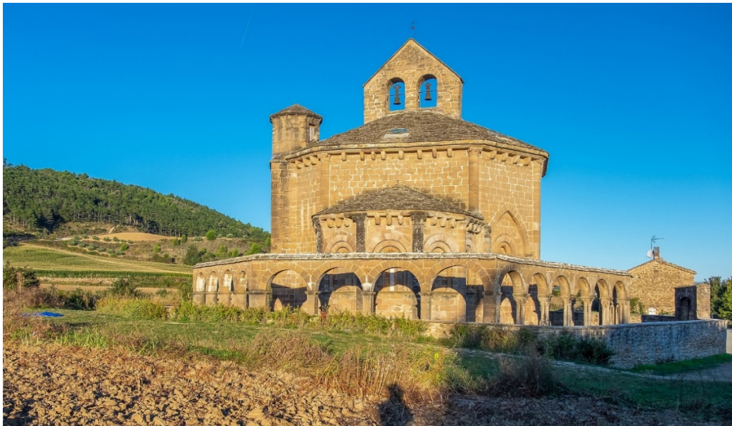
Eunate CC0 pixabay

Weit mehr als in anderen Teilen Spaniens prägt die romanische Architektur die Städte, Klöster und Kirchen in den historischen Landschaften von Katalonien, Aragón und Navarra . Schon im 8. Jh. begann im Norden der iberischen Halbinsel die Reconquista und ebnete den Weg zur Bildung christlicher Grafschaften und Königreiche. In den Vorgebirgslandschaften der Pyrenäen entstanden bedeutende Abteien , die zu viel besuchten Stationen auf dem aragonischen Pilgerweg nach Santiago de Compostela wurden.