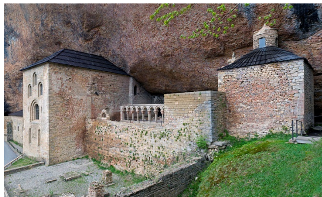
San Juan de la Peña

Nach einer Mittagspause in Santa Cruz de la Seros besichtigen Sie das Königliche Kloster San Juan de la Peña , das versteckt unter einem Felsüberhang in einer engen Schlucht liegt. Die ältesten Teile der zweischiffigen Unterkirche stammen bereits aus dem 10. Jh. Mit dem Ausbau des Klosters wurden die Oberkirche und der Kreuzgang errichtet. Da er vollkommen unter dem Felsen liegt, besitzt er kein Dach. Die Kapitelle mit biblischen Motiven gehören zu den herausragenden Schöpfungen romanischer Kunst . Eine besondere Bedeutung erfuhr das Kloster als Grablege der Könige von Aragón und der Könige von Navarra, die mehr als 500 Jahre lang hier bestattet wurden.