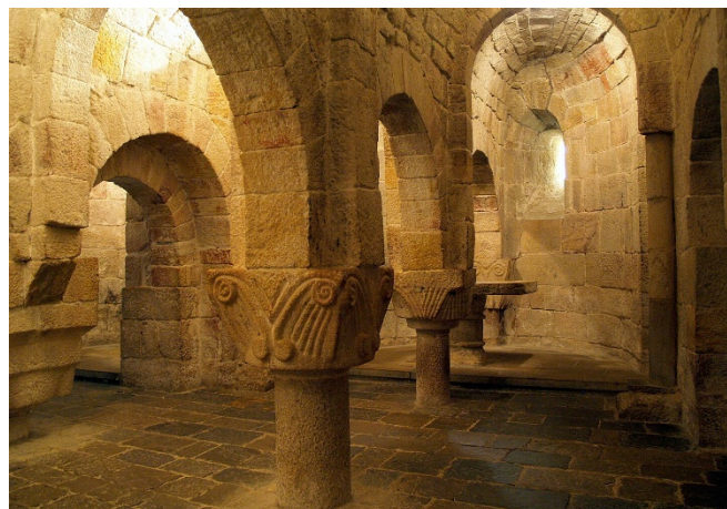
Krypta im Kloster Leyre

Zum Auftakt besichtigen Sie das Kloster San Salvador de Leyre . Zu den ältesten Teilen der Anlage gehören die Krypta aus dem 9. Jh. und die romanische Kirche Santa María, in der heute wieder die sterblichen Überreste der frühen Könige von Navarra ruhen.