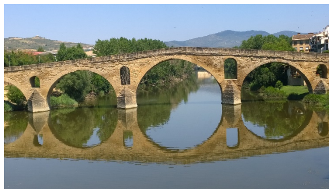
Puente la Reina

Danach fahren Sie auf dem Jakobsweg weiter zur achteckigen Grabeskirche Santa María de Eunate . Die schlichte Kapelle liegt wunderschön inmitten weiter Felder und wird von einem freistehenden Arkadenring geschützt.