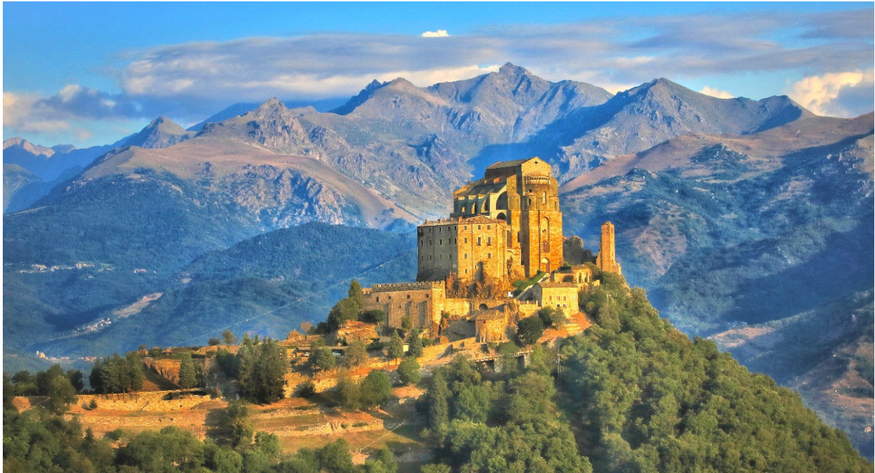
Sacra di San Michele

Eingerahmt von den majestätischen Gipfeln der Westalpen und den Ausläufern des Apennin im Süden befindet sich eine der schönsten und abwechslungsreichsten Kulturlandschaften Italiens! Eindrucksvoll erzählen mittelalterliche Abteien und Kirchen, mächtige Burgen und kostbar ausgestattete Schlösser aus einer reichen Geschichte, die bis in die Antike zurückreicht. Glanzvoller Mittelpunkt der Region ist die elegante Hauptstadt Turin , die prachtvoll gestaltete Residenz der Herzöge und Könige von Savoyen .