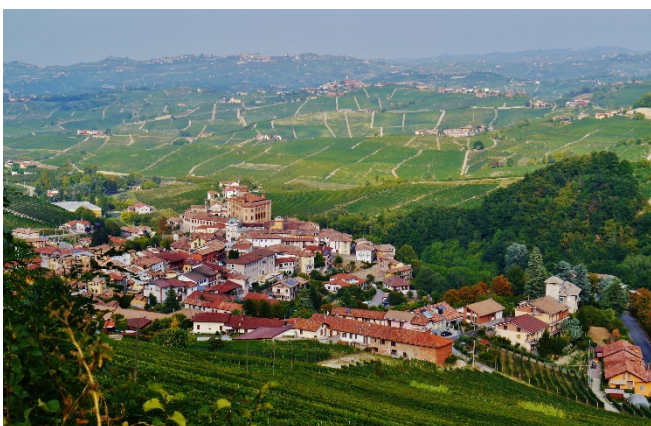
Die Landschaft der Langhe

Am Vormittag besuchen Sie Alba , den weltbekannten Handelsplatz der weißen Trüffel. Vorbei an den markanten Geschlechtertürmen spazieren Sie zum Dom San Lorenzo . Die aus rotem Backstein erbaute Kirche stammt aus dem 15. Jh. und besitzt ein sehenswertes Chorgestühl.