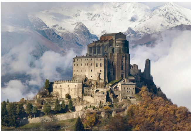
Abbazia Sacra di San Michele

Vom königlichen Schloss geht Ihre Reise weiter zur geistlichen Festung Sacra di San Michele . Die Abtei thront auf einer Höhe von fast 1000 Metern auf dem Monte Pirchiriano vor der atemberaubenden Kulisse der Alpen . Diese einzigartige Lage soll auch Umberto Eco zu seinem Werk „Der Name der Rose“ inspiriert haben. Für 200 Jahre sich selbst überlassen, wurde das Gotteshaus schrittweise zur Ruine, bevor es Mitte des 19. Jh. auf Anregen von König Carlo Alberto „wiederbelebt“ wurde.