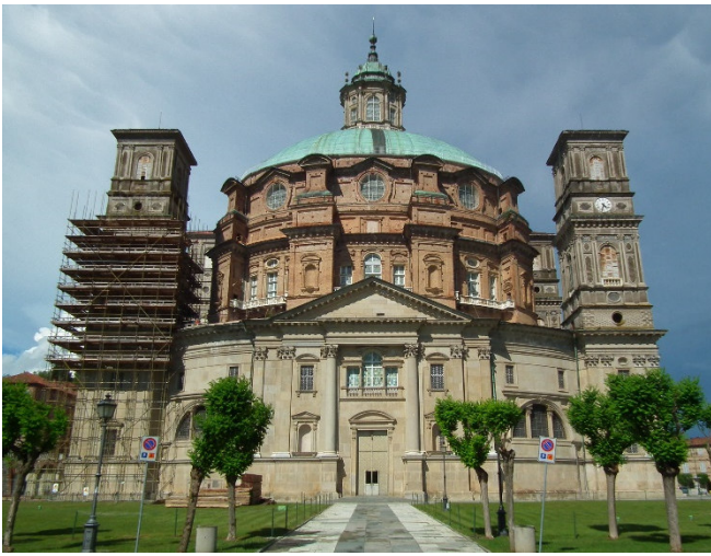
Santuario della Natività di Maria

Am späten Nachmittag bringt Sie eine Fahrt mit herrlichen Landschaftseindrücken zu einem traditionsreichen Weingut inmitten des Produktionsgebiets der Langhe. Nach einer Besichtigung der Weinberge und des Weinkellers kommen Sie bei einer Verkostung in den besonderen Genuss der Langhe-Weine .