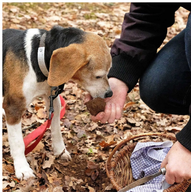
Trüffelhund bei der Arbeit