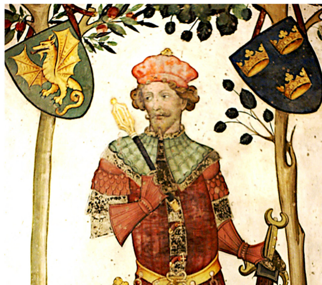
Fresken im Castello della Manta CC0 at-wikimedia.commons

Die Mittagszeit verbringen Sie in der wunderschön am Fuße des Monviso gelegenen Stadt Saluzzo . Der von den kunstsinnigen Markgrafen zu einer prächtigen Residenz ausgebaut Ort hat sich sein historisches Stadtbild fast vollständig erhalten. Bei einem Rundgang durch die idyllischen Gassen der Oberstadt sehen Sie die Kirche San Giovanni und das Rathaus (Außenbesichtigungen). Genießen Sie während einer individuellen Mittagspause den Charme dieses pittoresken Ortes!