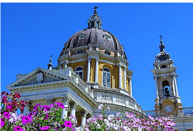
Basilica di Superga

Den heutigen Tag widmen Sie ganz Turin, der piemontesischen Hauptstadt mit herrschaftlichen Palästen, prachtvollen Gebäuden und arkadengesäumten Plätzen. Zum Auftakt fahren Sie zur Basilica di Superga , die weithin sichtbar oberhalb der Stadt thront. Das Meisterwerk aus dem frühen 18. Jh. diente lange Zeit als die Grablege des Hauses Savoyen. Von der Terrasse bietet sich der wohl schönste Panoramablick auf Turin vor der Gebirgskulisse der schneebedeckten Alpen.