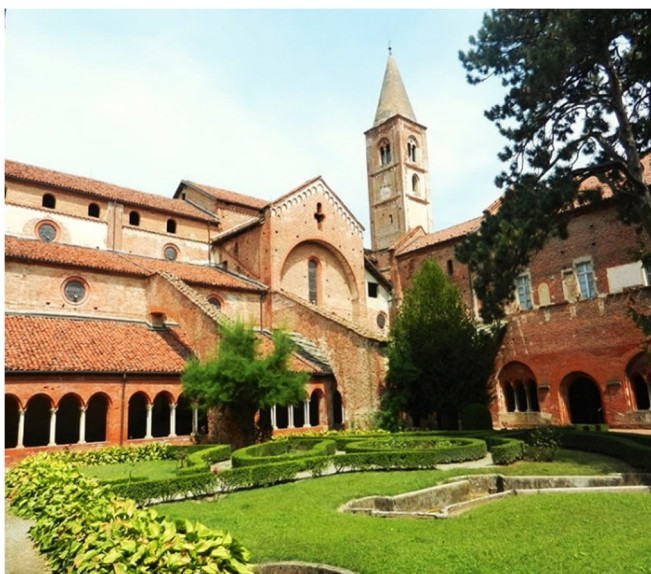
Abtei Staffarda

Am Vormittag besichtigen Sie die ehemalige Zisterzienserabtei Staffarda , die bereits im Jahr 1135 gegründet wurde. Der erste Mönch der Bruderschaft war ein Schüler des hl. Bernhard von Clairvaux. Der mittelalterliche Komplex im romanisch-gotischen Stil zeugt eindrucksvoll von der wirtschaftlichen Bedeutung und Macht der Klostersgemeinschaft im 12. und 13. Jh. Bei Ihrem Besuch sehen Sie die Klosterkirche mit ihren mehrfarbigen Ziegelsteinen , den Kapitelsaal sowie den Studier- und Arbeitssaal der Mönche. Besonders stimmungsvoll ist der Kreuzgang der Abtei, eine herrliche Oase der Ruhe und Besinnung.