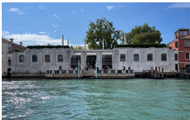
Peggy Guggenheim Collection

Bei einem Stadtspaziergang am Nachmittag besuchen Sie die Peggy Guggenheim Collection . Die Sammlung der exzentrischen Amerikanerin befindet sich im Palazzo Venier dei Leoni und ist eine der bedeutenden Kollektionen moderner Kunst. Zu sehen sind u.a. Werke von Max Ernst, Piet Mondrian, Pablo Picasso, Hans Arp und Ernst Pollock. Von der Terrasse des Museums bietet sich ein herrlicher Blick auf den Canal Grande!