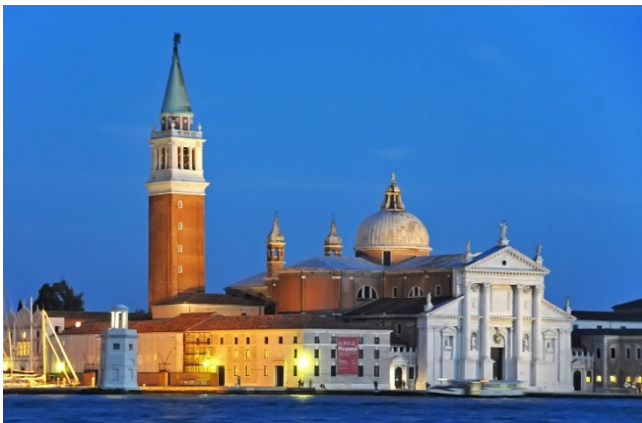
San Giorgio Maggiore

Ein Aufzug bringt Sie auf den Campanile von San Giorgio Maggiore, wo Sie ein traumhafter Blick über die Lagune von Venedig erwartet.