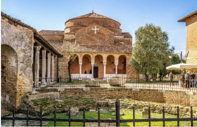
Santa Fosca auf Torcello

Ruinen und die ehrwürdigen alten Mauern der Kirchen Santa Maria Assunta und Santa Fosca tauchen mystisch anmutend aus dem Gras auf. Die Basilika Assunta ist ein Bau von hohem Symbolwert, steht sie doch historisch und stilistisch gleichsam am Schnittpunkt der romanischen und der byzantinischen Kunst. Bedeutend sind die großartigen Mosaiken , darunter eine Darstellung des Jüngsten Gerichts.