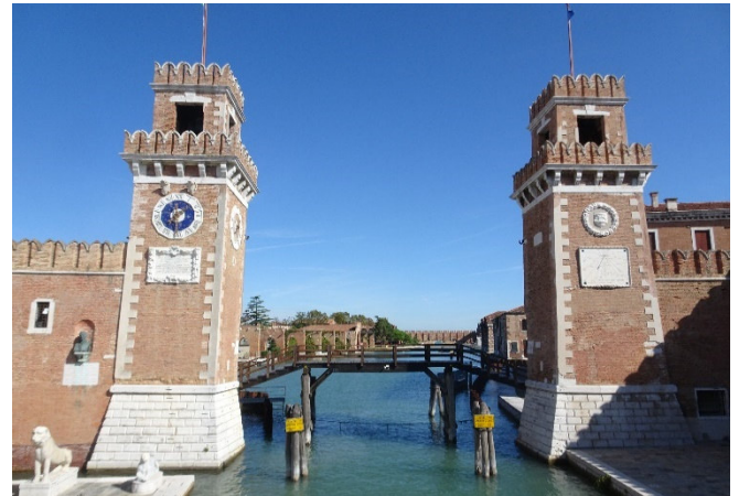
Arsenale 2019

Anschließend steht Ihnen Zeit zur freien Verfügung. Erkunden Sie in eigenem Tempo La Serenissima! Es besteht auch die Möglichkeit mit Ihrem Reiseleiter die beeindruckende Gallerie dell'Accademia mit ihren „Alten Meistern“ zu erleben (fakultativ). Sie besitzt die weltweit größte Sammlung venezianischer Kunst vom 14. bis zum frühen 19. Jahrhundert und umfasst u. a. einzigartige Werke von Tizian, Veronese, Carpaccio, Giorgione und Tintoretto.