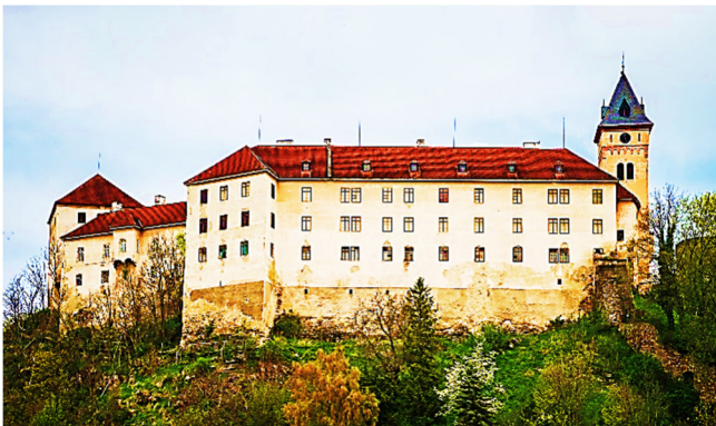
Schloss Vimperk

Am Nachmittag besichtigen Sie Vimperk (Winterberg), malerisch im Böhmerwald gelegen. Aus einer kleinen Ansiedlung heraus entwickelte sich im Laufe der Jahrhunderte die heutige Stadt, die ihren Aufschwung der Glas- und Druckindustrie zu verdanken hatte.