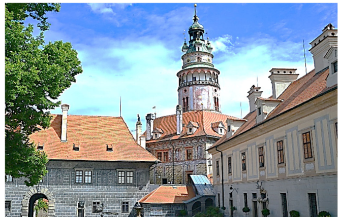
Český Krumlov

Führung in der St.-Veit-Kirche , ein gotischer, dreischiffiger Kirchenbau aus den Jahren 1407–1439. Die Kirche wurde auf den Fundamenten eines älteren Baus aus dem Jahr 1309 errichtet.