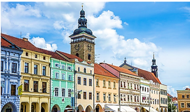
Altstadt von Budweis

Fahrt nach Budweis zum Check-in und Zimmerbezug in Ihrem, im Zentrum der Stadt gelegenen Hotel, für die folgenden 6 Übernachtungen.