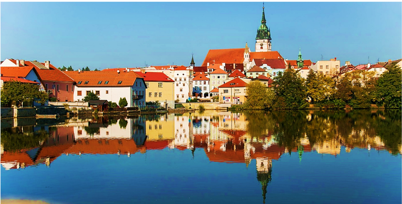
Jindřichův Hradec

Diese außergewöhnliche Studienreise unter Leitung der Kölner Dombaumeisterin i. R. führt Sie nach Südböhmen , in eine Landschaft reich an dramatischer Geschichte; mit kultureller und künstlerischer Tradition, die Hunderte von Städten, Burgen, Schlössern und Sakralbauten prägte. Ihr Standort ist České Budějovice – Budweis – das Herz Südböhmens.