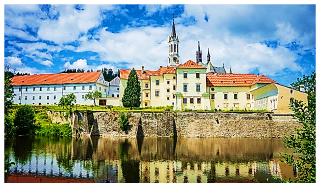
Zisterzienserkloster Vyšší Brod

Den Ufern der oberen Moldau folgend, kommen Sie am Nachmittag zum Zisterzienserkloster und geistigen Zentrum Südböhmens: Vyšší Brod (Hohenfurt). Einst vom böhmischen Ständepolitiker Peter Wok von Rosenberg im Jahr 1259 gegründet, lebt hier noch heute eine kleine Mönchsgemeinschaft.