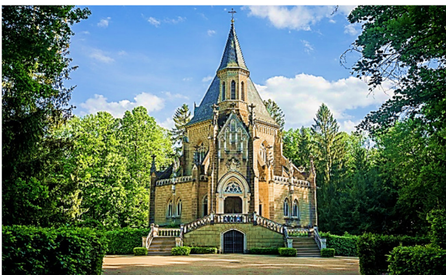
Gruft des Hauses Schwarzenberg in Třeboň

Der zugehörige Park im englischen Stil bildet eine grüne Oase inmitten der Stadt. Ein Spaziergang vorbei an den in dieser Gegend typischen Fischteichen bringt Sie zur majestätischen Gruft im neogotischen Stil der Adelsfamilie Schwarzenberg , Grablage der Schwarzenberger seit Mitte des 19. Jh.s, in der 26 Säрге aufbewahrt werden.