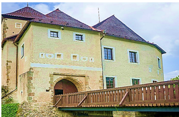
Burg Nove Hradý

Abfahrt in Richtung Waldviertel , dessen Name vom Waldreichtum der Region herrührt. Die einzigartige natürliche Vielfalt, das gesunde Klima und eine intakte Fauna prägen diesen Landstrich, der sich im Norden Österreichs bis zur tschechischen Grenze erstreckt.