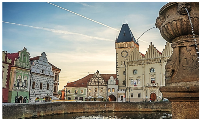
Marktplatz in Tábor

Im kleinen Kurort Bechyně (Bechin) unternehmen Sie einen Rundgang durch die Stadt, die inmitten einer malerischen Landschaft über dem Fluss Lužnice (Lainsitz) erbaut wurde.