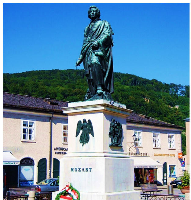
Mozartdenkmal in Salzburg

Zum Auftakt des Tages widmen Sie sich dem Leben und Wirken von Wolfgang Amadeus Mozart, dem berühmtesten Sohn der Stadt. Gemeinsam mit dem Stadtführer besuchen Sie Mozarts Wohnhaus am heutigen Makartplatz. Die historischen Wohnräume der Familie, eine großzügige Achtkammerwohnung, lagen im ersten Stock des „Tanzmeisterhauses“ und beherbergen heute ein kleines Museum mit vielen interessanten Erinnerungsstücken. Sie sehen den originalen Hammerflügel sowie das bekannte Familienbild „ Tanzmeistersaal “, das zu den kostbarsten Exponaten zählt.