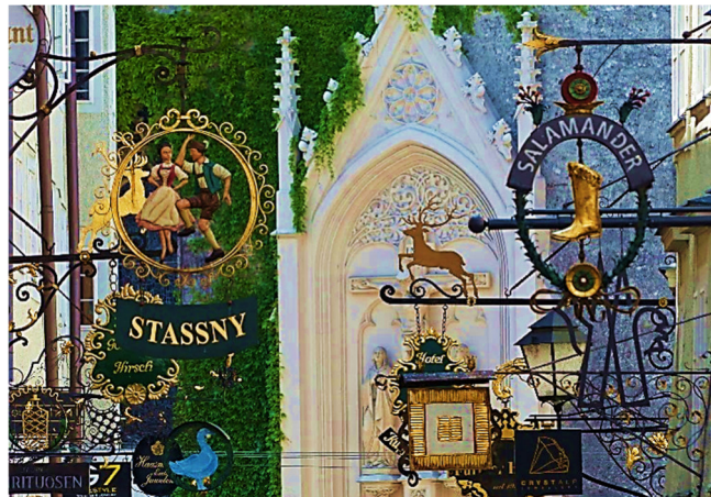
Getreidegasse in Salzburg

Der Rest des Tages steht Ihnen für eigene Unternehmungen zur freien Verfügung. Mit der „Salzburg-Card“ können Sie aus vielen verschiedenen Angeboten auswählen. Vielleicht spazieren Sie auch einfach nur die geschichtsträchtige Getreidegasse entlang: Im Herzen der Altstadt gelegen, befindet sich hier auch das Geburtshaus Mozarts . Historische Gasthöfe laden zum Verweilen ein.