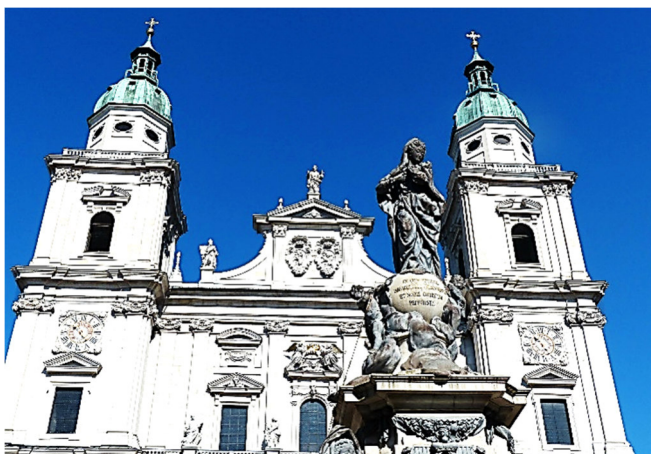
Dom zu Salzburg

Den Mittelpunkt der Altstadt bildet der weite Residenzplatz mit dem barocken Dom, ein beeindruckendes Bauensemble, das zum UNESCO-Weltkulturerbe zählt. Der monumentale Sakralbau ist die erste frühbarocke Kirche nördlich der Alpen und stammt aus der ersten Hälfte des 17. Jh.s. Die elegante Fassade am Domplatz dient jedes Jahr als prachtvolle Kulisse für die viel beachteten Aufführungen des „Jedermann“.