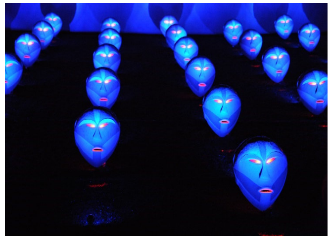
Luci d'Artista

Der Abend steht Ihnen zur freien Verfügung. Genießen Sie z. B. in einem der vielen Restaurants rund um den Piazza Castello die hervorragende piemontesische Küche (fakultativ)!