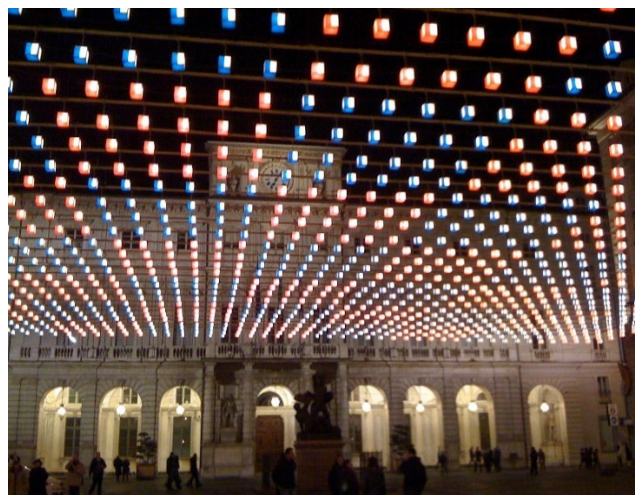
Luci d'Artista

meisters, Mathematikers und Theatinermönchs Guarino Guarini. Das phantastische Formenspiel im Inneren erscheint zunächst paradox, folgt jedoch bei genauerem Hinsehen strengsten mathematischen Gesetzen. In einem Nebenraum wird ein Faksimile des seit 1353 nachweisbaren, viel diskutierten Turiner Grabtuchs gezeigt.