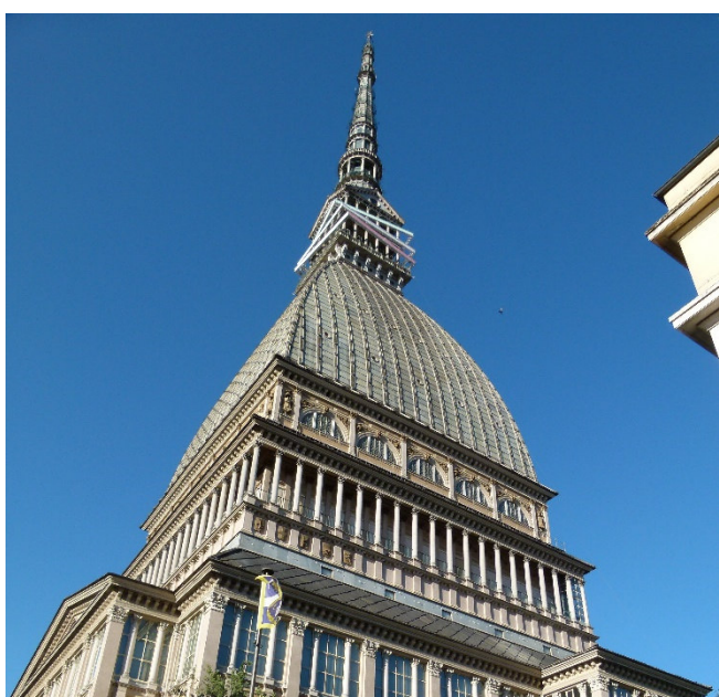
Mole Anotonelliana

Mit Ihrem Reisebus fahren Sie am Vormittag zum Wahrzeichen Turins: der Mole Antonelliana , einem 167 m hohen Turm. Einst als Synagoge geplant, beheimatet das pavillonartige Gebäude heute das Film-