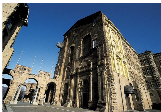
Castello di Rivoli