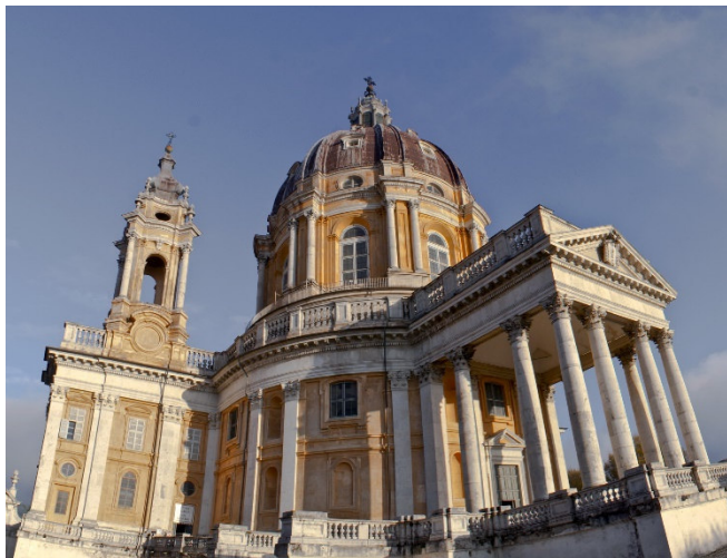
Basilica di Superga

Dann heißt es Abschied nehmen von Turin. Fahrt zum Flughafen und Rückflug nach Frankfurt.