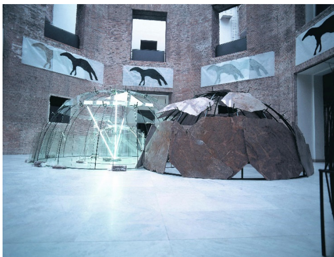
Mario Merz

Zurück im Zentrum von Turin besuchen Sie eines der wunderschönen historischen Cafés . Hier erwartet Sie eine Merenda Reale , eine wahrlich „königliche Zwischenmahlzeit“. Das Ritual, bei dem in stilvollem Ambiente heiße Schokolade zusammen mit unwiderstehlichem Gebäck gereicht wird, orientiert sich an der Tradition des Savoyer Hofes ab dem 18. Jh.