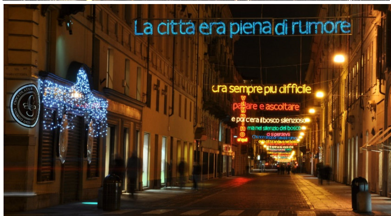
Luci d'Artista, Turin, Luci d'Artista 1