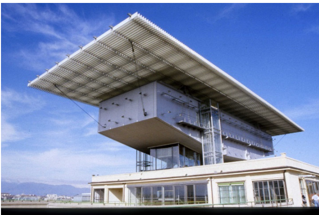
Turin Pinacoteca Agnelli

Der Stararchitekt Renzo Piano konzipierte den Umbau zum modernen „Erlebniszentrum Lingotto“. Auf dem Dach des Gebäudes, innerhalb der ehemaligen FIAT-Teststrecke , entstand ein kubusförmiges Gebäude für die faszinierende Pinacoteca Giovanni e Marella Agnelli . Bei einer Führung durch die kleine, aber feine Kunstaussstellung sehen Sie bedeutende Werke aus dem 18. bis 20. Jh., u. a. von Matisse, Balla, Picasso, Severini, Modigliani und Tiepolo.