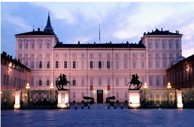
Palazzo Reale

Es lohnt im Anschluss ein Spaziergang durch den Feinkost-Tempel Eataly ! 2007 wurde hier auf 11 000 qm ein kulinarisches Schlaraffenland voller Minirestaurants und Essensstände eröffnet. Es gibt feinste Genüsse – zu kaufen und auch gleich zu verzehren. Die Lebensmittel kommen von ausgewählten Lieferanten aus der Region.