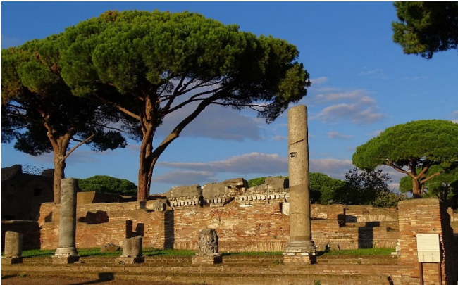
Ostia Antica

Vom Flughafen fahren Sie direkt zu dem nahen und faszinierenden Ausgrabungsgelände Ostia Antica , die Hafenstadt des antiken Roms. Bewundern Sie liebevoll restaurierte Thermen sowie Heiligtümer und Wohnviertel, die antiken Lebensstil atmosphärisch echt ins 20. Jh. übermitteln.