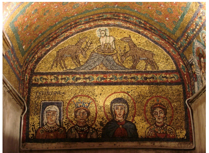
Santa Prassede

Nach dem Frühstück haben Sie Gelegenheit zu einem Besuch des Gottesdienstes in der Kirche Santa Maria Maggiore , der größten und ehrwürdigsten unter den rund 80 Marienkirchen der Stadt. Nach der Heiligen Messe besichtigen Sie die beeindruckende Pilgerkirche und Patriarchalbasilika. Mosaiken aus dem 5. Jh. zeigen einen einmaligen Zyklus von