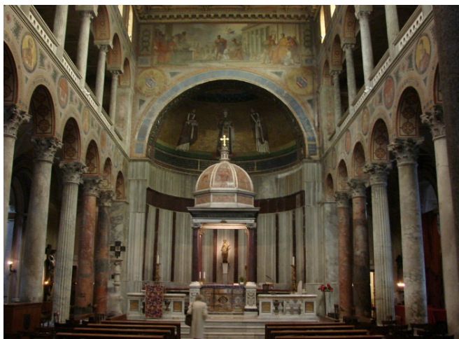
Sant'Agnese fuori le Mura

Mit dem Bus geht es nun zur Kirche Sant'Agnese fuori le Mura , die im 4. Jh. von Constantia, der Tochter Kaiser Konstantins gestiftet wurde. Bemerkenswert ist ihr hohes und schmales Mittelschiff. Die Wandverkleidungen aus Marmor und Porphyrt sind die einzig erhaltenen ihrer Art aus der Zeit des frühen Christentums. Ein Blickfang im Innern ist die üppig dekorierte Holzdecke.