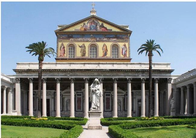
San Paolo fuori le Mura

Im Anschluss fahren Sie zu Sankt Paul vor den Mauern , Grabeskirche des Apostels Paulus und eine der vier Patriarchalbasiliken. Kaiser Konstantin ließ hier eine Gedenkkapelle für Paulus errichten. 386–410 entstand dann die monumentale fünfschiffige Säul basilika, die bis zum Bau von St. Peter im 16. Jh. das größte Gotteshaus der Christenheit war. Sie wurde nach einem Brand im 19. Jh. originalgetreu wiedererrichtet. Über dem Hochaltar erhebt sich ein gotisches Ziborium von Arnolfo di Cambio. Beeindruckend ist auch der Kreuzgang , ein Meisterwerk römischer Marmorkunst.