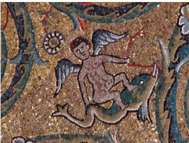
San Clemente

Freuen Sie sich heute auf die beeindruckende Kirche San Clemente , die über einem Mithras-Heiligtum neben noch sichtbaren altrömischen Wohnhäusern entstand. Die Unterkirche gilt als eine Schatzkammer der romanischen Wandmalerei . In der Oberkirche sehen Sie wunderschöne Renaissancefresken in der kleinen Katharinenkapelle.