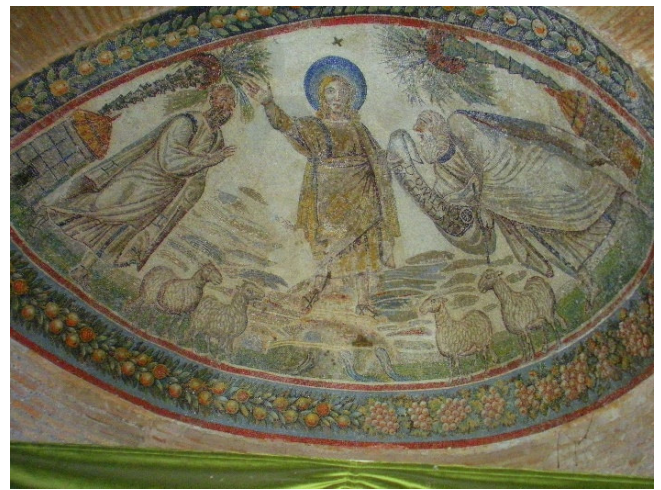
Santa Costanza

Sie besuchen zudem die nahe Kirche Santa Costanza , die sich Constantia als Mausoleum errichten ließ. Hier sehen Sie eine Kopie ihres prachtvollen Marmorsarkophags (das Original befindet sich in den Vatikanischen Museen).