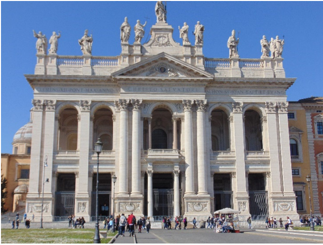
San Giovanni in Laterano

Zum Tagesabschluss besichtigen Sie San Giovanni in Laterano , eine weitere der vier Patriarchalbasiliken Roms. Eine Inschrift an der Fassade weist sie als „Mutter und Haupt aller Kirchen der Stadt und des Erdkreises“ aus. Hier werden u. a. die Reliquienhäupter von Petrus und Paulus verehrt.