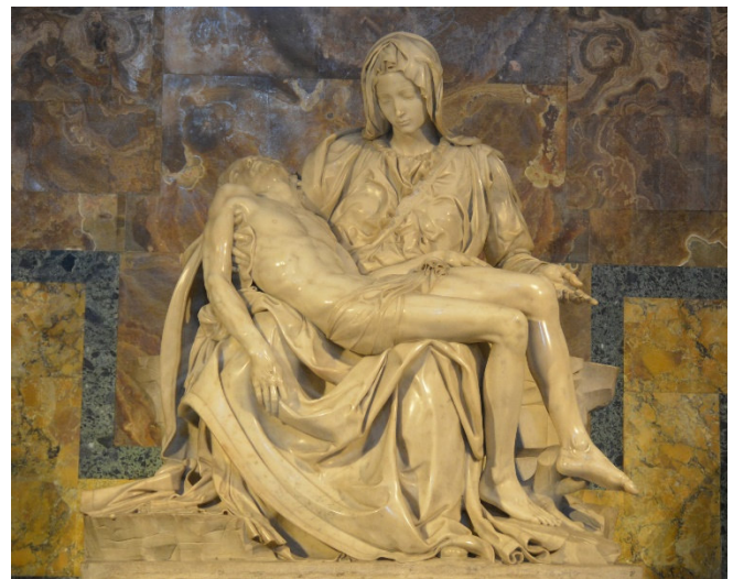
Michelangelos Pietà