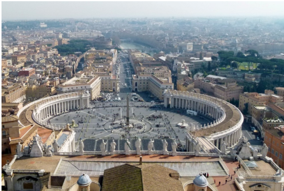
Rom Petersplatz

„In seinem langen Künstlerleben schuf Giovanni Lorenzo Bernini (1598–1680) viele außergewöhnliche Werke der Architektur und der Skulptur. Die allermeisten davon finden sich in Rom. Wenn man diese phantastische Stadt auf den Spuren seiner Werke durchstreift, kommt man an die bedeutendsten Plätze wie das Kapitol und den Petersdom, droht sich aber nicht in der Fülle der Denkmäler zu verlieren. Man begreift, wie das Barock begann, wie es sich entwickelte und was es ausgelöst hat, das wird ein ungewöhnliches Kunsterlebnis.