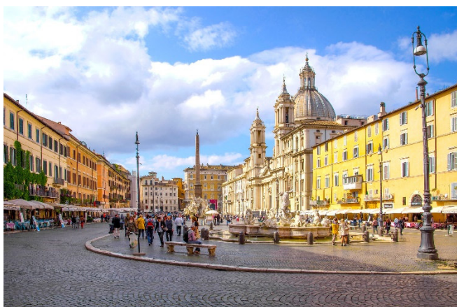
Piazza Navona

Im Anschluss erwartet Sie ein Abschiedsessen in einer typisch römischen Trattoria.