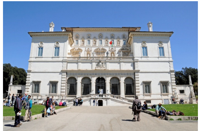
Galleria Borghese

Zimmerbezug für die nächsten 4 Nächte im zentral gelegenen 4-Sterne-Hotel Palatino. Mit einem gemeinsamen Abendessen im Hotel klingt der Tag aus.