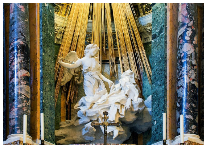
Santa Teresa