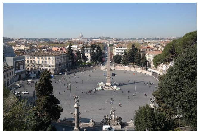
Piazza del Popolo

In vergangenen Jahrhunderten betraten Besucher aus dem Norden die Stadt Rom durch die Porta del Popolo, so auch Johann Wolfgang von Goethe. Die Kirche Santa Maria del Popolo mit ihrer markanten Silhouette zählt (mit ihren Vorgängerbauten) zu den ältesten Pfarrkirchen Roms. Sie wurde 1505 von Bramante um die Apsis erweitert und im 17. Jh. durch Restaurierungen von Bernini. In der Cerasi-Kapelle der Kirche werden Caravaggios „Bekehrung des Saulus“ und „Kreuzigung des Petrus“ gezeigt.