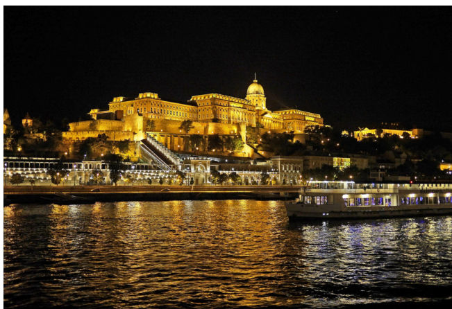
Budapest bei Nacht

Äußerst spannend wird die geführte Innenbesichtigung des Museums der Schönen Künste sein. Im größten Kunstmuseum Ungarns sehen Sie unter anderem verschiedenste Objekte aus der europäischen Kunstgeschichte des 13. – 21. Jh.s. Die unglaubliche Anzahl an Kunstschätzen und Kunstwerken wird Ihnen noch lange in Erinnerung bleiben.