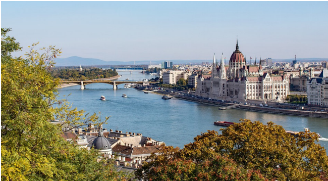
Parlament CC0 at-pixabay

Bei einem gemeinsamen Spaziergang nehmen Sie die ersten Eindrücke der Stadt auf und stimmen sich auf die kommenden, ereignisreichen Tage ein. Mit einem gemütlichen Abendessen im Hotel klingt der Tag aus.