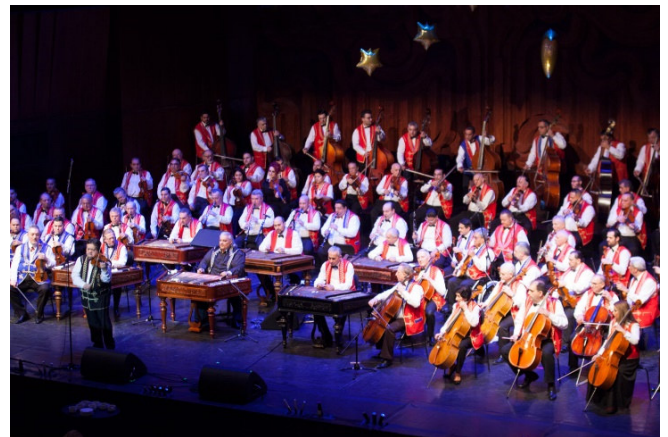
Budapest Gypsy Symphony Orchester

Am späten Nachmittag bleibt Zeit für freie Unternehmungen. Bummeln Sie über den Wintermarkt , der zu dieser Zeit nach Weihnachten noch geöffnet ist oder bewundern Sie die erstaunliche Architektur der Stadt.