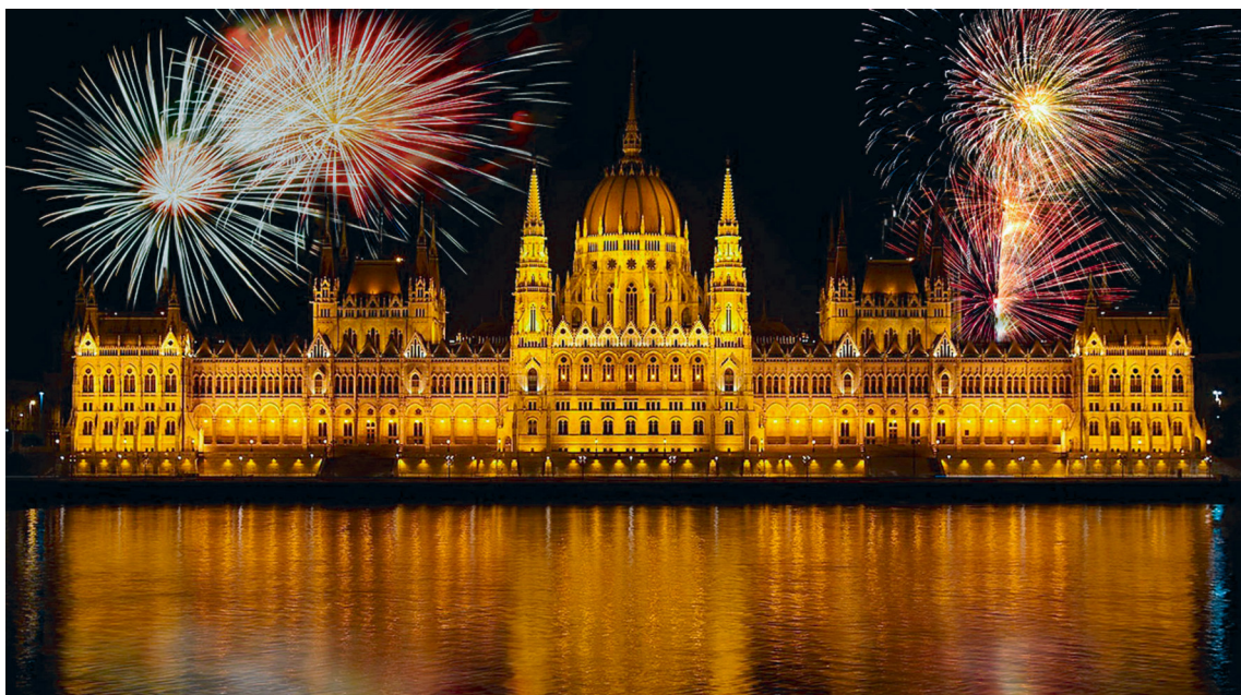
Parlament in Budapest

Begleiten Sie uns zum Jahreswechsel nach Budapest und erleben Sie eine Musikstadt von Weltrang . In der Heimat von Franz Liszt und Béla Bartók verschmelzen die musikalischen Traditionen der Roma mit den Höhepunkten der Klassik und der ungarischen Volksmusik zu einem faszinierenden Dreiklang .