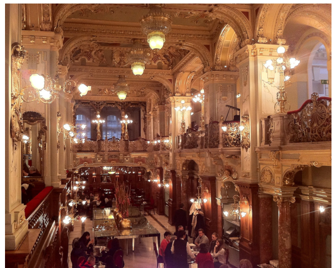
New York Café

Zum Mittagessen werden Sie im einzigartigen New York Café in der Nähe des Palastviertels erwartet. Glanzstück der prachtvollen Ausstattung aus der Gründerzeit sind die einmaligen und über hundert Jahre alten Deckenmalereien von Gusztáv Mannheimer und Ferenc Eisenhut. Darüber hinaus begeistert das New York Café mit herausragender Küche.