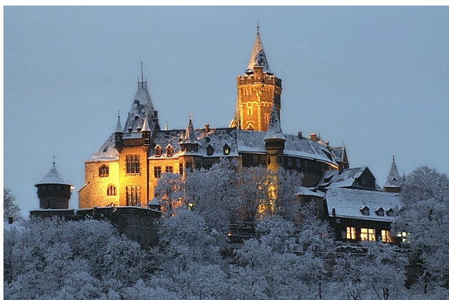
Schloss Wernigerode

Den heutigen Vormittag widmen Sie einem ausführlichen Rundgang durch Wernigerode. Hoch oben über Wernigerode thront das imposante Schloss, welches die Silhouette der Stadt maßgeblich prägt. Unten im Tal vermittelt die Stadt mit ihren winkligen Gassen und den reich ornamentgeschmückten Fachwerkhäusern noch immer einen Eindruck von der ursprünglichen Anlage. Das bekannteste Bauwerk Wernigerodes ist das spätgotische Rathaus , ein Fachwerkbau mit steil aufstrebenden Erkertürmen und einer doppelläufigen Freitreppe.