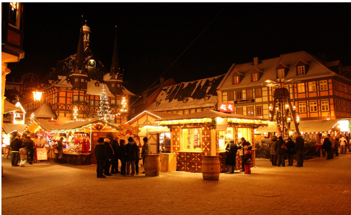
Weihnachtsmarkt Wernigerode

Besuchen Sie den Harz mit seinen bekannten und romantischen Weihnachtsmärkten und stimmen Sie sich auf die Vorweihnachtszeit ein. Mit seinen verträumten Tälern und weiträumigen Hochflächen, den rauschenden Bergflüssen und schroffen Felsklippen, ist das Mittelgebirge im Herzen Deutschlands zu allen Jahreszeiten vom Hauch letzter Geheimnisse umwittert. Den besonderen Charme der winterlichen Landschaft erleben Sie hautnah bei einer nostalgischen Dampffahrt mit der Harzer Schmalspurbahn . Darüber hinaus bietet die Region in großer Zahl kulturelle Schätze und historisches Erbe, bewahrt in turmbewehrten Fachwerkstädten. Sie besuchen Goslar mit der Kaiserpfalz, besichtigen den imposanten Dom in Halberstadt und spazieren durch Quedlinburg mit der Stiftskirche und der neu eröffneten Lyonel-Feininger-Galerie . Standort Ihrer erlebnisreichen Adventsreise ist ein stilvolles 4-Sterne-Superior-Hotel im Zentrum der lieblichen Fachwerkstadt Wernigerode .