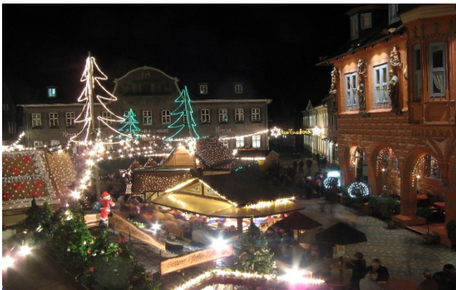
Goslar Weihnachtsmarkt

Anschließend spazieren Sie über den Goslarer Weihnachtsmarkt . Der geschichtsträchtige Marktplatz der Stadt verwandelt sich in einen romantischen und hell erleuchteten Advents- und Weihnachtsmarkt. Seine Lage im Rund der mittelalterlichen Häuserfassaden macht ihn zu etwas ganz Besonderem. Bummeln Sie gemütlich vorbei an den liebevoll dekorierten Ständen und genießen Sie bei Glühwein und Lebkuchen die vorweihnachtliche Atmosphäre.