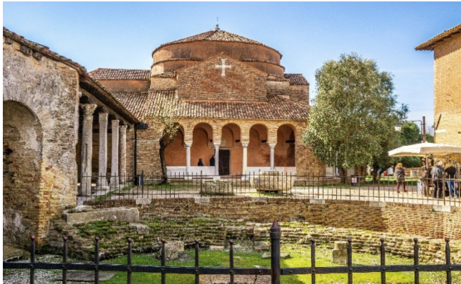
Torcello Santa Fosca

Freuen Sie sich heute auf Torcello , eine der erst-besiedelten Inseln der Lagune. Ruinen und die ehr-würdigen alten Mauern der Kirchen Santa Maria Assunta und Santa Fosca tauchen mystisch anmu-tend aus dem Gras auf. Die Basilika Assunta ist ein Bau von hohem Symbolwert, steht sie doch historisch und stilistisch gleichsam am Schnittpunkt der römi-schen und der byzantinischen Welt. Bedeutend sind die großartigen Mosaiken , darunter eine beeindruckende Darstellung des Jüngsten Gerichts.