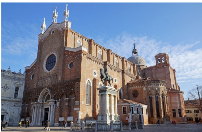
Santi Giovanni e Paolo

Bei einem Stadtspaziergang am Nachmittag besuchen Sie Venedigs größten sakralen Bau, die gotische Basilika Santi Giovanni e Paolo . Im Inneren zeigen 27 prächtige Dogengräber die Entwicklung der Bildhauerkunst Venedigs von der Spätgotik bis zum Barock.