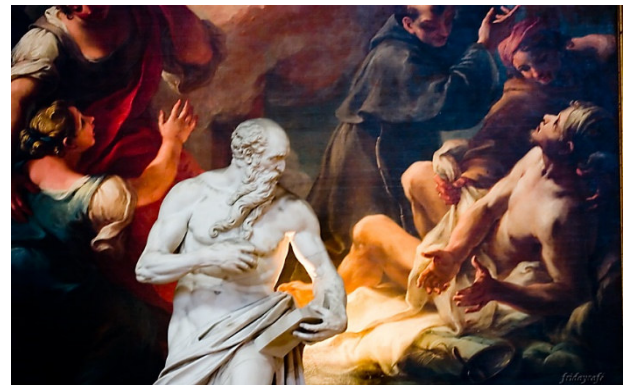
Venedig Frari-Kirche

Einen spannenden Gegenpol bildet danach ein Besuch der „Alten Meister“ in der äußerlich schlichten und dennoch weltberühmten Franziskanerkirche Santa Maria Gloriosa dei Frari . Sie birgt, neben der „Pesaro-Madonna“ auch Tizians „Himmelfahrt“, ein Schlüsselwerk der Kunstgeschichte. Zudem hat der Meister hier seine letzte Ruhestätte gefunden.