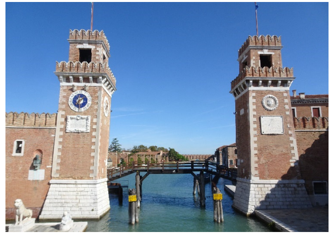
Arsenale 2019

Auch heute bleibt Ihnen im Anschluss etwas Zeit zur eigenen Erkundung.