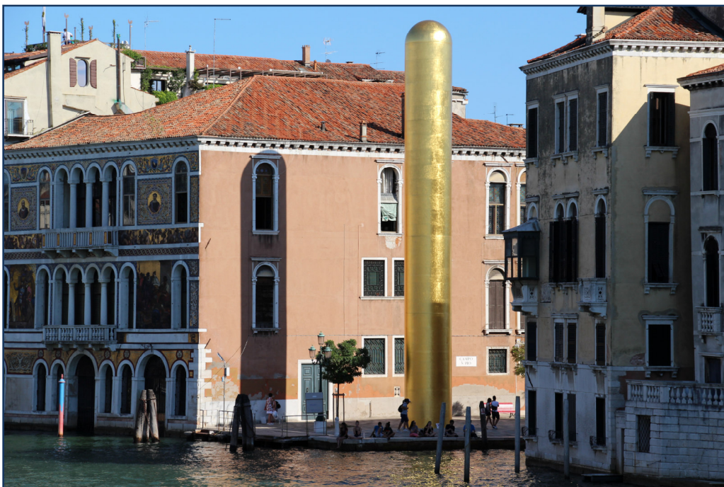
Venedig CCBY2.0 Fred Romero-at-flickr

Sie ist immer noch das unangefochtene Zentrum zeitgenössischer Kunst: La Biennale di Venezia!