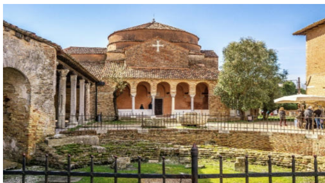
Torcello Santa Fosca

Freuen Sie sich heute auf Torcello , eine der erstbesiedelten Inseln der Lagune. Ruinen und die ehrwürdigen alten Mauern der Kirchen Santa Maria Assunta und Santa Fosca tauchen mystisch anmutend aus dem Gras auf. Die Basilika Assunta ist ein Bau von hohem Symbolwert, steht sie doch historisch und stilistisch gleichsam am Schnittpunkt der römischen und der byzantinischen Welt. Bedeutend sind die großartigen Mosaiken , darunter eine beeindruckende Darstellung des Jüngsten Gerichts.