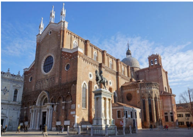
Santi Giovanni e Paolo

Gleich daneben wird Ihnen die beeindruckende Gebäudefassade der Scuola Grande di San Marco auffallen, ein Schmuckstück der Frührenaissance, und heute der Eingang zu einem Hospital.