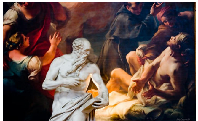
Venedig Frari-Kirche

Einen spannenden Gegenpol bildet danach ein Besuch der „Alten Meister“ in der äußerlich schlichten und dennoch weltberühmten Franziskanerkirche Santa Maria Gloriosa dei Frari . Sie birgt, neben der „Pesaro-Madonna“ auch Tizians „Himmelfahrt“, ein Schlüsselwerk der Kunstgeschichte. Zudem hat der Meister hier seine letzte Ruhestätte gefunden.