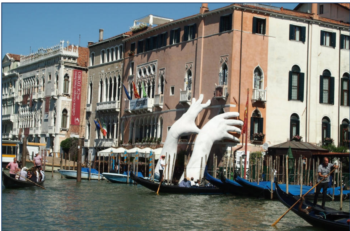
Venedig Canal Grande 2678216_1 CC0-at-pixabay

Reisetermin: 21.06. – 25.06.2022 (5 Tage)