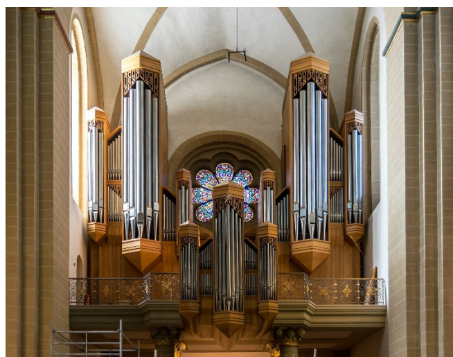
Paderborner Domorgel