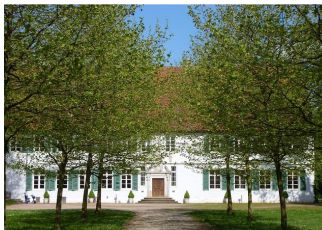
Kloster Bentlage

Nach dem Frühstück nehmen Sie Abschied von Hamburg. Auf dem Weg nach Köln besuchen Sie das zauberhafte Kloster Bentlage am Rand der Stadt Rheine, ein weitgehend intaktes Juwel westfälischer Kultur. In der mittelalterlichen Klosteranlage, die auch als Schloss genutzt wurde, sehen Sie bei einer Führung die kostbaren „Reliquiengärten“ (mittelalterliche Altarvorsätze). Vor über 500 Jahren arrangierten Zisterzienserinnen den Reliquienschatz der Bentlager Kreuzherren zu einem Kunstwerk aus Gebeinen, künstlichen Blumen, Skulpturen und Pailletten.