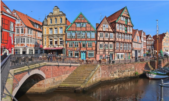
Altstadt in Stade

Die evangelisch-lutherische Hauptkirche St. Cosmae und Damiani wurde in der zweiten Hälfte des 13. Jh.s im Stil der Backsteingotik erbaut. Im Inneren beeindruckt der figurenreiche Barockaltar von Christian Precht (1674–77). Die große Orgel von 1668–75 ist ein Werk von Behrendt Huß und seines Neffen Arp Schnitger.