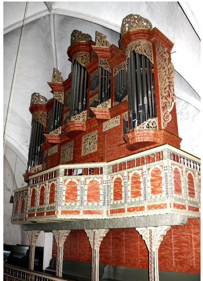
Arp Schnitger-Orgel

Nach dem Frühstück besuchen Sie heute die gotische St.-Cyprian- und Cornelius-Kirche in Ganderkesee. Bei einem Orgelanspiel durch Wolfgang Siegenbrink genießen Sie die wunderbaren Klangfarben der kostbaren, 1699 erbauten Arp Schnitger-Orgel .