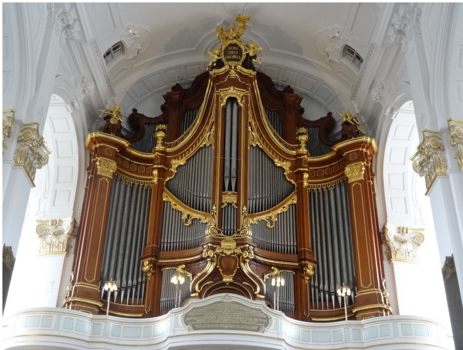
Hamburg Michaeliskirche Orgel