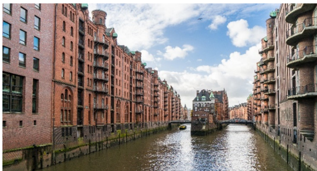
Wasserschloss in der Speicherstadt

Wahrzeichen der Stadt und ein „Kulturdenkmal für alle“ zu werden. Durch den Kaispeicher und über eine 80 m lange und 26 m hohe Rolltreppe (die so genannte Tube) sowie eine zweite, kurze Rolltreppe erreichen Sie die Plaza . Genießen Sie einen herrlichen Ausblick über die Innenstadt, Elbe und den Hafen!