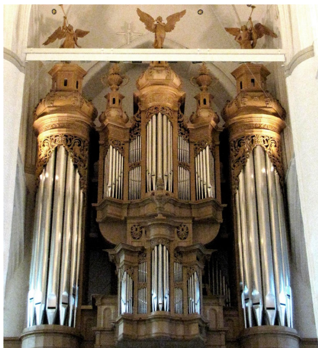
Orgel der Katharinenkirche

Nach der individuellen Mittagspause erkunden Sie mit dem Bus und an Bord einer Barkasse den geschäftigen Hafengebiete , Hamburgs „Tor zur Welt“, der eine Fläche von 100 km 2 umfasst. Als Deutschlands größter und Europas drittgrößter Containerhafen nimmt die Hansestadt eine zentrale Verteilerfunktion für weltweite Warentransporte ein. Sie sehen neben den Kais und Überseeschiffen, die St.-Pauli-Landungsbrücken und die bedeutende Werft Blohm & Voss. Beeindruckend sind auch das Containerterminal und die neu entstehende moderne HafenCity. Am Nachmittag widmen Sie sich der dreischiffigen Katharinenkirche , deren goldverzierter Turm aus Kupfer markant den Weg weist. Die Kirche der Kaufleute, Schiffsbauer und Bierbrauer steht auf einem im 13. Jh. mit 1100 Lärchenstämmen befestigten Grund.