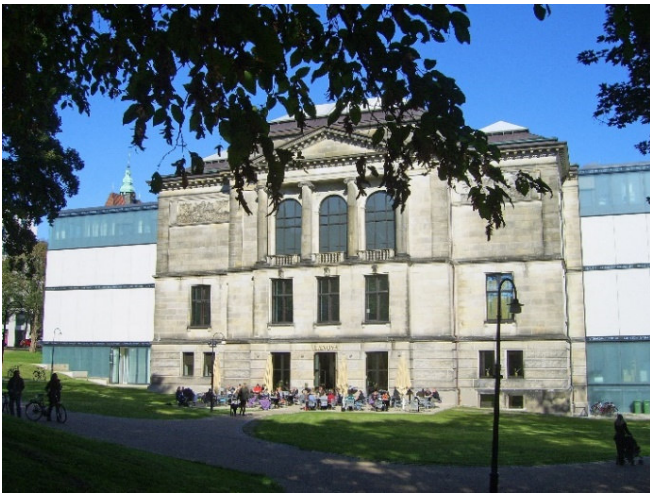
Kunsthalle Bremen

Mit dem Bus geht es nun ins Zentrum der Stadt zur Kunsthalle Bremen , die bereits seit über 150 Jahren existiert. Die erstaunlich vielfältige Sammlung mit herausragenden Gemälden und Skulpturen wird seit 2020 in ganz neuer Weise arrangiert und zeigt sich in begeisternder Ästhetik. Ergänzende Themenräume, wie „Bremen und die Welt“ oder „Globaler Handel“ behandeln alte und ungebrochen aktuelle Fragen, die uns Menschen bewegen. Freuen Sie sich auf ein besonderes Kunsterlebnis!