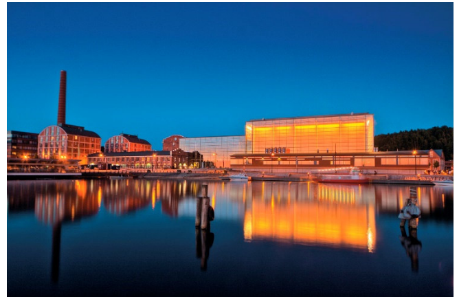
Sibelius-Konzerthaus am Abend

Das Abendessen erfolgt in Eigenregie. Unsere Reisebegleitung unterbreitet Ihnen gerne Vorschläge.