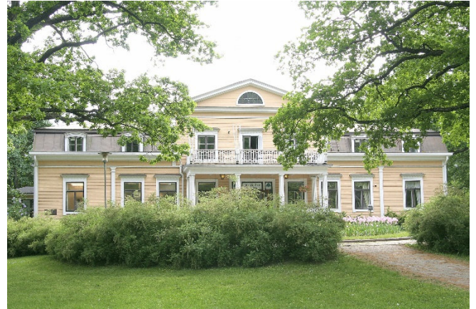
Herrenhaus Mukkula

Das zweite Wahrzeichen der Stadt ist die große Kreuzkirche , die von dem Stararchitekten Alvar Aalto erbaut wurde. Für die Fassade benutzte er markante dunkelgebrannte Backsteine als Verbindung zu dem ebenfalls interessanten Rathaus. Das Kircheninnere ist, für seinen Stil typisch, schlicht, mit klaren Linien und hellem Licht gestaltet.