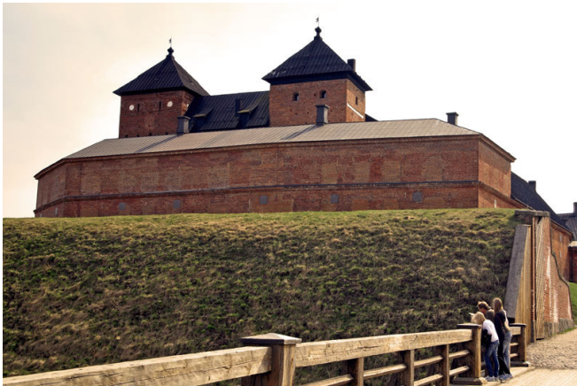
Burg von Hämeenlinna

Nach dem Frühstück starten Sie zu einem ganztägigen Ausflug nach Hämeenlinna, dem Geburtsort von Jean Sibelius.