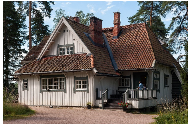
Villa Ainola