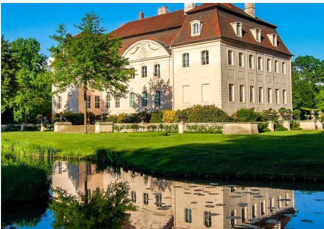
Schloss Branitz

Es bleibt ausreichend Zeit zu einem Spaziergang durch den weitläufigen Park. Genießen Sie die kunstvoll gestaltete Gartenlandschaft und die immer wieder neuen Perspektiven!