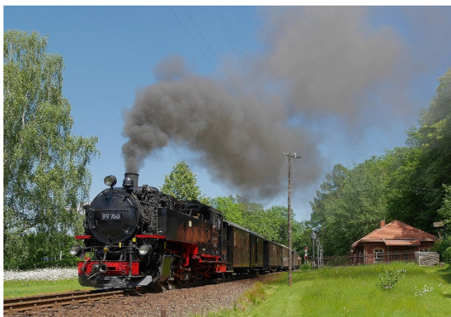
Zittauer Schmalspurbahn CC0-at-pixabay

Am Nachmittag erwartet Sie ein besonderes Erlebnis, das nicht nur Eisenbahnfreunde begeistern wird. Mit dem historischen Dampfzug der Zittauer Schmalspurbahn fahren Sie in den beschaulichen Kurort Oybin an der Grenze zu Tschechien. Gemächlich zuckelt der nostalgische Zug durch die Wälder und Täler im romantischen Naturpark Zittauer Gebirge.