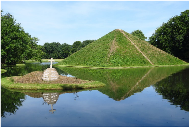
Erdpyramide im Park Branitz

Nach der Mittagspause begegnen Ihnen ein weiteres Mal die Gartenträume von Fürst von Pückler-Muskau. Nachdem er sein Schloss und den Landschaftspark in Muskau verkaufen musste, begann er 1846 mit der Umgestaltung von Schloss Branitz und der Anlage eines weitläufigen Landschaftsparks. Einzigartig sind die beiden Erdpyramiden , die zu den Höhepunkten romantischer Gartenbaukunst in Deutschland zählen. In einer der Pyramiden fanden der Fürst und seine Frau ihre letzte Ruhestätte.