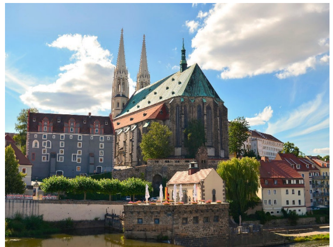
Pfarrkirche St. Peter und Paul

Vorbei am Waidhaus , dem ältesten Profanbau, erreichen Sie die Pfarrkirche St. Peter und Paul . Die fünfschiffige Hallenkirche, die auf einer Anhöhe über der Neiße liegt, gehört zu den bekanntesten Wahrzeichen von Görlitz und spiegelt den Reichtum und die Bedeutung der Stadt im späten Mittelalter. Berühmt ist die Kirche auch für die barocke Sonnenorgel aus dem Jahr 1697 des Orgelbaumeisters Eugenio Casparini. Erleben Sie den außergewöhnlichen Klang dieses einmaligen Instruments bei einem exklusiven Orgelanspiel .