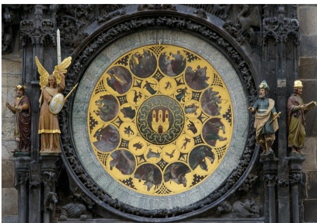
Astronomische Uhr Prag CC0 at-Pixabay

Nach dem Frühstück unternehmen Sie einen Stadtrundgang durch die Altstadt. Zum Auftakt besuchen Sie den Altstädter Ring , dessen Ursprünge bis in das 10. Jh. zurückführen, womit er als ältester Platz der geschichtsträchtigen tschechischen Hauptstadt gilt. Im Süden des Platzes befindet sich das Altstädter Rathaus mit dem Rathausturm und der 600 Jahre alten Astronomischen Uhr . Jede Stunde defilieren vor den Augen der Zuschauer Apostel, es läutet eine Glocke und der goldene Hahn kräht. Außerdem sehen Sie die mit detailreichen Fassaden an der Ostseite des Altstädter Rings thronende Teynkirche (14. Jh.).