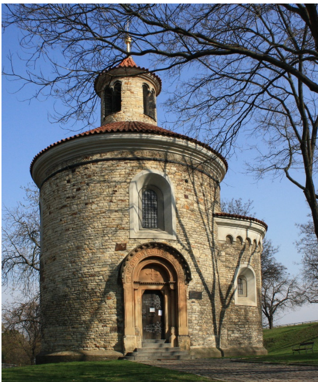
Romanische Rotunde

Bei einem gemeinsamen Rundgang durch die ehemalige Königsresidenz sehen Sie die St.-Peter- und Paul-Kirche , die romanische Rotunde , die Kasematten (Außenbesichtigungen) und den berühmten Friedhof, auf dem viele bedeutende tschechische Persönlichkeiten ruhen. Die Gräber gleichen einzigartigen Kunstwerke; das imposanteste ist ohne Zweifel das Mausoleum Slavín, eine gemeinsame Gruft berühmter Tschechen, wie Alfons Mucha und Ema Destinová.