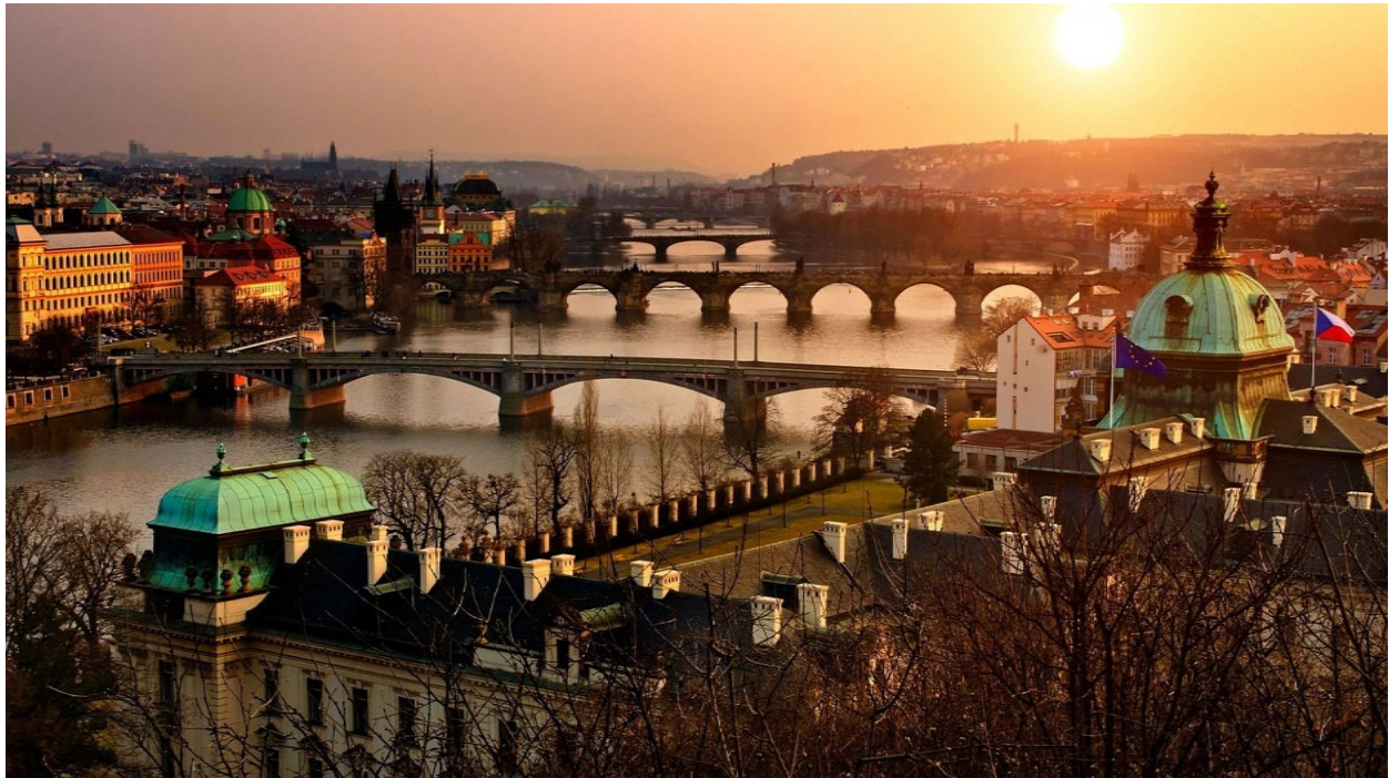
Prag im Sonnenuntergang

Stolz blickt die „ Goldene Stadt “ an der Moldau zurück auf eine lange und bewegte Geschichte. Über viele Jahrhunderte war Prag eines der führenden politischen und kulturellen Zentren im Herzen Europas. Die Prager Burg war mehr als einmal Residenz deutscher Kaiser und in der bereits im Mittelalter gegründeten Universität lehrten berühmte Wissenschaftler. So wurde die Stadt von ihren Herrschern und ihren Bürgern immer wieder kunstvoll ausgebaut und zeigt sich heute als Spiegel europäischer Bau- und Architekturgeschichte . Doch Prag war und ist auch eine Stadt der Musik , die für die Heimat und Wirkungsstätte für viele bedeutende Komponisten bekannt ist.