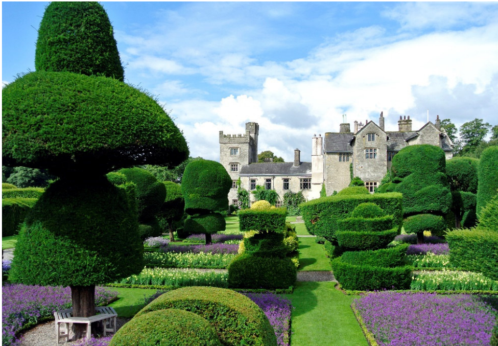
Levens Hall

Entdecken Sie den bezaubernden Norden Englands zur schönsten Jahreszeit – eine Landschaft mit faszinierenden Reizen, voller Historie, geprägt von keltischen und römischen Einflüssen mit pittoresken Städten und traumhaft schönen Beispielen britischer Gartenkultur!