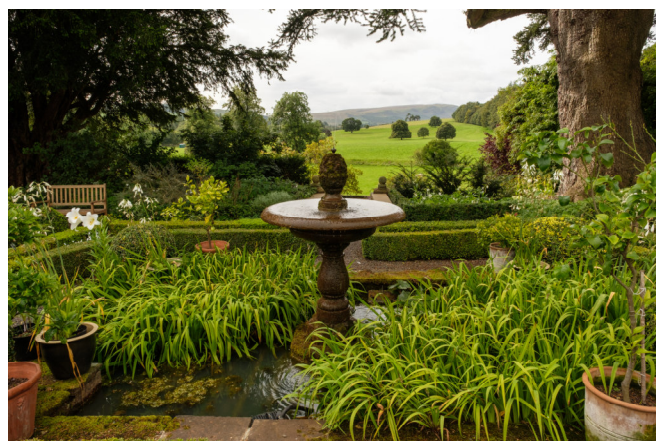
Dalemain Garden Eins

Weiterfahrt nach Kendal in den Ausläufern des Lake Districts. Dort beziehen Sie Ihre Zimmer für die ersten beiden Nächte im zentralen Riverside Hotel, das bezaubernd am Fluss Kent gelegen ist.