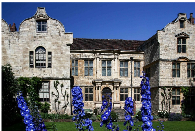
York Garden Treasurer's House CCBYSA4.0 nican45-at-flickr

Sie werden sich schlagartig ins Mittelalter zurückversetzt fühlen! Bekannt ist die Straße auch für typisch britische Spezialitäten im „Earl Grey Tea Room“ oder für leckere „Pulled Pork-Sandwiches“.