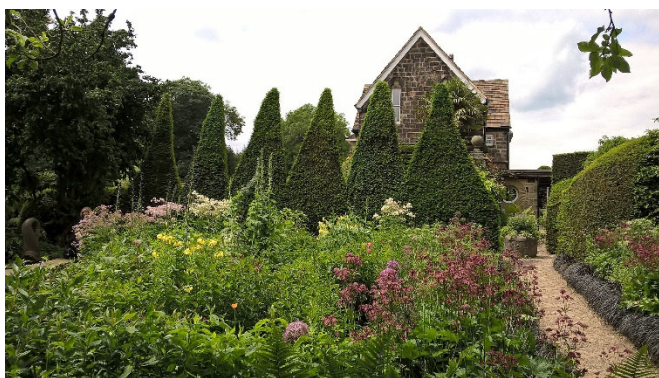
York Gate Garden innen

Am Abend lassen Sie, bei einem Abschiedsabendessen in einem Restaurant, die ereignisreichen letzten Tage noch einmal Revue passieren.