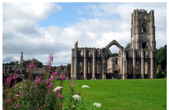
Fountains Abbey

Den nun folgenden abwechslungsreichen Ausflug beginnen Sie mit einem Besuch der Kirche in Ripley , wo Sie den einzigartigen Kniebüsser-Stein und die Burg (von außen) kennenlernen.