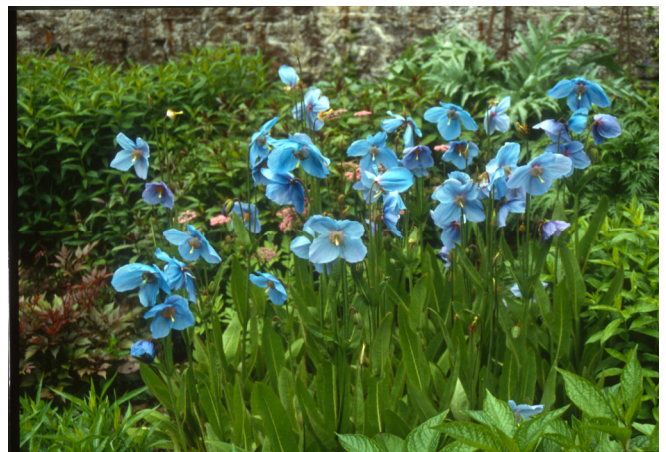
Himalayamohn - Meconopsis grandis (C) S. Stein

gen – umgeben von Wäldern – inmitten von Bergzügen. Enge Serpentinaen schlängeln sich an Wasserfällen und mit Efeu bewachsenen Steinbrücken vorbei in die Täler. Und, wohin man blickt, Schafe, Schlösser und alte Steinhäuser.