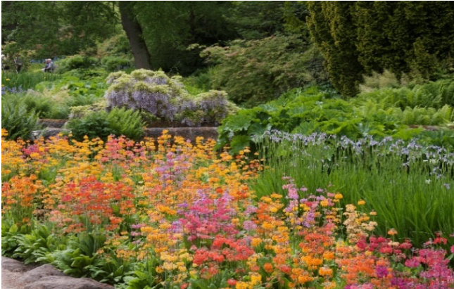
Harlow Carr Garden Streamside

Zum Abendessen treffen Sie sich in einem typischen gemütlichen Pub in Fußnähe des Hotels.