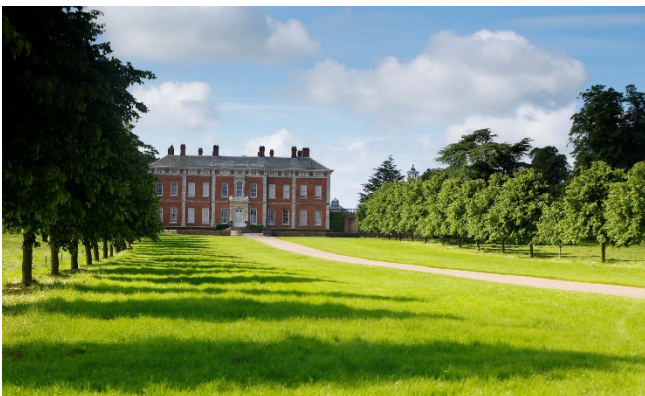
Beningbrough Hall

Der Stillingfleet Lodge Garden bei York ist ein privater Cottagegarten mit natürlichem Flair , individuell gestalteten Gartenräumen, Wasserelementen und geschickt verteilten Skulpturen. Diese gibt es auch im angeschlossenen Café zu sehen, dazu selbst gebackenen Kuchen, Tees und Pflanzen aus der Gärtnerei. In dieser charmanten Umgebung genießen Sie einen Mittagsimbiss .