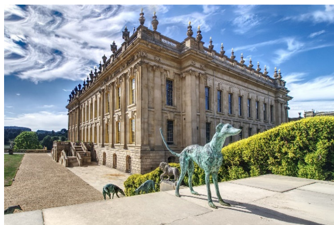
Chatsworth House

Nun heißt es Abschied nehmen vom zauberhaften Nordengland, das Sie sicherlich fasziniert hat. Weiterfahrt zum Flughafen Manchester und Rückflug nach Düsseldorf.