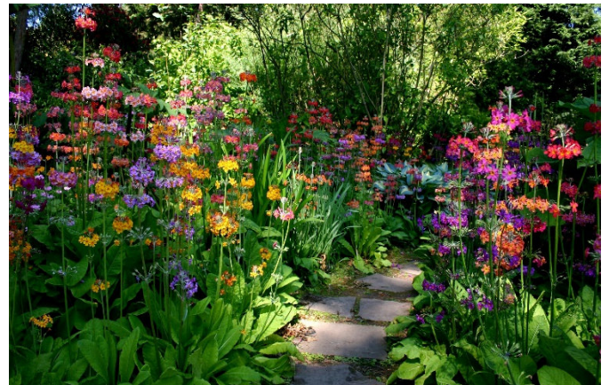
Newby Hall

Am Nachmittag besuchen Sie Newby Hall , das zu den schönsten privat bewohnten Herrenhäusern der Gegend zählt. Die Innenräume sind sehenswert, viel mehr aber noch im „ Garden of the Year “ die prachtvollen „borders“ : Staudengärten nach bewährter britischer Tradition, die jede Pflanze optimal zur Geltung bringen. Vergessen Sie nicht Ihre Kamera, es wird sich wegen der vielen Ideen zum Nachmachen lohnen!