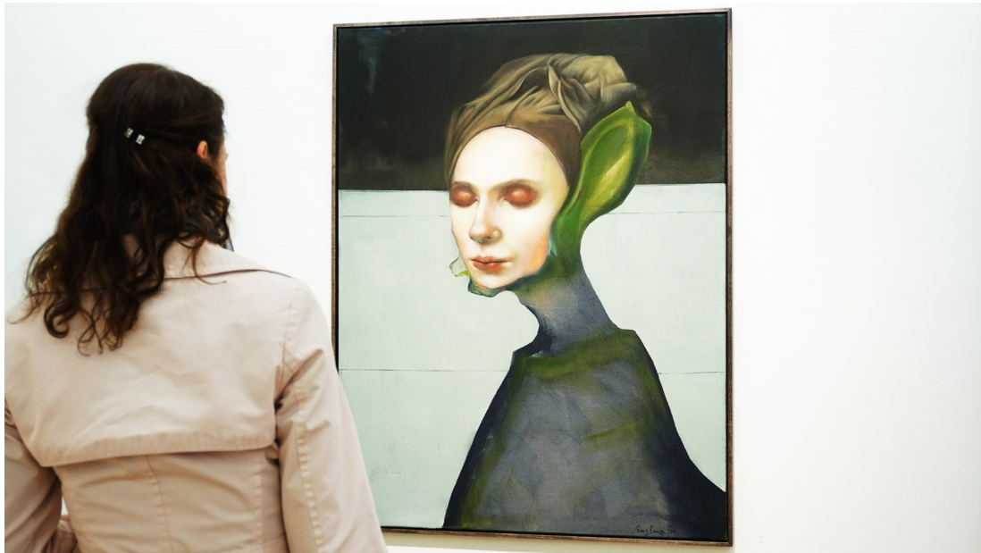
New York meets Berlin 2019 @ Kunstlebenberlin

Seit bereits über 15 Jahren lockt das Gallery Weekend Berlin alljährlich Kunstinteressierte aus aller Welt in die deutsche Hauptstadt. Jahr für Jahr reisen Sammler, u. a. aus USA, Russland und China, zu dem mit am wichtigsten Kunstevent Deutschlands an.