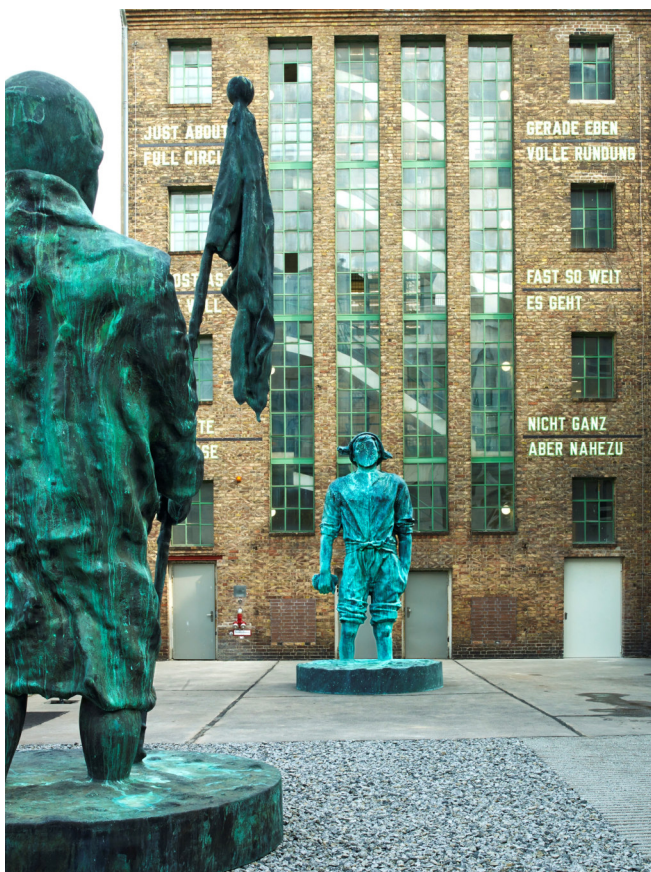
Konrad Fischer Galerie außen_Thomas Schütte

Gegen 14 Uhr kehren Sie zu Ihrem Hotel zurück und treten mit vielen spannenden neuen Kunsteindrücken im Gepäck Ihre individuelle Heimreise an.