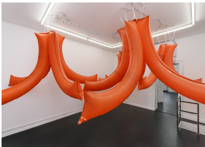
Chertlücke_Franco Mazzucchelli