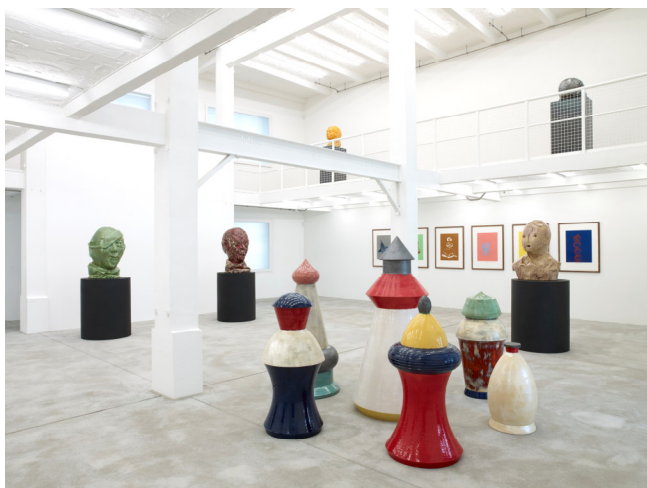
Konrad Fischer Galerie_Thomas Schütte (C) Gallery Weekend Nic Tenwiggenhorn