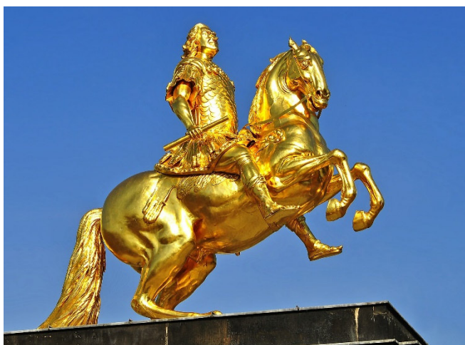
Reiterstandbild August des Starken

Am Vormittag führt ein Spaziergang über die steinerne Augustusbrücke auf das andere Elbufer auf dem sich die Dresdner Neustadt befindet. Von hier bietet sich der weltberühmte Canaletto-Blick auf die imposante Silhouette der Dresdner Altstadt. Auf dem Neustädter Markt erhebt sich das goldene Reiterstandbild August des Starken .