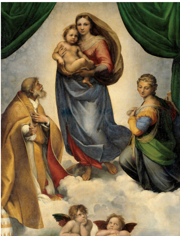
Raffael: Sixtinische Madonna

Im Mittelpunkt Ihres Rundgangs zu den Höhepunkten der europäischen Kunstgeschichte steht ein Meisterwerk des italienischen Malers Raffael, der vor genau 500 Jahren verstarb: die „ Sixtinische Madonna “.