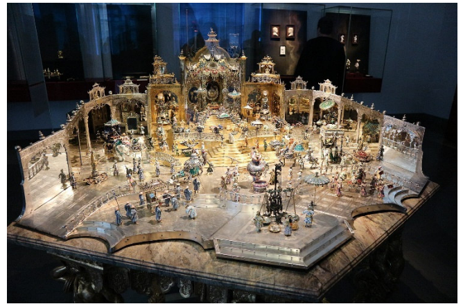
Neues Grünes Gewölbe: Hofstaat zu Delhi am Geburtstag des Großmoguls

Bei Ihrem Rundgang sehen Sie die originalgetreu wiederhergestellten Paraderäume aus der Zeit August des Starken . Nach umfangreicher Restaurierung sind diese eindrucksvollen Bereiche des Schlosses der Öffentlichkeit erst seit September 2019 wieder zugänglich. In der Rüstkammer werden prächtige Kleider und reich verzierte Rüstungen aus der Zeit der sächsischen Herrscher gezeigt.