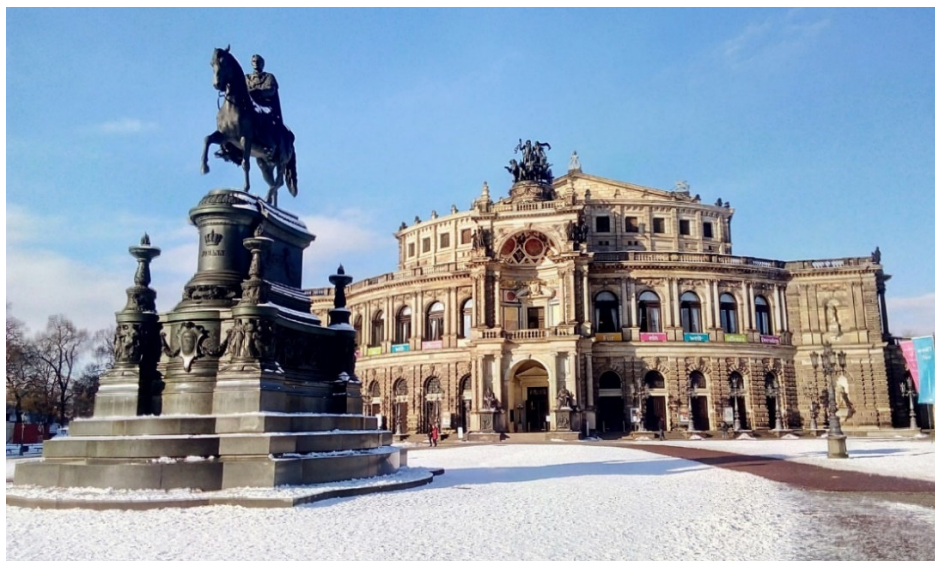
Semperoper in Dresden

Ihre glanzvollste Epoche erlebte die Stadt Dresden in der Zeit des Barocks unter der Regentschaft des sächsischen Kurfürsten Friedrich August I., der als „ August der Starke “ in die Geschichte einging. In seiner mehr als 30 Jahre währenden Regierungszeit entstanden der Zwinger , die Frauenkirche und viele weitere bedeutende Bauwerke, die schon seine Zeitgenossen mit Erstaunen erfüllten. Seine Leidenschaft für Kunst und Schönheit legte den Grundstein für eine Vielzahl von bedeutenden Museen , deren kostbare Sammlungen Besucher aus aller Welt verzaubern.