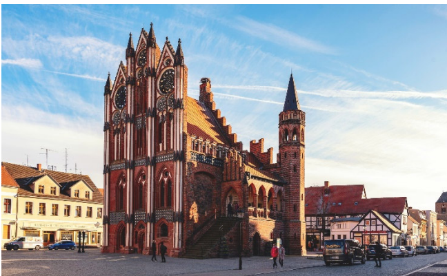
Rathaus in Tangermünde

Am Vormittag erkunden Sie bei einem gemeinsamen Rundgang das historische Zentrum von Tangermünde . Das an der Mündung der Tanger in die Elbe liegende Städtchen hat sich sein mittelalterlich anmutendes Stadtbild bis heute bewahrt. Viele Gebäude im Stil der Backsteingotik erinnern an die Blüte der Stadt zur Zeit der Hanse.