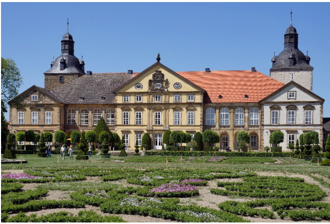
Schloss Hundisburg