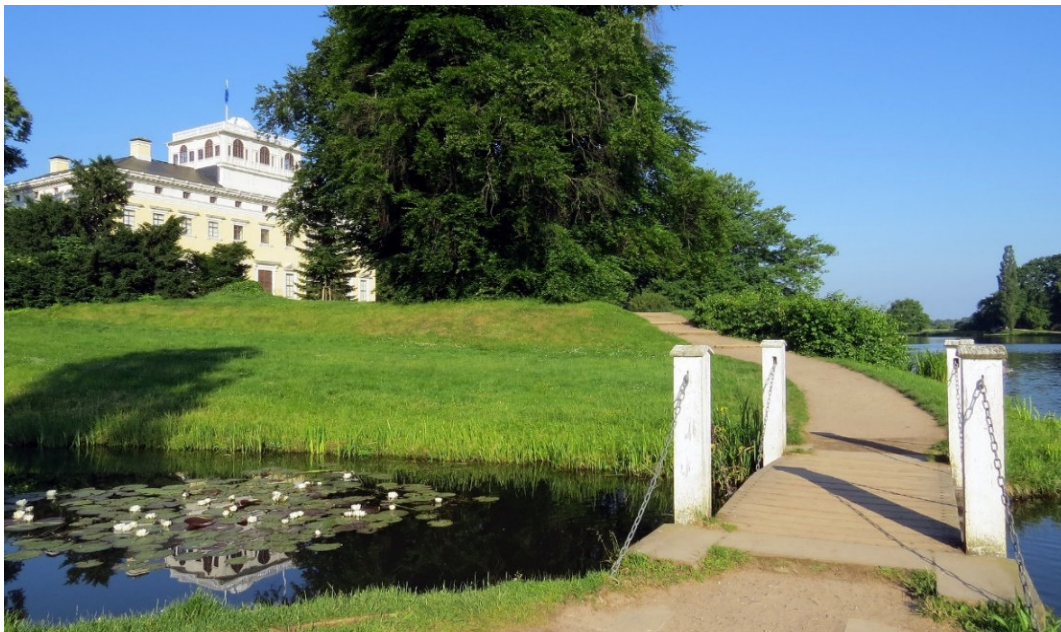
Wörlitzer Park

Seit vielen Jahrhunderten prägen prächtige Barockgärten , eindrucksvolle Landschaftsparks und verträumte Gärten das Kulturerbe Sachsens-Anhalts. Die botanische Vielfalt macht die beschauliche Region im Herzen Deutschlands zu einem gefragten und viel besuchten Reiseziel für Natur- und Gartenfreunde aus aller Welt.