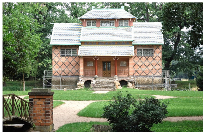
Teehaus Oranienbaum

Durch die Mosigkauer Heide fahren Sie weiter zum Gutspark Altjeßnitz , der idyllisch in der Auenlandschaft der Mulde liegt. Im Zentrum des beschaulichen Landschaftsparks befindet sich der größte und älteste barocke Irrgarten Deutschlands. Verschlungene Wege führen durch zwei Meter hohe Hainbuchenhecken zu einer Plattform im Zentrum. Von hier aus lässt sich der gesamte Garten überblicken.