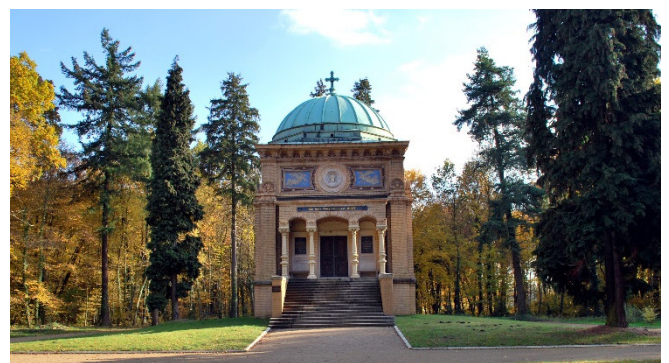
Mausoleum im Stadtpark Tangerhütte

Am Nachmittag fahren Sie weiter nach Tangerhütte . Der Name der Stadt stammt aus dem 19. Jh. und erinnert an die wirtschaftliche Bedeutung der Eisenhütte. Der erfolgreiche Eisenfabrikant Franz Wagenführ ließ ab 1873 an seinem Familienwohnsitz einen weitläufigen Landschaftspark anlegen.