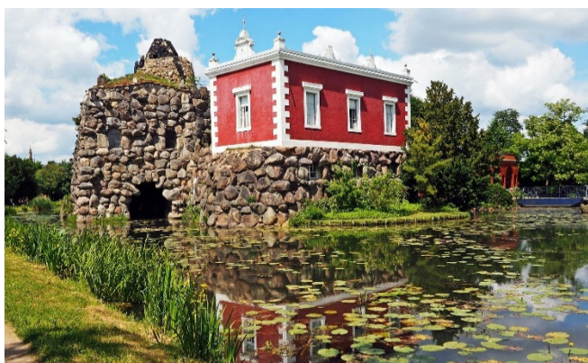
Insel Stein mit Villa Hamilton

Am östlichen Ausläufer des Wörlitzer Sees liegt die Insel Stein mit der Villa Hamilton . Entstanden als Erinnerung an eine Reise nach Neapel, entführen die klassizistische Villa, die Nachbildung des Vesuvs und ein antikisierendes Theater ihre Besucher in den sonnenigen Süden Italiens.