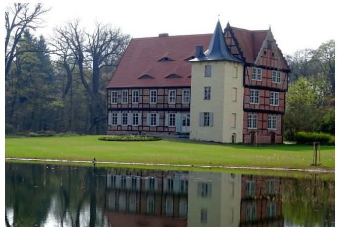
Herrenhaus Briest

Nächstes Ziel ist der nahegelegene Gutspark Briest , den ein im 19. Jh. im Stil der Spätrenaissance erbautes Herrenhaus umgibt. Das sehenswerte Ensemble aus verschiedenen Gebäuden und Landschaftspark bildet den ältesten Stammsitz der Familie von Bismarck . Der von Gartenbaudirektor Schaumburg entworfene Park verbindet Elemente der französischen und englischen Landschaftsarchitektur.