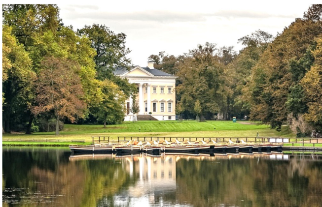
Schloss Wörlitz