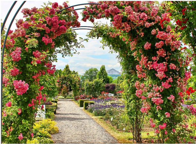
Europa-Rosarium Sangerhausen

Auf Ihrem Rückweg ins Rheinland besuchen Sie am Vormittag das Europa-Rosarium Sangerhausen . Der im Jahr 1903 von Botanikern und Rosenfreunden angelegte Garten umfasst heute mehr als 8600 Rosensorten. Die üppigen Parkanlagen mit Pavillons und malerischen Teichen sind ein einmaliges Erlebnis für alle Sinne.