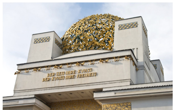
Secession CCBYSA Simon Schoeters-at-flickr

Sie sehen den berühmten Beethovenfries , Klimts monumentalen Wandzyklus. Dies ist einer der Höhepunkte des Wiener Jugendstils!