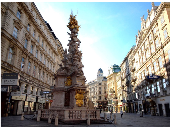
Altstadt Wien

Am Vormittag besteht Gelegenheit zu einem ausführlichen Bummel durch die Altstadt rund um die Kärntner Straße, Graben und Kohlmarkt. Oder besuchen Sie eines der berühmten Cafés der Stadt, wie das Café Hawelka, in der Dorotheergasse 6 (fakultativ). Nach seiner Eröffnung im Jahre 1939 entwickelte sich das Kaffeehaus rasch zum beliebten Treffpunkt der Wiener Kunstszene.