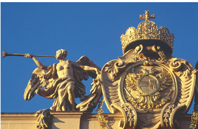
Detail an der Hofburg

Nach einer individuellen Mittagspause bringt der Bus Sie zur Hofburg. Von hier aus unternehmen Sie einen ersten gemeinsamen Stadtspaziergang . Sie erkunden die prächtige Wiener Innenstadt mit den wichtigsten Sehenswürdigkeiten, wie z. B. der ehemaligen kaiserlichen Residenz, der Hofburg . Hier befinden sich, neben der Schatzkammer mit den Reichsinsignien, auch die Stallungen der weltberühmten weißen Pferde – der Lipizzaner (Außenbesichtigungen).