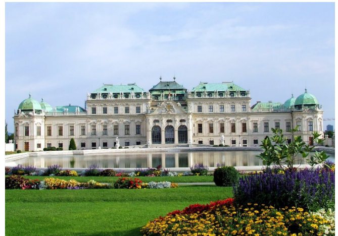
Belvedere Wien

Abends haben Sie fakultativ die Möglichkeit das Burgtheater , die wichtigste Schauspielbühne Österreichs und das größte Sprechtheater Europas, zu besuchen ( Preise und Verfügbarkeit auf Anfrage ). Die elegante Innenausstattung mit Fresken der Gebrüder Klimt und Franz Matsch wird Sie begeistern.