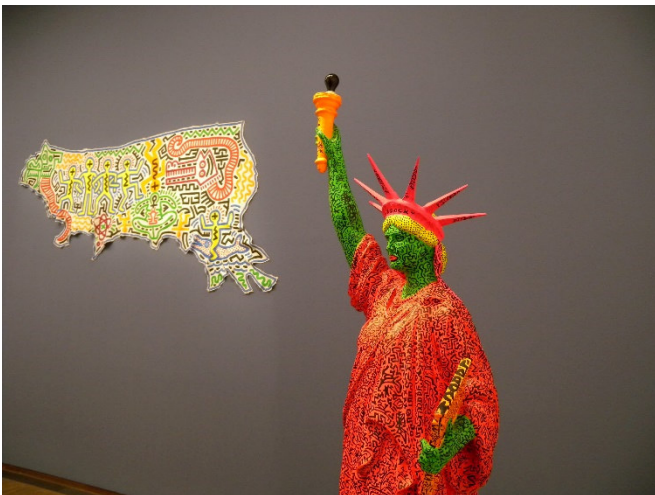
Albertina Keith Haring

Der Abend steht Ihnen zur eigenen Gestaltung zur Verfügung. Genießen Sie z. B. einen ganz anderen Eindruck der charmanten Metropole bei einer Fahrt auf dem Riesenrad im Prater (fakultativ)! Sie können die Stadt von oben betrachten und haben einen fantastischen Blick auf die Donau und die Donauinsel.