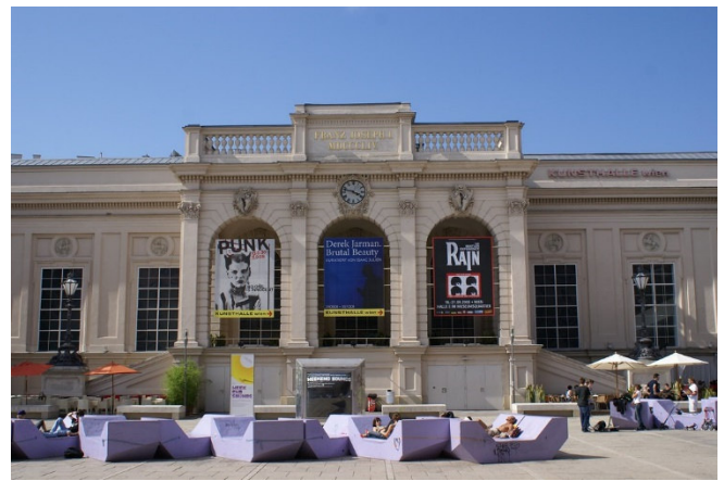
Wien MuseumsQuartier

Mittags erreichen Sie das spektakuläre MuseumsQuartier , das zu einem Szene-Treff am Rande der Altstadt geworden ist. Nach einer individuellen Mittagspause erfahren Sie bei einer Außenführung, wie aus den kaiserlichen Hofstallungen das 2001 eröffnete, Aufsehen erregende Kunstareal entstanden ist. Moderne Architektur wurde mit imperialer Pracht verbunden; Kunstschaffen mit Kunsterleben verwoben.