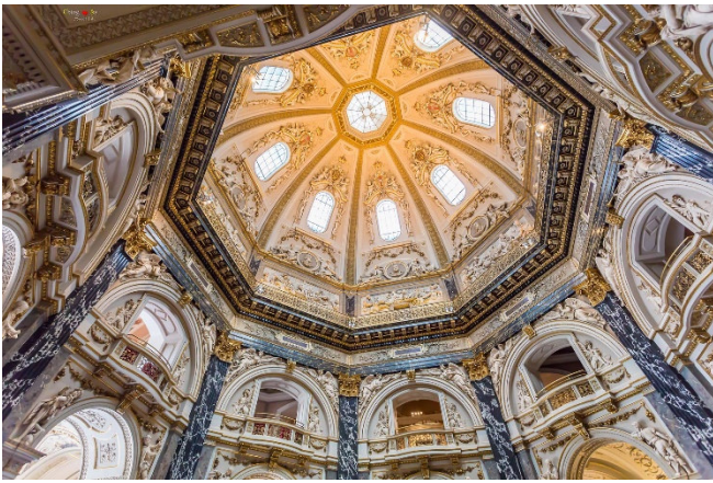
Wien Kunsthistorisches Museum

Der Nachmittag ist dem Naturhistorischen Museum gewidmet, das weltberühmte und einzigartige Exponate präsentiert und zudem einen wunderbaren Blick auf die Dächer der Stadt ermöglicht. Im Sauriersaal sehen Sie riesige Skelette gigantischer Urzeittiere. Die 29 500 Jahre alte Venus von Willendorf führt Sie zu den Anfängen unserer Kultur. Zudem zählen die größte Meteoritensammlung der Welt mit dem spektakulären Neuzuwachs, dem Marsmeteoriten „Tissint“, und die neue anthropologische Dauerausstellung zur Entstehung und Entwicklung des Menschen zu den Höhepunkten der 39 Schausäle.