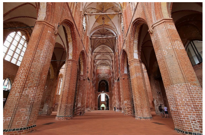
St. Georgen

Anschließend spazieren Sie weiter zur benachbarten Backsteinkirche St. Georgen . Der Wiederaufbau der größten Stadtkirche Wismars war eines der größten und aufwändigsten Projekte der Denkmalpflege in Mecklenburg-Vorpommern. Der imposante Kirchenraum strahlt eine schlichte Eleganz aus und zeugt eindrucksvoll vom hanseatischen Selbstbewusstsein im Mittelalter.