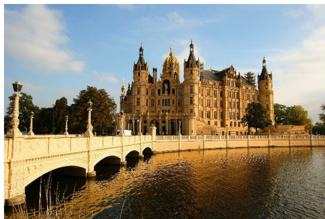
Schloss Schwerin

Nach einer individuellen Mittagspause besichtigen Sie am Nachmittag das Schweriner Schloss , das male- risch auf einer kleinen Insel im Schweriner See liegt und zu den bedeutendsten Bauten des Historismus in Europa zählt. Bei einer Führung durch das Schloss- museum sehen Sie die herzoglichen Wohnräume in der „Beletage“ und den prachtvoll ausgestatteten Thronsaal. Die Ahnengalerie zeigt die Portraits aller regierenden Herzöge der Dynastien Mecklenburgs vom 14. bis zum 18. Jh. Zum Abschluss bietet sich die Gelegenheit zu einem Spaziergang durch den Burg- garten und den liebevoll angelegten Schlosspark . Genießen Sie die beschauliche Atmosphäre und die immer wieder neuen Perspektiven mit Blick auf das Schloss!