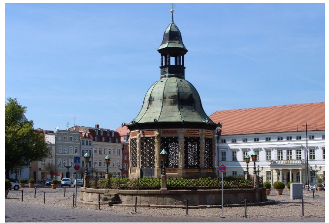
Marktplatz mit Wasserkunst

Ein weiteres Schmuckstück ist die sogenannte „Wasserkunst“ , ein filigraner Pavillon aus dem 16. Jh, der noch bis 1897 der Wasserversorgung Wismars diente. Nur wenige Schritte weiter erhebt sich der mächtige und weithin sichtbare Turm der im 2. Weltkrieg zerstörten Marienkirche , der zu den Wahrzeichen der Stadt gehört. Hier besuchen Sie eine spannende Ausstellung zu den Techniken der gotischen Backsteinarchitektur. Höhepunkt ist eine 3-D-Filmvorführung , die den Bau der mittelalterlichen Kirchen anschaulich macht.