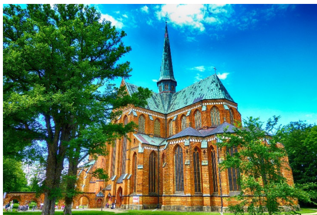
Bad Doberaner Münster

Nach einer individuellen Mittagspause besuchen Sie das Welt-Erbe-Haus , das in einer sehenswerten Ausstellung über die Geschichte der Hansestadt informiert. Im Obergeschoss des mittelalterlichen Giebelhauses bewundern Sie das Tapetenzimmer, das mit wertvollen französischen Bildrucken aus der ersten Hälfte des 19. Jh.s geschmückt ist.