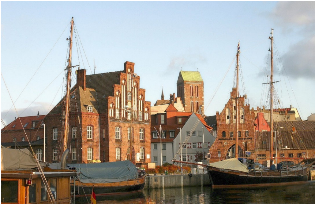
Hafen von Wismar

Schon kurz nach ihrer Gründung im Jahr 1226 wurde die Hafenstadt Wismar Mitglied der Hanse und erlebte eine lange wirtschaftliche und kulturelle Blüte, die das denkmalgeschützte und liebevoll restaurierte Stadtbild bis heute prägt. Mächtige Backsteinkirchen und kunstvoll gestaltete Giebelhäuser zeugen eindrucksvoll vom Wohlstand und Selbstbewusstsein der Kaufleute und nehmen Sie mit auf eine spannende Zeitreise in die Welt des Mittelalters und der frühen Neuzeit.