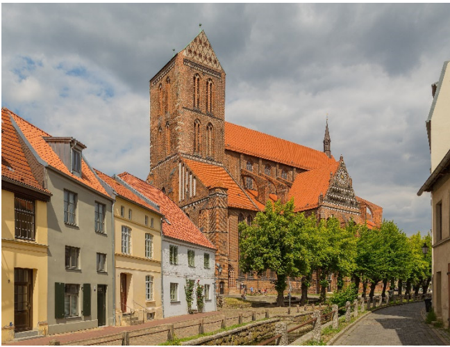
St. Nikolai

Nach einer individuellen Mittagspause am Alten Hafen unternehmen Sie eine etwa 1-stündige Hafenrundfahrt . Sie sehen den Nachbau der historischen Hansekogge Wissemara, moderne Yachten, Fischkutter, Barkassen und Passagierschiffe. Ihr Kapitän erzählt Ihnen viel Wissenswertes und manche Anekdote rund um die Entwicklung der Seefahrt an der Ostseeküste.