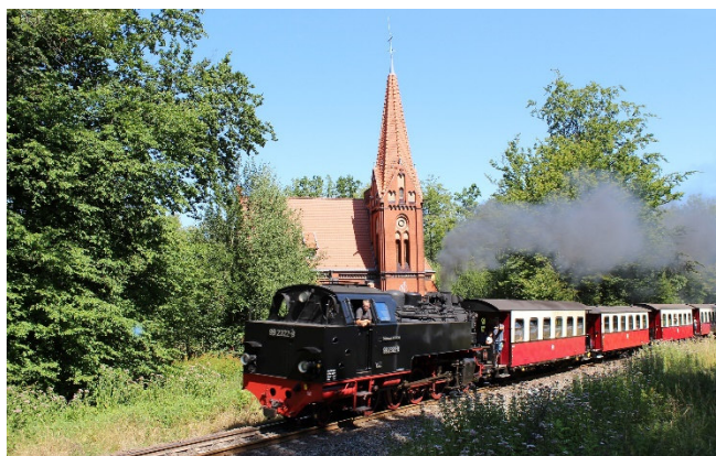
Bäderbahn „Molli“

Anschließend fahren Sie mit dem Dampfzug der historischen Schmalspurbahn von Bad Doberan nach Heiligendamm. Seit 1886 zuckelt die Mecklenburgische Bäderbahn „Molli“ gemächlich durch die engen Straßen von Bad Doberan, vorbei an der Galopprennbahn an die Ostseeküste. Gelegenheit zur individuellen Mittagspause.