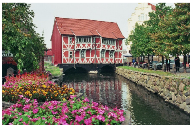
Fachwerkhaus an der Grube

Gemeinsames Abendessen im Hotelrestaurant.