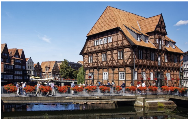
Wasserviertel in Lüneburg

Am Morgen Abfahrt im modernen Fernreisebus ab Köln (Vorübernachtung in Köln auf Anfrage). Vorbei an Dortmund und Hannover erreichen Sie gegen Mittag die alte Salz- und Hansestadt Lüneburg . Bei einem Rundgang durch die verwinkelten Gassen der Altstadt entdecken Sie zahlreiche reich verzierte Backsteinhäuser , die eindrucksvoll aus der Geschichte der Stadt und vom Wohlstand der Kaufleute und Patriazierfamilien erzählen. Besonders reizvoll ist der Stintmarkt im Wasserviertel . In den schmucken Giebelhäusern laden gemütliche Cafés und Restaurants zu einer individuellen Mittagspause ein. Genießen Sie die beschauliche Atmosphäre und den herrlichen Blick auf die Ilmenau!