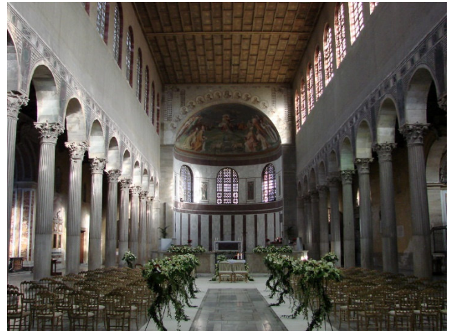
Santa Sabina

An der Piazza della Bocca della Verità mit ihren eindrucksvollen steinernen Zeugen des christlichen Roms besichtigen Sie die bemerkenswert harmonisch gestaltete Kirche Santa Maria in Cosmedin . Ihr hoher Campanile gilt als schönster der Stadt. Der Innenraum ist prachtvoll mit Marmor ausgestattet und zeigt das große Können von mittelalterlichen Architekten, Bildhauern und Dekorateurs aus der Zeit von 772 bis etwa 1124. Die Hallenkrypta mit christlichen Gräbern verbindet heidnische und christliche Elemente.