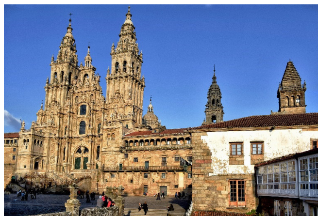
Santiago de Compostela

Zimmerbezug für 2 Übernachtungen in Santiago de Compostela und Abendessen.