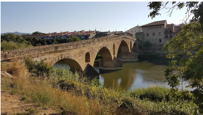
Puente la Reina

1 Übernachtung und Abendessen in Pamplona.