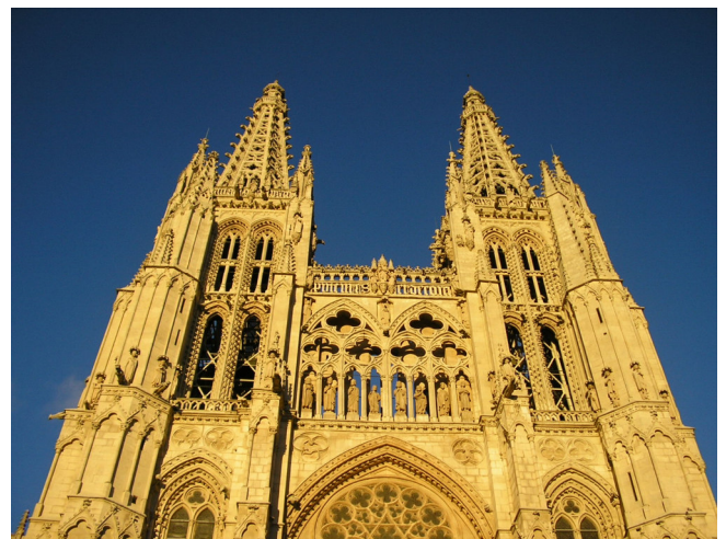
Burgos Kathedrale

1 Übernachtung und Abendessen in Burgos.