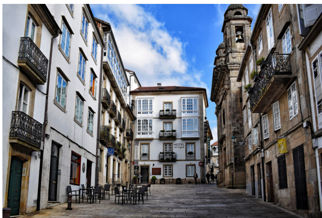
Gasse in Santiago

Am Abend erreichen Sie Ponferrada zum Abendessen und zur Übernachtung. Den Ort dominiert die mächtige Burg des Templerordens , eines der bedeutendsten Zeugnisse mittelalterlicher Militärarchitektur (Außenbesichtigung).