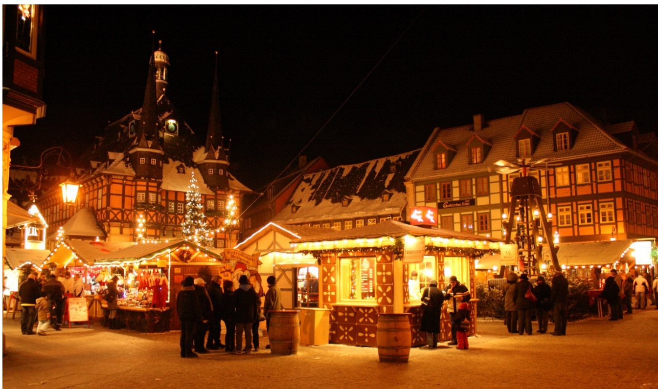
Weihnachtsmarkt Wernigerode

Besuchen Sie den Harz mit seinen bekannten und romantischen Weihnachtsmärkten und stimmen Sie sich auf die Vorweihnachtszeit ein. Mit seinen verträumten Tälern und weiträumigen Hochflächen, den rauschenden Bergflüssen und schroffen Felsklippen, ist das Mittelgebirge im Herzen Deutschlands zu allen Jahreszeiten vom Hauch letzter Geheimnisse umwittert. Den besonderen Charme der winterlichen Landschaft erleben Sie hautnah bei einer nostalgischen Dampfzugfahrt mit der Harzer Schmalspurbahn . Darüber hinaus bietet die Region in großer Zahl kulturelle Schätze und historisches Erbe, bewahrt in turmbewehrten Fachwerkstädten. Sie besuchen Goslar mit der Kaiserpfalz, besichtigen den imposanten Dom in Halberstadt und spazieren durch Quedlinburg mit der Stiftskirche und der neu eröffneten Lyonel-Feininger-Galerie . Standort Ihrer erlebnisreichen Adventsreise ist ein stilvolles 4-Sterne-Superior-Hotel im Zentrum der lieblichen Fachwerkstadt Wernigerode .