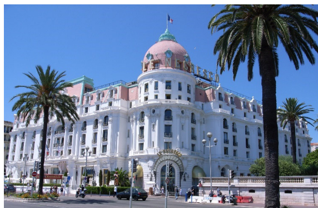
Hotel Le Negresco

Zur Mittagspause werden Sie im berühmten Hotel Le Negresco an der Promenade des Anglais erwartet. Das im Stil der Belle Époque errichtete Hotel wurde 1912 eröffnet und war schnell ein beliebter Treffpunkt der europäischen Aristokratie. Die markante Kuppel ist eine Konstruktion von Gustave Eiffel. Genießen Sie die elegante Atmosphäre bei einem kleinen Mittagessen im Hotelrestaurant La Rotonde .