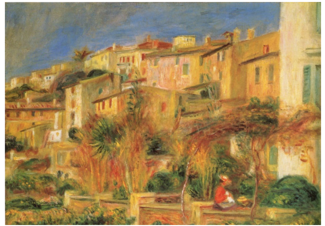
Pierre Auguste Rodin: Terrassen in Cagnes CC0-at-wikimedia.commons