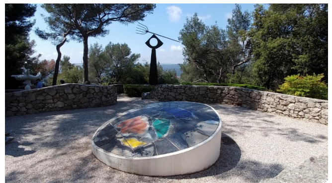
Fondation Maeght

Anschließend besuchen Sie die Fondation Maeght bei Saint-Paul-de-Vence. Das private Kunstmuseum besitzt eine der größten und bedeutendsten Sammlungen moderner und zeitgenössischer Kunst , darunter Meisterwerke von Chagall, Miró und Matisse. Die Museumsgebäude sind von einem Skulpturengarten umgeben, von dem sich immer wieder herrliche Ausblicke in diese alte Kulturlandschaft bieten.