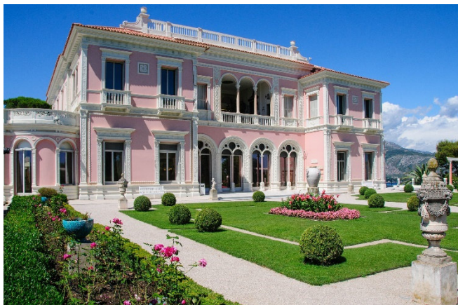
Villa Ephrussi de Rothschild

Nach einem gemütlichen Frühstück bietet sich die Gelegenheit zum Besuch eines Neujahrskonzerts im großen Apollon-Saal des Kongress- und Ausstellungszentrums Acropolis. Das Philharmonische Orchester von Nizza begrüßt das neue Jahr mit einer Auswahl klassischer Musik. Der Eintritt ist frei, eine Platzreservierung ist jedoch nicht möglich.