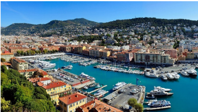
Hafen von Nizza

Bei einem gemeinsamen Spaziergang erkunden Sie am Nachmittag die malerische Altstadt von Nizza und besichtigen die im Genueser Barock gestaltete Kathedrale Sainte-Réparate . Durch schmale Gassen erreichen Sie die Kapelle Sainte-Croix der Erzbruderschaft der weißen Büsser, deren barocke Ausstattung aus dem 18. Jh. noch weitgehend original erhalten geblieben ist.