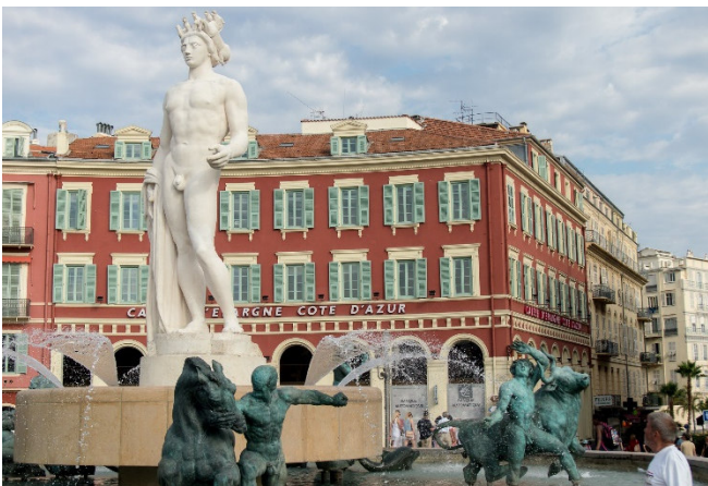
Place Masséna

Mit einem gemeinsamen Abendessen im Restaurant des Hotels klingt der Tag aus.