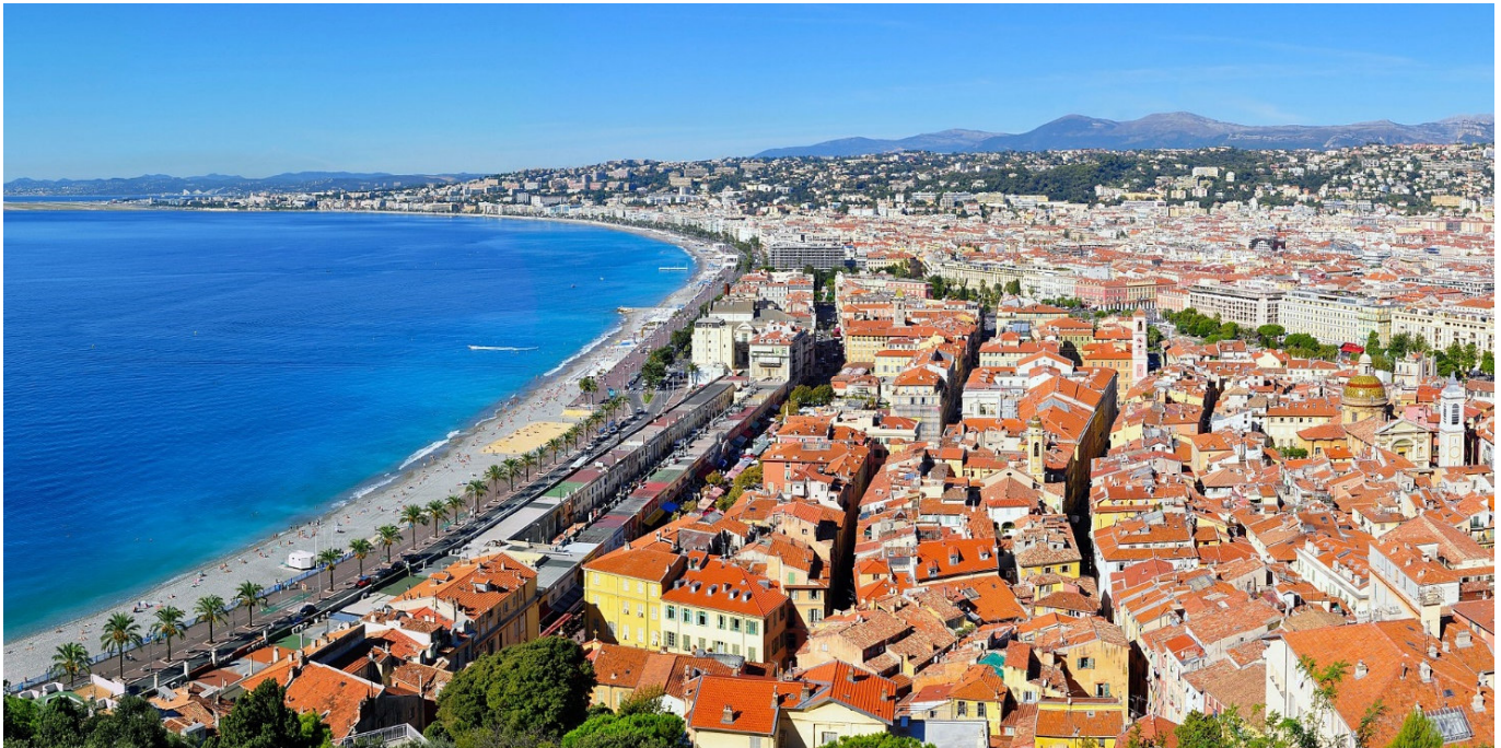
Blick auf Nizza vom Schlossberg

Wo die schroffen Felsformationen der Alpen auf die Milde des mediterranen Raumes treffen, entstand die bezaubernde Landschaft der Côte d'Azur. Lange bevor der europäische Adel im 19. Jh. die Schönheit der französischen Riviera entdeckte, waren entlang der römischen Via Aurelia bereits zahlreiche Städte und Siedlungen entstanden. Heute sind es elegante Städte, abgeschiedene Dörfer und großartige Berglandschaften, die diesem Küstenstreifen einen unverwechselbaren und faszinierenden Charakter verleihen.