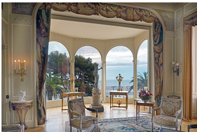
Großer Salon, Villa Ephrussi de Rothschild

Danach geht es weiter auf die Halbinsel Cap Ferrat, hier besuchen Sie die Villa Ephrussi de Rothschild . Das Landhaus der kunstsinnigen Baroness mit seinen liebevoll angelegten Gärten bietet herrliche Ausblicke auf das Meer und die Küste. Die elegant ausgestatteten Räume und Salons gruppieren sich um einen Innenhof, in dessen Laubengängen Sie kostbare Kunstwerke entdecken.