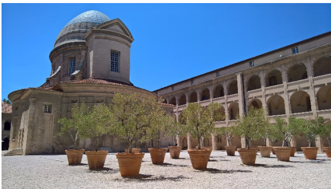
Vieille Charité im Altstadtviertel le Panier

Bei Ihren Besuchen ausgewählter Ausstellungsorte erkunden Sie u. a. das Altstadtviertel Le Panier , das in den vergangenen Jahren teilweise saniert wurde. Wohl nirgendwo sonst wird der Kontrast von Tradition und Moderne so deutlich. Im Zentrum liegt weithin sichtbar die monumentale Kathedrale , die unter Napoleon III. im neobyzantinischen Stil erbaut wurde.