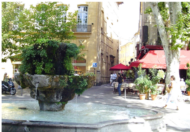
Cours Mirabeau in Aix-en-Provence

Ein kurzer Spaziergang führt Sie dann auf den kleinen Hügel Les Lauves , von dem sich eine wunderschöne Aussicht in die typisch provenzalische Landschaft und auf die imposante Gebirgskette Sainte-Victoire bietet. Cézanne ging jeden Tag auf diesen Hügel, um von dort aus seine berühmten Ansichten des Berges zu malen. Auf dem Aussichtshügel, inmitten einer wunderschönen Natur, werden Sie den Bildern, Gedanken und Ideen Cézannes nahe kommen.