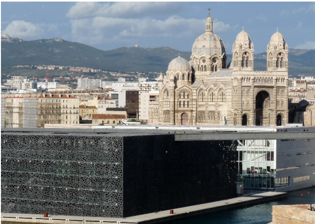
Kathedrale und MuCEM im Hafen von Marseille

In den vergangenen Jahren hat sich das multikulturelle Marseille von einer Stadt mit Charakter und bewegter Geschichte zu einer kreativen, modernen Metropole entwickelt. Schon immer war die lebhafte Hafenstadt ein Schmelztiegel der Kulturen – Griechen und Römer, Goten und Franken, Franzosen und Nordafrikaner, sie alle haben ihre Spuren hinterlassen und prägen die weltoffene Atmosphäre der südfranzösischen Stadt.