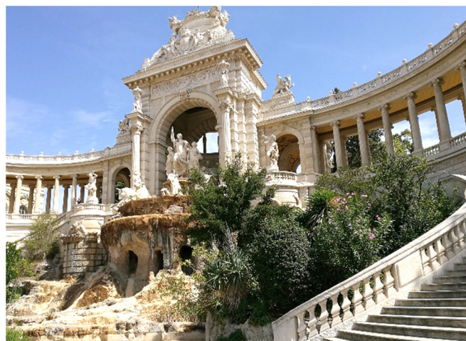
Palais Longchamp

So besuchen Sie auch das Viertel Belle de Mai, das sich nordöstlich des Hauptbahnhofs befindet. Auf dem Areal der ehemaligen Saita-Tabakfabrik entstand in den 1990er Jahren das lebendige Kulturzentrum Friche la Belle de Mai . Es überrascht seine Besucher immer wieder mit einer interessanten Mischung aus Kunst, Design, Musik und Theater.