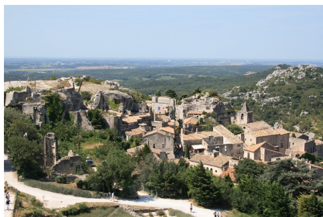
Les Baux

Anschließend führt ein Spaziergang durch das Bergdorf Les Baux , das malerisch auf einem Felsplateau liegt und von einer mächtigen Burgruine überragt wird. Nachdem das Dorf von seinen Bewohnern verlassen wurde, haben sich hier viele Künstler und Galerien angesiedelt. Zum Ausklang Ihrer Reise genießen Sie noch einmal herrliche Aussichten auf die Traumlandschaften der Provence.