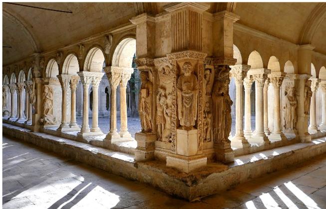
Kreuzgang Saint-Trophime

Das bedeutendste Beispiel mittelalterlicher Architektur ist die Kathedrale Saint-Trophime . Detailreich erzählen die Skulpturen am Portal und an den Kapitellen des Kreuzgangs aus der Bibel. Inspiriert von den Formen der Antike sind die Darstellungen ein Meisterwerk der südfranzösischen Romanik .