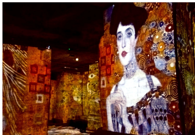
Carrières de Lumières in Les Baux

In einigen dieser Höhlen erleben Sie eine spektakuläre Lichtinszenierung: die „ Carrières de Lumières “. Jedes Jahr konzipieren die Veranstalter eine neue Bildershow aus dem Bereich der Kunstgeschichte, die auf die Säulen, Pfeiler, Wände und auf den Boden projiziert wird. Lassen Sie sich von diesem einzigartigen Kunsterlebnis begeistern!