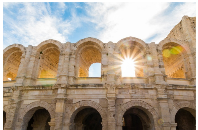
Amphitheater in Arles

Zunächst erkunden Sie bei einem gemeinsamen Rundgang das historische Erbe der einstigen Lieblingsstadt römischer Kaiser am Ufer der Rhône. Mit dem Amphitheater und dem römischen Theater sehen Sie die zwei bekanntesten Bauwerke aus der Antike. Unter dem Forum der römischen Stadt haben Archäologen die Kryptoportiken entdeckt. Die Funktion der unterirdischen Säulengänge ist bis heute rätselhaft geblieben.