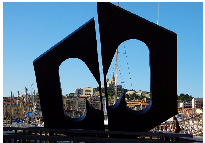
Im Alten Hafen

Bei einem gemeinsamen Abendessen in einem ausgesuchten Restaurant stimmen Sie sich am Abend auf die Kunsterlebnisse der kommenden Tage ein.