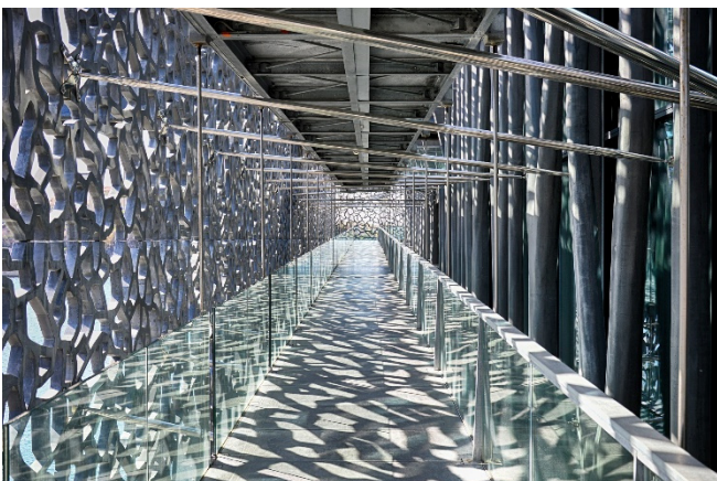
MuCEM in Marseille

Mit der Villa Méditerranée sehen Sie in direkter Nähe ein weiteres Juwel zeitgenössischer Architektur. Zusammen mit dem historischen Fort Saint-Jean bilden diese modernen Gebäude das kulturelle Zentrum der neuen Stadtvision.