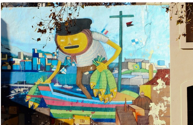
Graffiti-Kunst im Cours Julien

Ebenso spannend ist das Szeneviertel rund um den Cours Julien . Früher fand hier in den Lagerhallen der Obst- und Gemüsemarkt von Marseille statt. Nach einer umfassenden Renovierung prägen heute schicke Boutiquen und trendige Lokale das Bild. Viele Hauswände sind mit hochwertigen Graffitis geschmückt.