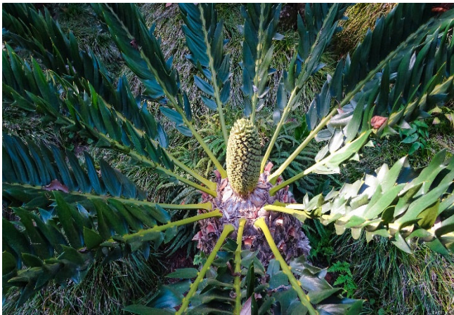
Tropical Garden Monte CCBY-SA2.0 VillageHero-at-flickr

In Monte besuchen Sie den Monte Tropical Garden . Dieser eindrucksvolle Garten ist in Harmonie zur Vegetation Madeiras. Sein Besitzer José Berardo war von seinen China- und Japan-Reisen inspiriert , als er diesen verwunschen wirkenden Garten gestaltete, der auch viele Beispiele der typischen portugiesischen Kachelbilder (Azulejos) zeigt. Hier findet man in einem romantischen Garten viele auf Madeira gedeihende Pflanzen wie blaue Hortensien, Clivien, Palmen und uralte Baumfarne.