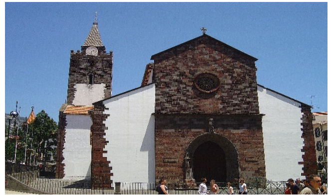
Sé Funchal

Im Anschluss besuchen Sie die 1516 eingeweihte Sé Catedral de Nossa Senhora da Assunção , mit einer wunderschönen Decke aus Zedernholz und Elfenbein-Einlegearbeiten sowie den Palast São Lourenço .