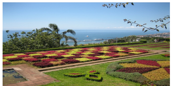
Botanical Garden Funchal

Heute unternehmen Sie einen Spaziergang durch den farbenprächtigen Botanischen Garten von Funchal. Er begeistert mit rund 25.000 Pflanzen aus unterschiedlichen Bereichen. Große bunte Teppichbeete sind eine außergewöhnliche Attraktion, ein origineller Figurengarten sowie der artenreiche Kakteen- und Sukkulentengarten zeigen ungewöhnliche Formen und spannende Gestaltungen von Pflanzen aus aller Welt. Majestätische Araukarien, leuchtendrote Korallenbäume, mexikanische Schraubenbäume und immergrüne Palmfarne sind hier neben den stets präsenten prächtigen Strelitzien aus Südafrika zu bewundern. Genießen Sie zudem einen einmaligen Blick über blühende Pflanzen bis hinunter zum Meer.