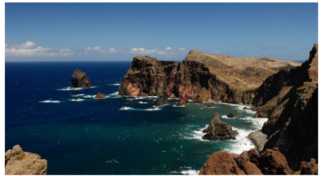
São Lourenço

Der landschaftlich beeindruckende Rückweg zum Hotel führt am kleinen Fischerdorf Porto da Cruz vorbei , das zu Füßen des mächtigen Penha de Aguiã „Adlerfelsen“ liegt. Danach geht es über den Portela-Pass zum östlichsten Punkt der Insel, der vom Atlantik umtosten Halbinsel Ponta de São Lourenço . Zwischen den bizarren Lavafelsen entdecken Sie eine kontrastreiche Steppenvegetation. Auf dem Rückweg sehen Sie noch den idyllischen Fischerhafen Machico an der Südostküste, wo im Jahr 1419 die portugiesischen Entdecker landeten und ihre erste Siedlung gründeten.