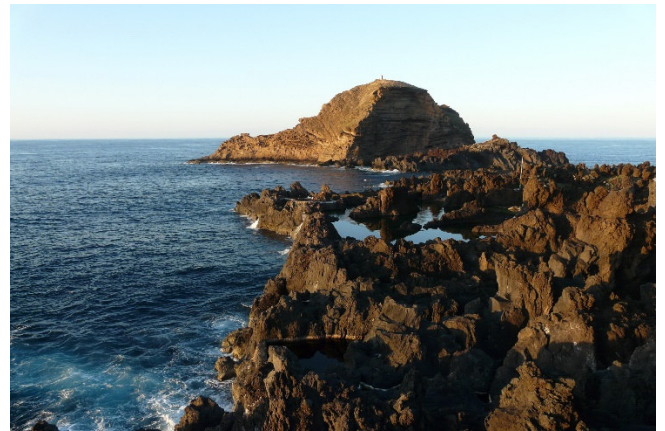
Porto Moinz

Sie besichtigen den an der Nordküste Madeiras liegenden Ort Porto Moinz . Dieser besitzt mehrere natürliche Lava-Bäder , die Pescina Naturais. Noch einmal fasziniert der eindrucksvolle Blick über die großen Felsen und das wilde Meer. Außerdem sehen Sie die Santa Maria Magdalena do Mar aus dem 15. Jh., eine der ältesten Kirchen Madeiras.