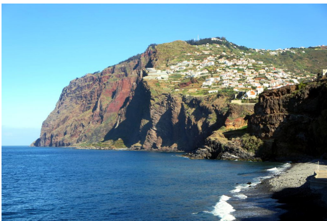
Cabo Girão

Sie besuchen das Cabo Girão , dessen Felsen 580 m über dem Meeresspiegel in den Himmel ragen und damit die höchste Steilküste Europas darstellt. Genießen Sie dort die herrliche Aussicht.