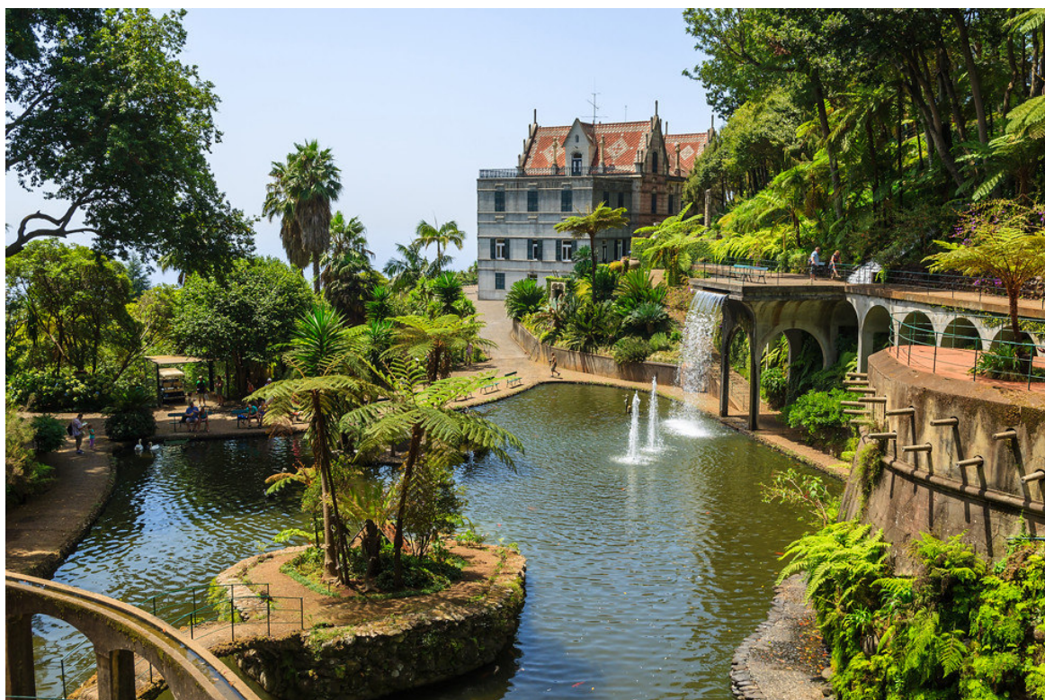
Monte Garden

Madeira ist eine facettenreiche Insel, voller farbenfroher Vegetation und eindrucksvollen, schroffen Bergwelten. Es ist ein wahres Potpourri, deren Definitionen allzu oft ineinander übergehen. Madeira ist eine gebirgige Insel vulkanischen Ursprungs, doch an einer Stelle brechen die Gesetzmäßigkeiten auf und eine eindrucksvolle Hochebene erstreckt sich vor Ihnen.