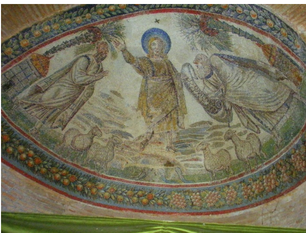
Santa Costanza

Gemeinsames Begrüßungsabendessen im Hotel.