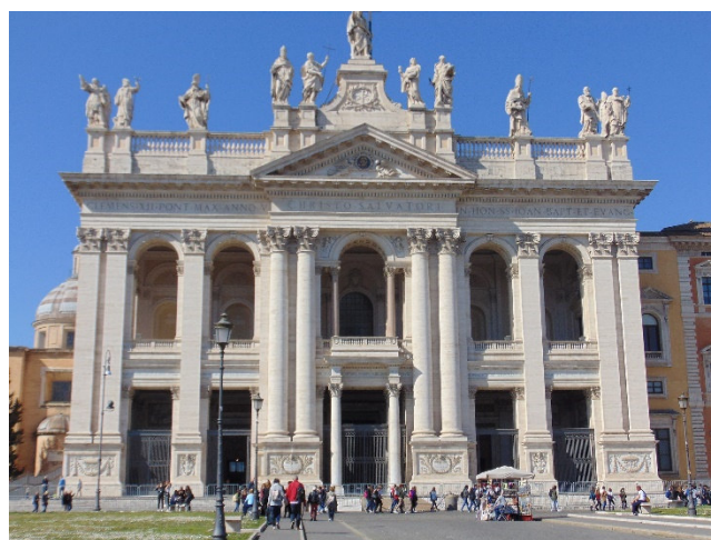
San Giovanni in Laterano

Ganz in der Nähe erwartet Sie ein weiteres architektonisches Schmuckstück , die Kirche Santo Stefano Rotondo . Hier verschmelzen in einem Rundbau, dem ein griechisches Kreuz hinzugefügt wurde, zwei Grundtypen des Kirchenbaus zu einer besonderen Einheit. Errichtet wurde die Kirche unter Papst Simplicius (468–483) genau über einer früheren Mithras-Kultstätte.