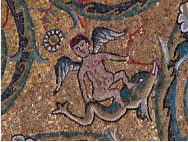
San Clemente Mosaik

Freuen Sie sich heute auf die faszinierende Kirche San Clemente , die über einem Mithras-Heiligtum neben noch sichtbaren altrömischen Wohnhäusern entstand. Die Unterkirche gilt als eine Schatzkammer der romanischen Wandmalerei . In der Oberkirche sehen Sie wunderschöne Renaissancefresken in der kleinen Katharinenkapelle.