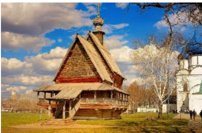
Suzdal' Kirche

Sie besuchen u. a. das bedeutende und gut erhaltene Erlöser-Euthymios-Mönchskloster (UNESCO-Weltkulturerbe) . Außerdem besichtigen Sie den Kreml (UNESCO-Weltkulturerbe) mit den Erzbischöflichen Gemächern (15. – 18. Jh.) und dem Ikonenmuseum, welches herausragende Ikonen aus der 1000-jährigen Geschichte der Stadt ausstellt.