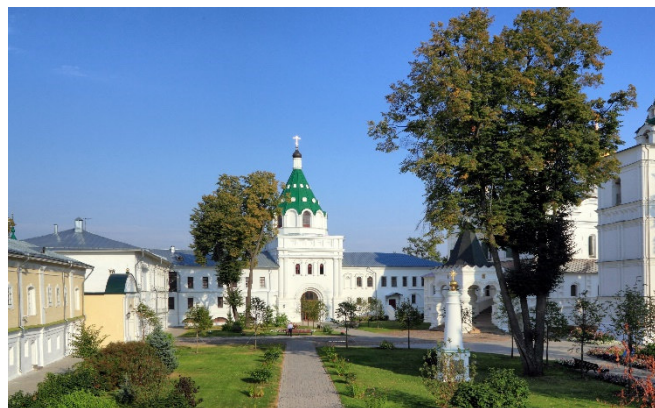
Ipatiev Monastery Kostroma

Wolga einfügt. In der Dreifaltigkeits-Kathedrale wurde im Jahr 1614 der erste Zar der Romanow-Dynastie gekrönt. Im angrenzenden Freilichtmuseum sehen Sie eine interessante Auswahl der für die Region typischen Holzhäuser . Das Stadtzentrum von Kostroma ist überwiegend klassizistisch geprägt und vermittelt einen guten Eindruck von der Atmosphäre einer wohlhabenden russischen Provinzstadt des 19. Jh. im Wolgagebiet. In den liebevoll restaurierten Arkaden der historischen Handelsreihen befinden sich noch heute Läden und Marktstände.