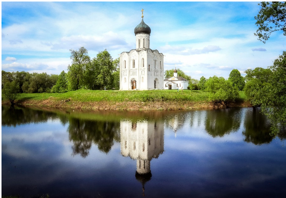
Mariä-Schutz-Kreuzkuppelkirche am Nerl'

Entdecken Sie die Wiege der russischen Geschichte und Kultur nordöstlich von Moskau, und lassen Sie sich von den wunderschönen Städten des Goldenen Rings begeistern!