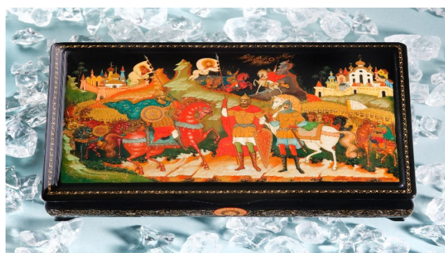
Lackminiaturmalerei aus Palech CCBYSA2.0 Jürg Vollmer-at-flickr

Sie besuchen das Isaak-Lewitan-Museum , das dem Leben und Werk des größten russischen Landschaftsmalers gewidmet ist.