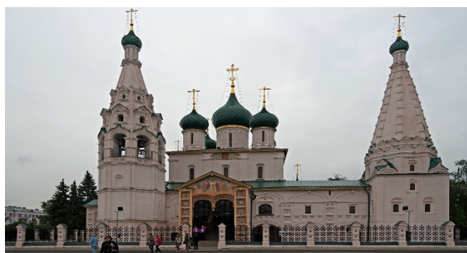
Jaroslawl Kirche

Bei Ihrem Stadtrundgang besuchen Sie das von einer mächtigen Mauer umgebene Erlöser-Kloster, in dessen Zentrum sich das Christi-Verklärungs-Kloster erhebt. Ein Juwel altrussischer Freskenmalerei ist die Prophet-Elias-Kirche , deren kunstvolle Ausgestaltung einen Einblick in das Alltagsleben des 17. Jh. bietet. Anschließend lassen Sie bei einer kurzen Schiffahrt auf der Wolga das Panorama der Stadt vorbeiziehen.