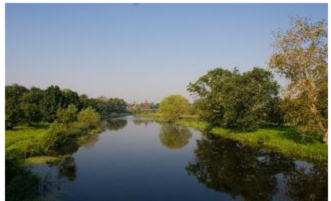
Landschaft Vladimir Suzdal' CCBYSA2.0 Loris Silvio Zecchinato-at-flickr

Heute schließt sich der „Goldene Ring“ und Sie fahren wieder Richtung Moskau.