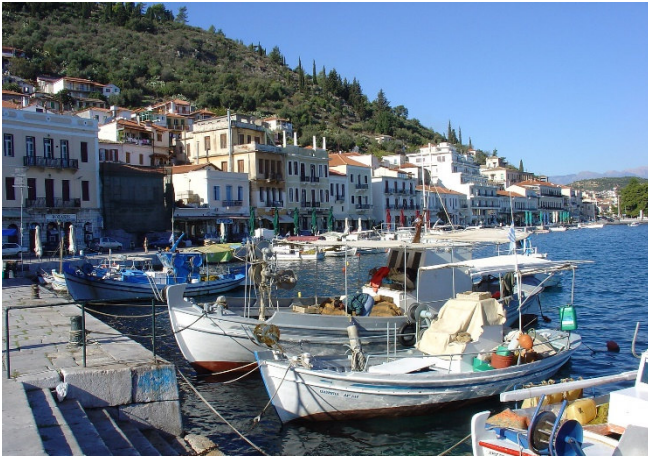
Hafen von Gythio

Flug von Köln über München nach Athen (andere Abflughäfen auf Anfrage). Begrüßung durch Ihre örtliche Reiseleitung und Fahrt zu Ihrem Hotel in Gythio. Das beschauliche Hafendstädtchen im Süden des Peloponnes ist Ihr Standort für die ersten 2 Übernachtungen. Bei einem gemeinsamen Abendessen in einer typisch griechischen Taverne lernen Sie die Teilnehmer Ihrer Reisegruppe kennen.