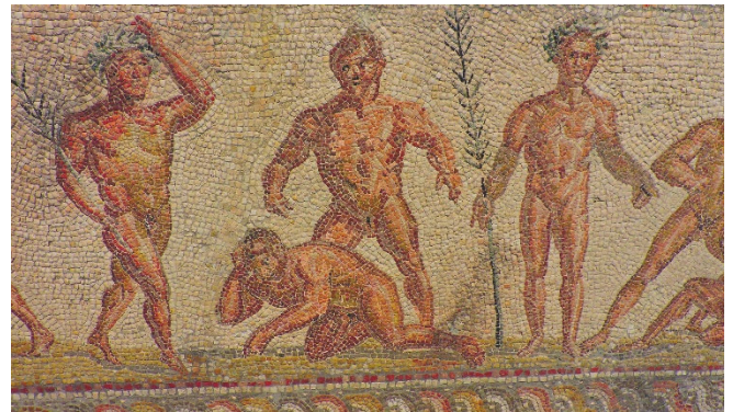
Mosaik im Archäologischen Museum Patras

Am Nachmittag führt ein Ausflug nach Bassae . Ein besonderes Erlebnis ist der Aufstieg zum Apollon-Tempel , der einsam in einer traumhaft schönen Gebirgswelt liegt. Das antike Bauwerk aus dem 5. Jh. v. Chr. war ein Meisterwerk des Architekten Iktinos und gehört heute zum UNESCO-Weltkulturerbe . Besonders schön ist auch der Ausblick auf die Gipfel der umliegenden Berge. Zurück in Olympia bleibt Zeit zur freien Verfügung. Mit einem gemeinsamen Abendessen im Hotelrestaurant klingt der Tag aus.