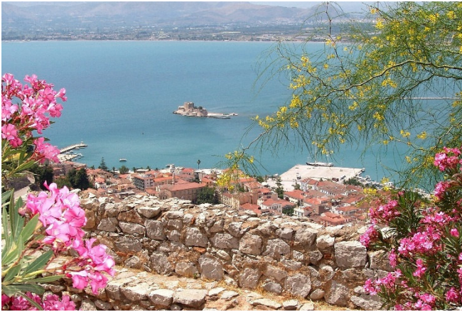
Blick auf Nauplia

Nach der ausführlichen Besichtigung fahren Sie weiter in das malerisch gelegene Hafenstädtchen Nauplia am Golf von Argolis. Genießen Sie das besondere Flair der Stadt bei einem Bummel durch die Gassen und entlang des Hafens. Zahlreiche Tavernen und gemütliche Cafés bieten griechische Gastlichkeit und laden zum Verweilen ein.