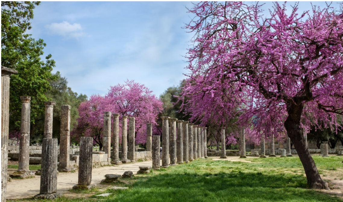
Olympia CCBY Kristoffer Trolle-at-flickr

Eine Reise durch die zauberhaften Landschaften des Peloponnes ist eine Entdeckungsfahrt zu den Wurzeln unserer abendländischen Kultur . Die Höhepunkte antiker Literatur und Philosophie , die Formensprache aus Architektur und Kunst und die Ideen aus Wissenschaft und Politik wurden zum Grundstein europäischen Denkens und Handelns.