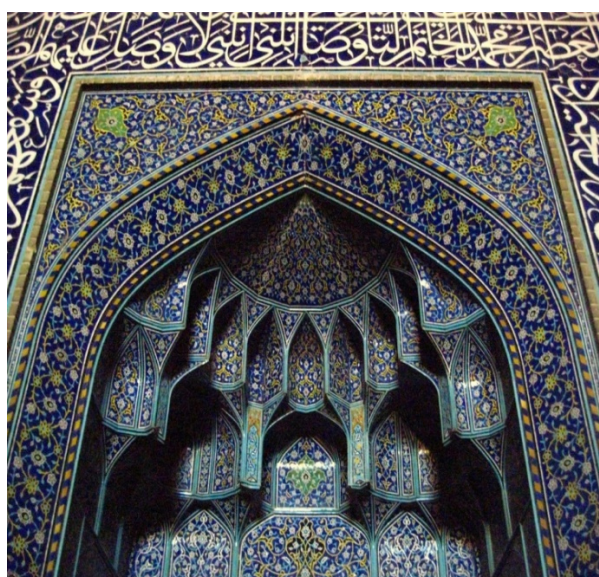
Isfahan - Sheik Lotfollah Mosque

Im Rajayi-Park, auch als Nachtigallen-Garten bekannt, treffen Sie auf den Hasht-Behesht-Palast , der aus dem 17. Jh. stammt. Ein Teil des schönen Freskenschmucks ist noch vorhanden und lässt die einstige prächtige Ausstattung erahnen. Die Medrese Chahar Bagh , das letzte Meisterwerk aus der Safawidenzeit, fällt schon von weitem durch ihre prächtige, 37 m hohe Kuppel auf (Außenbesichtigung, da Theologische Hochschule in Betrieb ist).