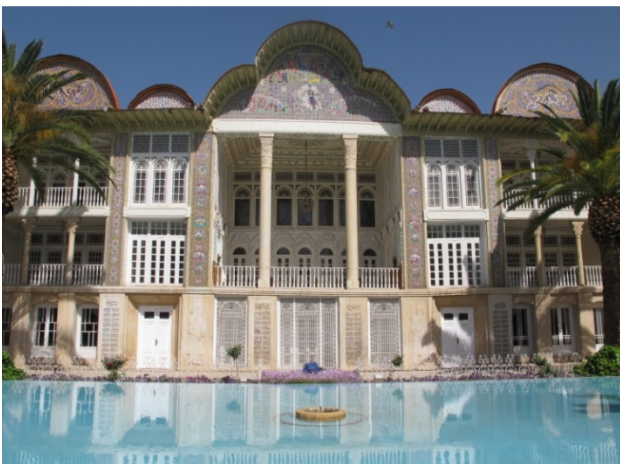
Schiraz - Bagh Eh Eram Botanischer Garten