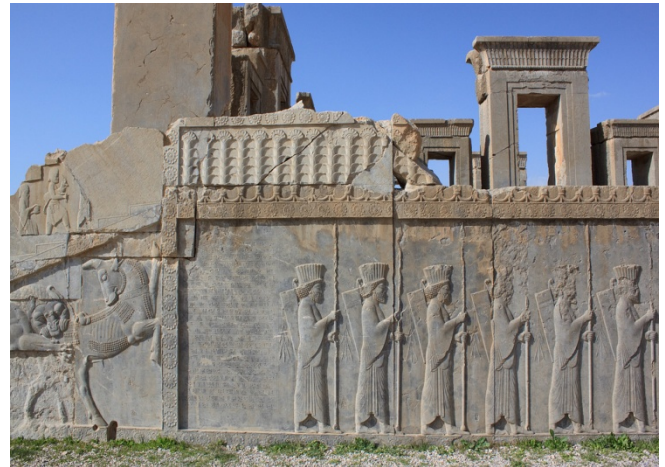
Persepolis - Wand

der eingehenden Besichtigung Fahrt zur Nekropole Naqsh-e Rostam mit sasanidischen Felsenreliefs und Gräbern von Achämenidenkönigen, die in eine steil abfallende Felswand geschlagen wurden. Wieder zurück in Schiraz setzen Sie Ihr Besichtigungsprogramm fort und besuchen die Gartengräber der persischen Dichter Saadi und Hafis.